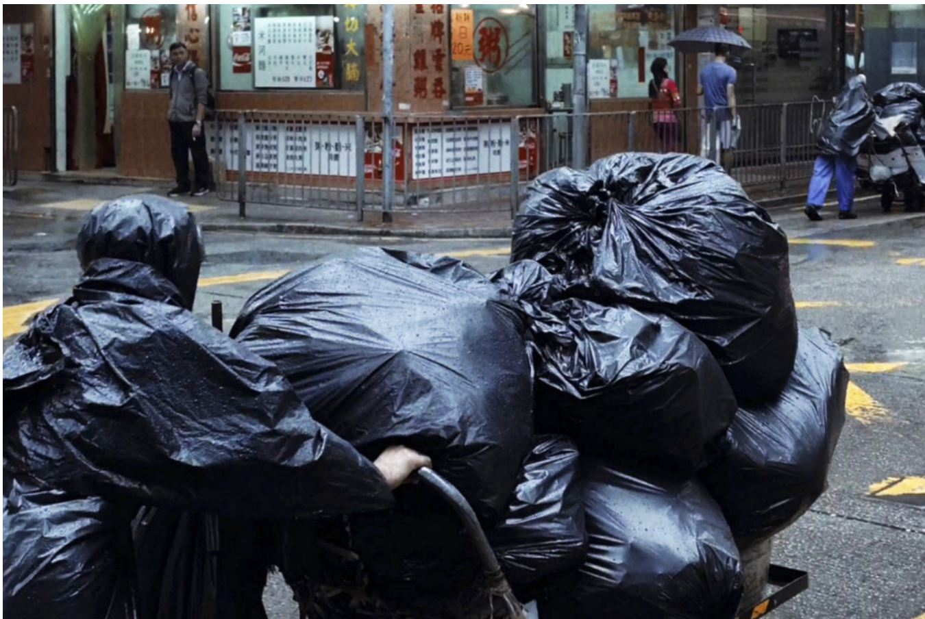
《十方之地》剧照。

当我们以更宏观的角度观察，残楼与沙中线、天光墟与堆填区、穷人与私楼，这些全被置于景框内的矛盾元素，社会却透过不同形式的资源回收，形成了资本的循环。曾有观众赞扬电影纪录了不再同样的天光墟生态和街道风景，为社区历史留下印证。黄形容《十方》并非仅为纪录，更重要的是揭视。当社会与经济的循环不息，物极必然遭至反扑，天光墟代表以物易物的市场制度终将重现人前。