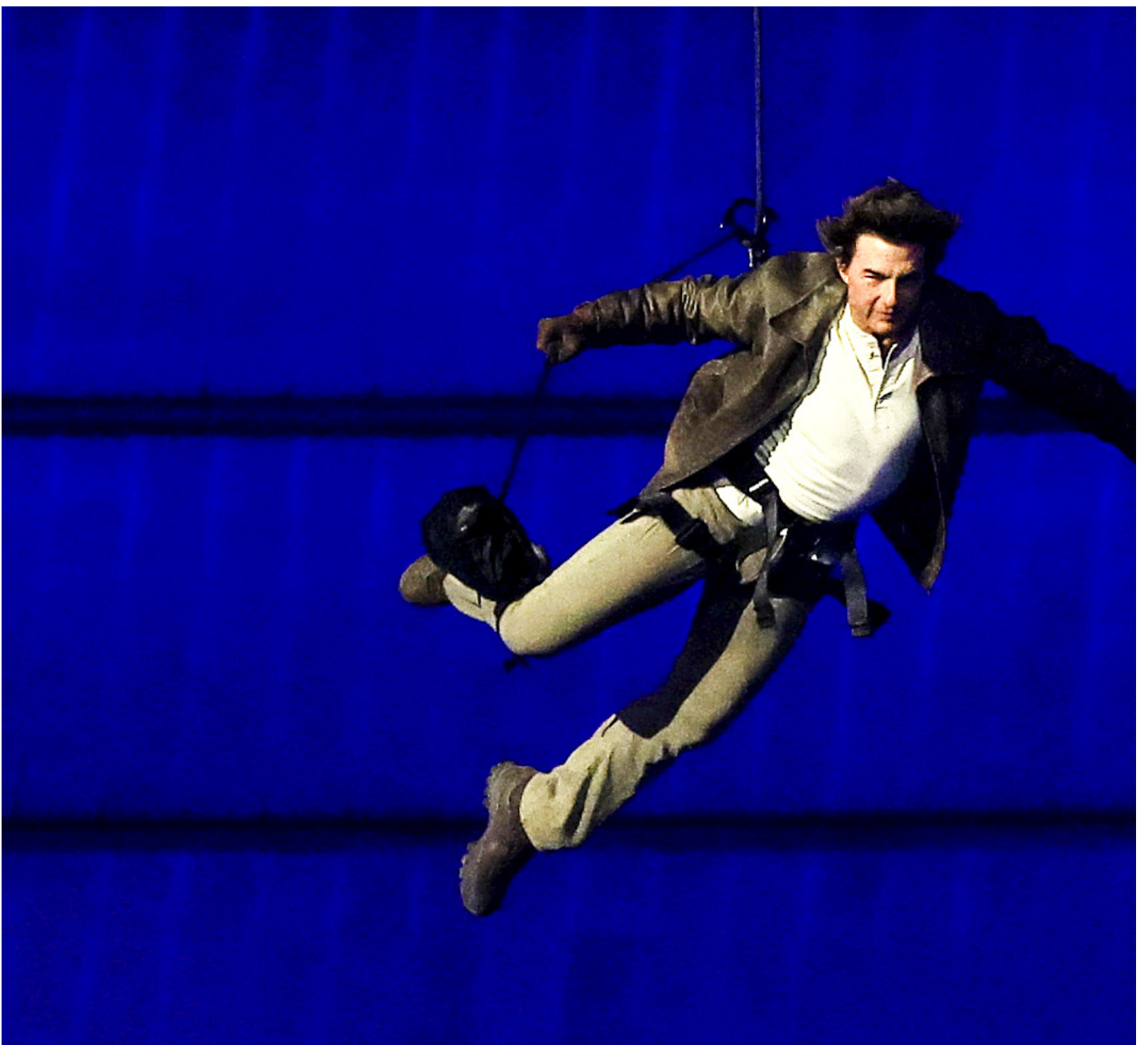
2024年8月11日，美国巨星汤姆克鲁斯在巴黎奥运会闭幕式上骑著一辆带有国际奥委会旗帜的电单车离开会场。

但因开幕式的成功与法国代表团的优异表现，不少法国评论一转先前的批评态度，对奥运表现出极大的热情，把这短短两周变成了以不同种族、国家和政治立场的人聚集在一起的乌托邦节庆。似乎，在一个因政治环境而分裂的国家，奥运会成功地将法国人团结在一起，仿佛先前欧洲议会选举和法国议会解散再选、极右翼的威胁都不复存在。