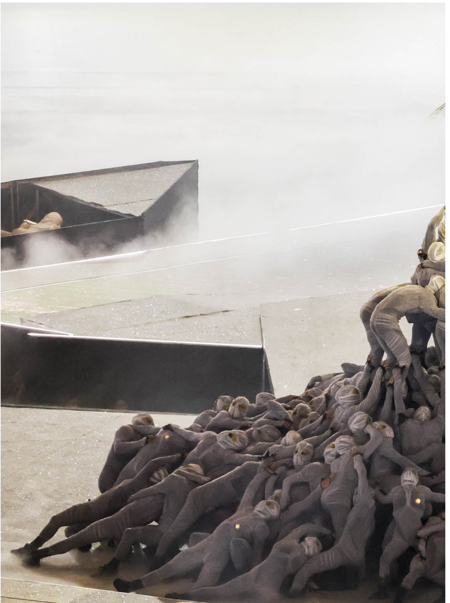
2024年8月11日，“金航者”（Golden Voyager）在巴黎奥运闭幕礼上进行表演。

巴黎奥运开闭幕式导演乔利在整个戏剧导演生涯里都坚持“大众戏剧”，坚持更加体制化的艺术与流行、都市、现代艺术的杂糅。闭幕式相比开幕式更加传统，但也可以看到严肃题材里的戏谑、对科幻主题的挪用、歌剧和摇滚以及 breaking 舞蹈和杂耍的并置。这种古典与当代文化平等的审美立场，哲学家 Sandra Laugier 称为“第二轮立法选举的直接延伸，是第三轮美学选举，标志着对极右翼的否定，以及对法国、文化及其等级制度的某种看法”。