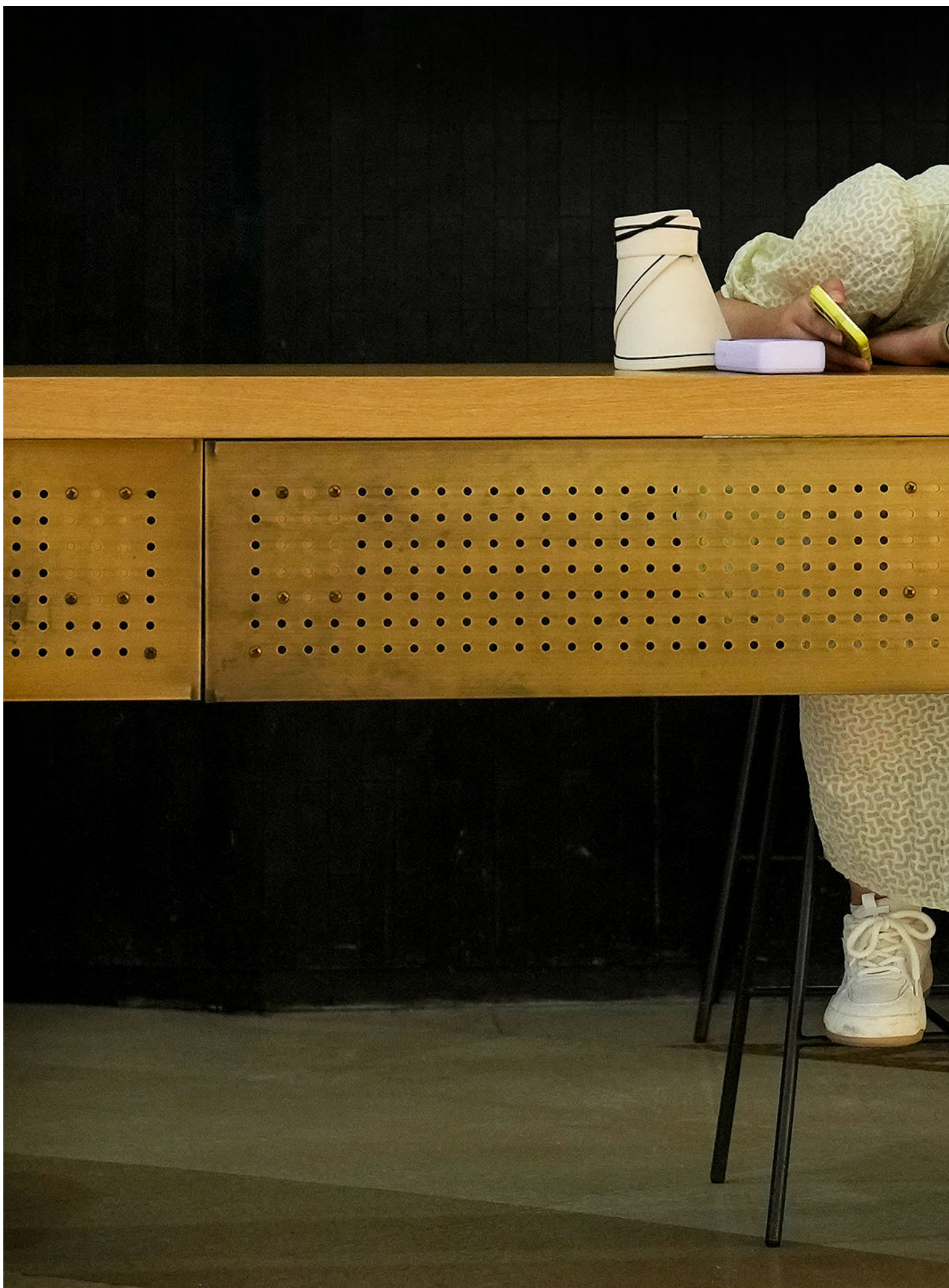
2023年6月21日，中国北京，一家咖啡店内女士在看手机。

饭圈主动靠近权力数年后，到了2019年夏天，香港反送中运动开始引发“饭圈女孩捍卫阿中哥哥”，人民日报、环球时报、共青团中央皆对此 大为赞赏 ，饭圈文化和爱国合二为一。