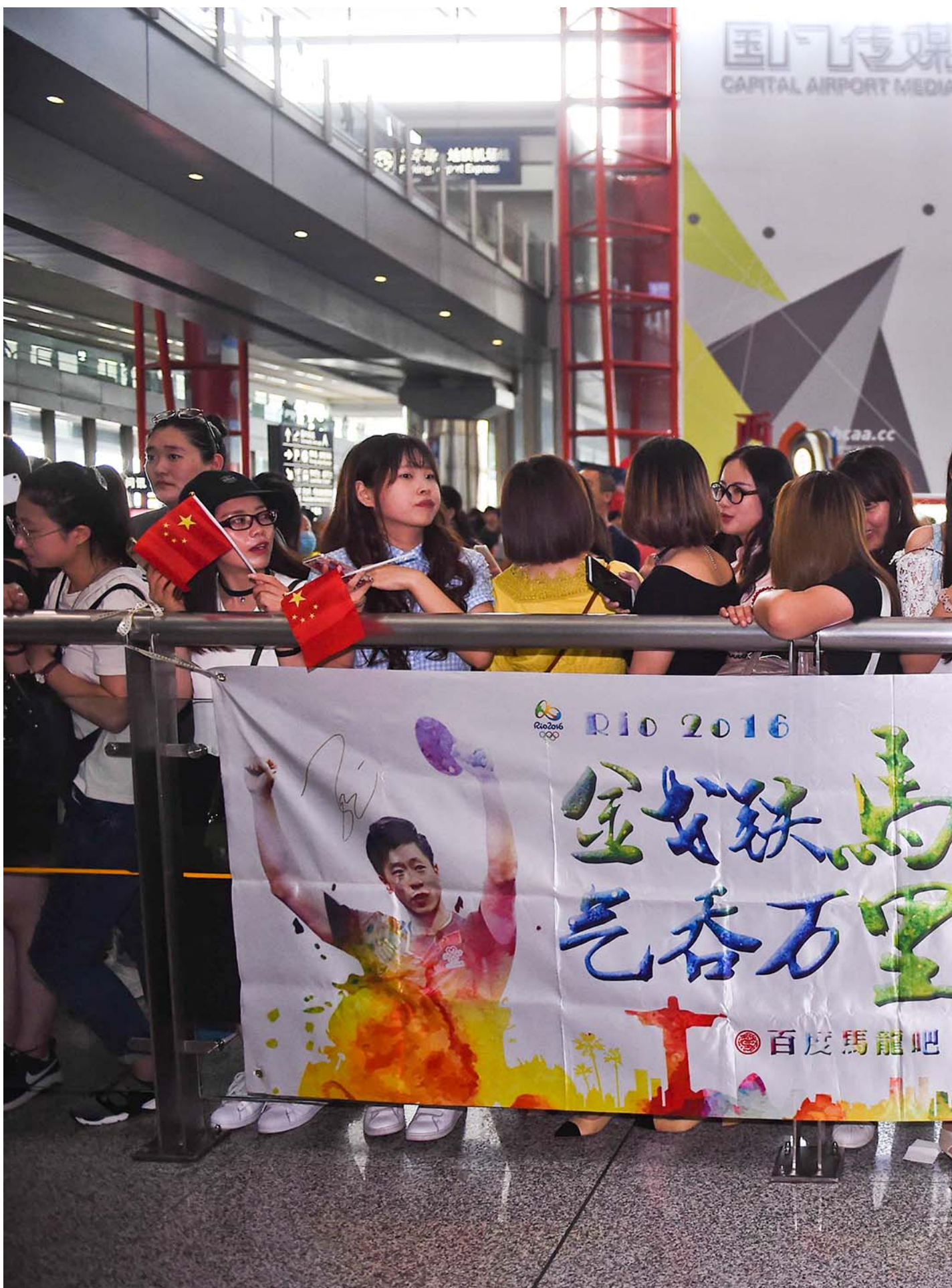
2016年8月20日，中国北京，球迷在机场欢迎中国乒乓球成员奥运夺奖后回国。

连早已退役或未登顶的选手都在“圈新粉”，例如一直没有成为超一流选手的陈玘，他被新一代乒乓球粉丝关注到，主要是因为老照片中长相较为锋利俊美，具有某种男爱豆特质。