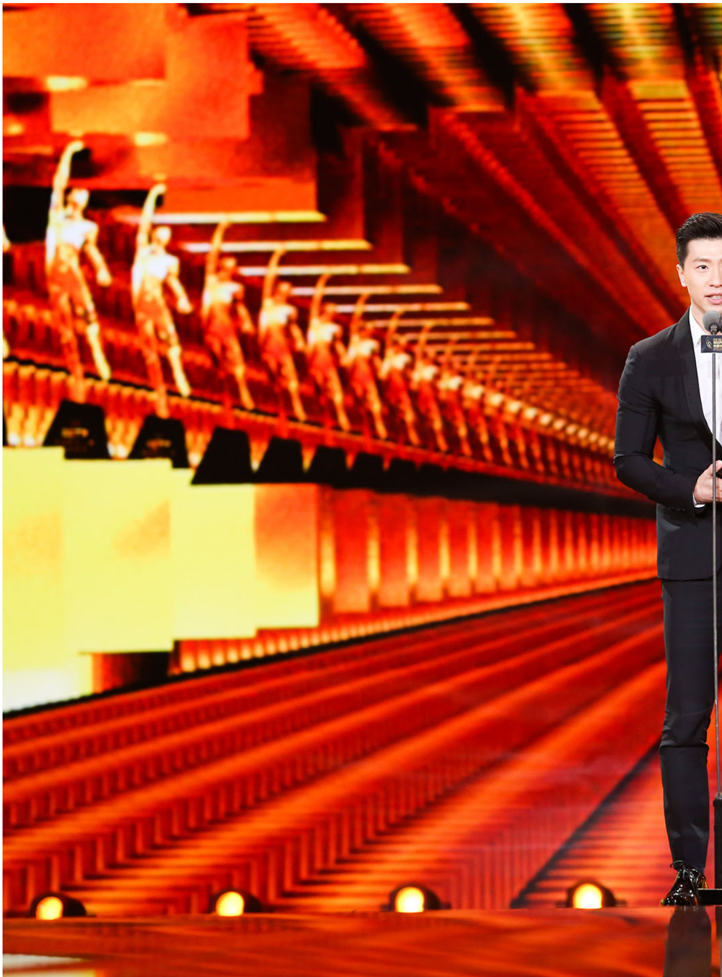
2016年1月15日，中国北京，乒乓球运动员马龙出席2016年度体育人物颁奖典礼。

也即，“饭圈”是当代中国年轻人一种仅存的社会参与方式。年轻女孩通过追星，满足了自己的幻想，参与了某一种改变体验了权力感（让我的偶像走花路、通过舆论闹事开掉我不喜欢的经纪人、通过集体到微博评论里示威为偶像争取署名顺序），同时结交了同样兴趣爱好朋友。