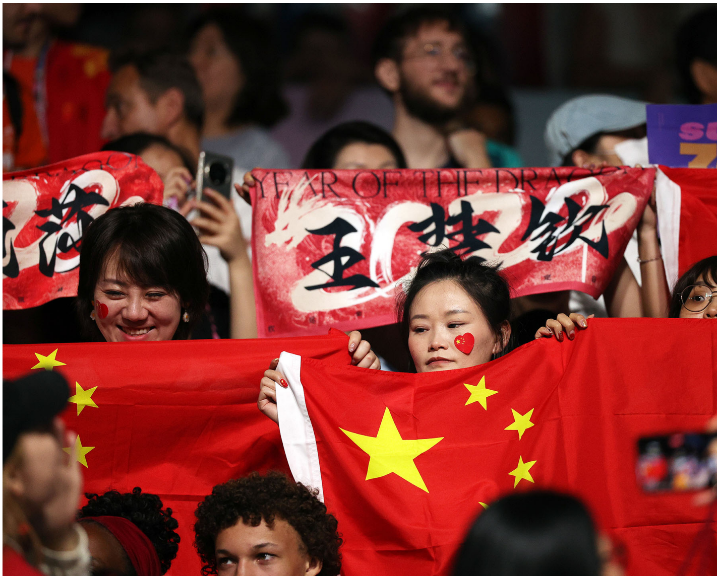
2024年7月31日，法国巴黎，中国乒乓球球迷观众席上欢呼。

【编注】端传媒“ 女人没有国家？ ”专栏，名字源于伍尔芙的一句话“ As a woman I have no country ”，但我们保留了一个问号，希望能从问号出发，与你探讨女性和国家的关系，聆听离散中的女性故事和女性经验。我是这个栏目的编辑符雨欣。