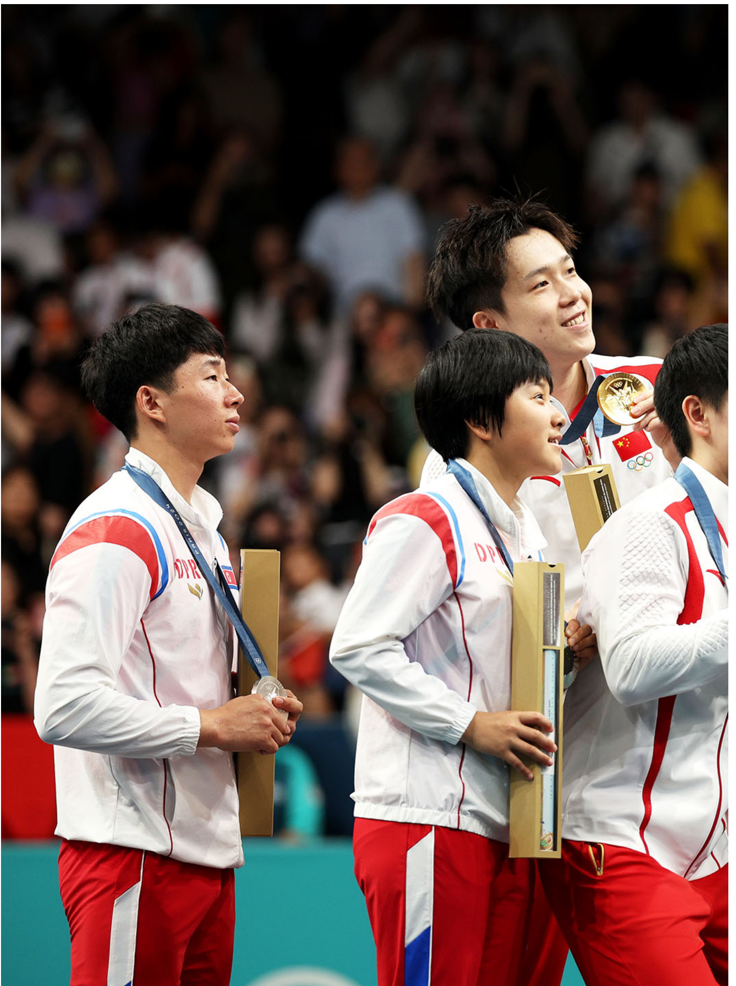
2024年7月30日，法国巴黎，中国队金牌得主王楚钦和孙颖莎（左）与朝鲜国家队（右）合影。

而所谓“饭圈入侵”，在每个体育项目都有不同程度的倾向。仅本届奥运中就包括男子游泳、男子双打羽毛球、男子体操等项目。