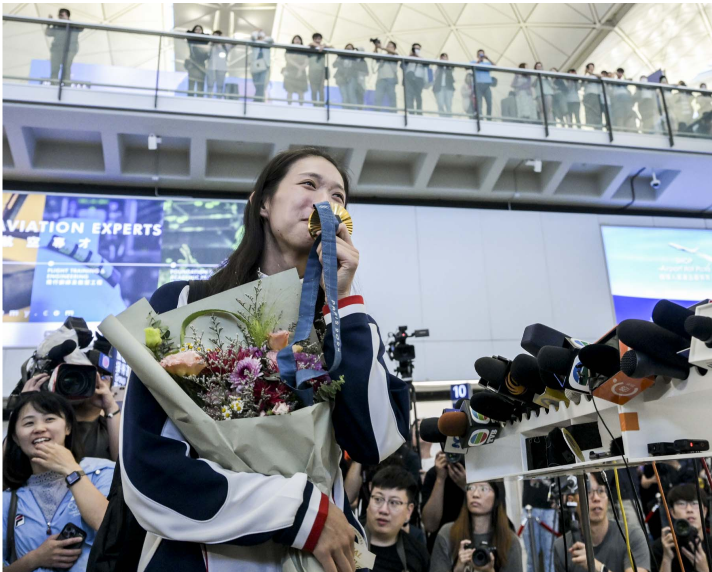
2024年8月1日，香港在巴黎奥运会上的首枚金牌获得者、佩剑运动员江旻德凯旋回港，在机场接受传媒采访时亲吻她的金牌。