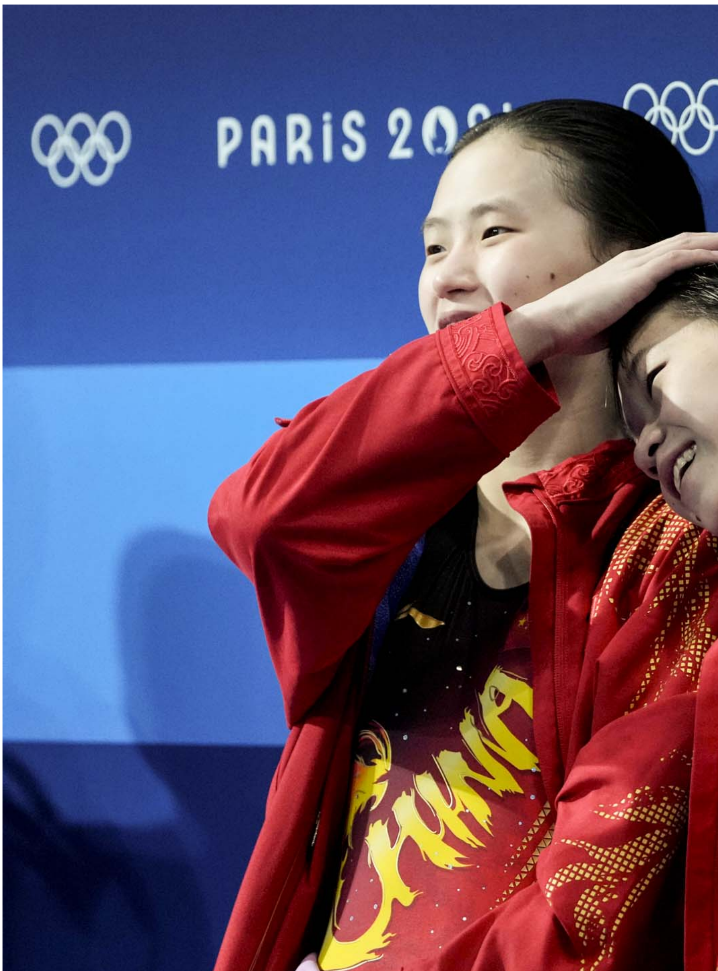
2024年7月31日，巴黎奥运女子双人10米跳台，中国选手全红婵和陈芋汐夺得金牌。

她在公众面前始终是同一个微笑表情。除了争议刚开始时，她点赞过咒骂2019年示威者的留言（现已删除）之外，基本没有流露出对现有舆论的激烈反应。