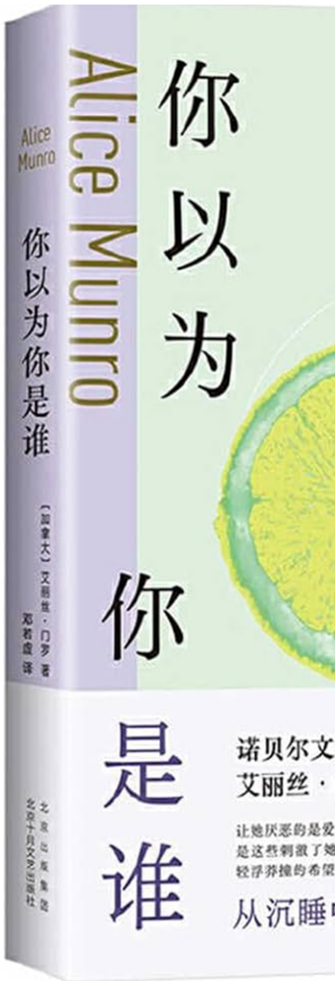
孟若小说集《你以为你是谁》(Who Do You Think You Are?)。

“这就是门罗把自己放置在遭受性剥削的环境下，更为贴近她本人的一种反应。当我们阅读《野天鹅》，反而会觉得少女的反应是对于女性被压抑的性欲望的对抗性，放置在小说背景下反而是‘女性主义的’，非常讽刺。”蒋方舟