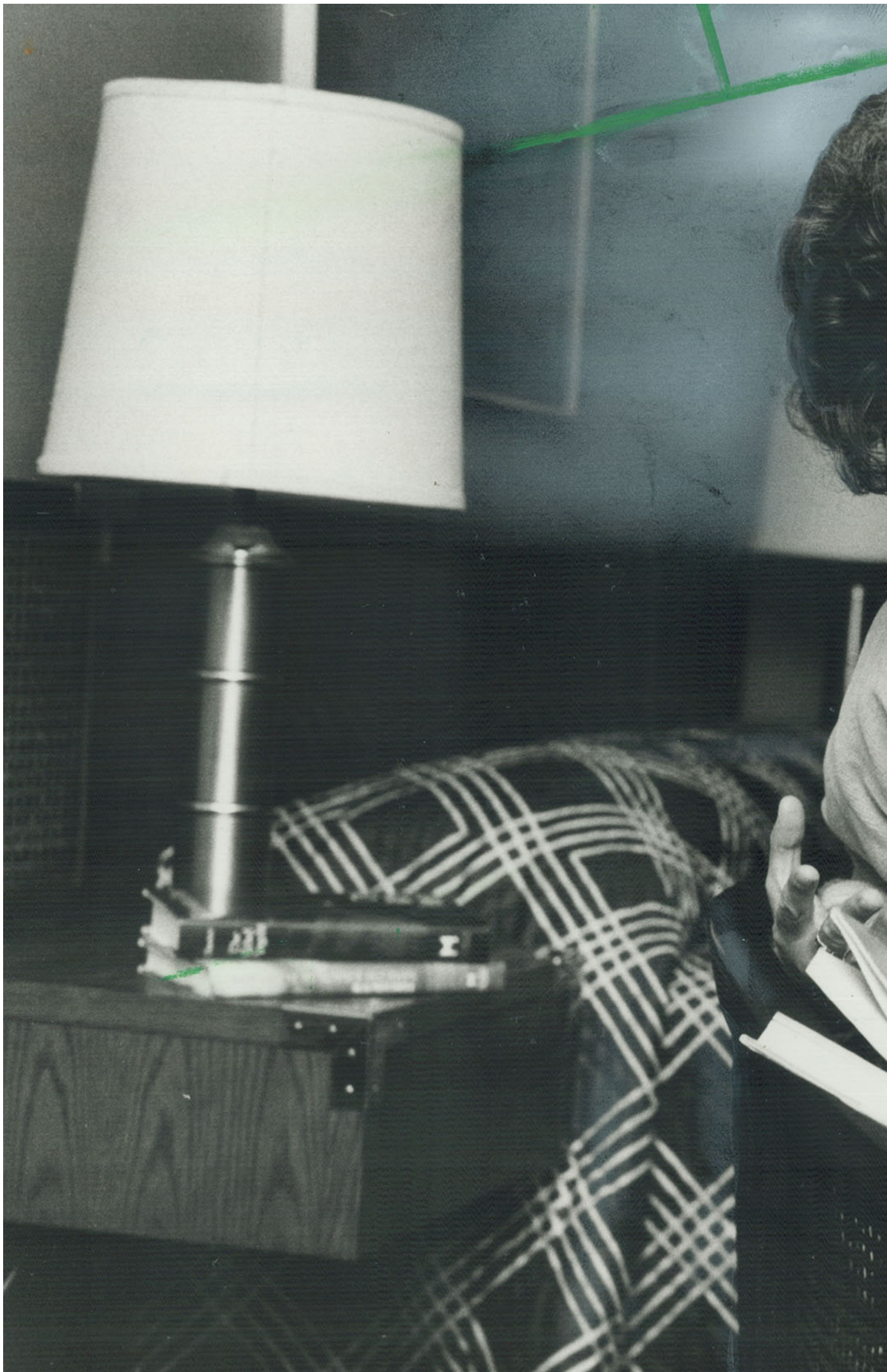
加拿大小说家艾莉丝·孟若 (Alice Munro)。

她重读孟若的作品时，也有下意识寻找她究竟内心如何处理女儿经历的蛛丝马迹，但Emily亦知道，可以被诠释的篇章太多了，几乎是任人说什么都可以。“Munro在真实中的平庸之恶是无容置喙，但人们对她的惩罚，也许不应包括我们尝试在她的作品中读出对应的‘恶’来。”她续道。