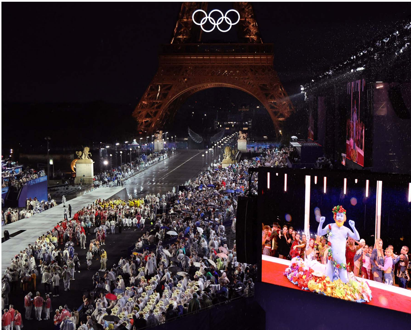
2024年7月26日，巴黎奥运，在奥运会开幕式上，观众正在观看法国歌手 Philippe Katerine 表演的画面。

重回一周前，2024年7月26日，你是否还记得巴黎奥运会的开幕式？那是一场长达约四个半小时的表演，有美感、活力、冒犯性，刺激感官。进行到一个半小时左右，塞纳河上缓缓升起10个为女性权力与权益奋斗的法国女性雕像（因技术故障，波伏娃的雕像未升起），两个半小时后则是满屏的变装皇后、酷儿，穿著艳丽活泼的人们。两名表演者共享同性之吻，三位不同种族的表演者互相亲吻后在镜头面前关上门，引人遐想。在屏幕前看到这些的女性主义者与酷儿们，很难不微笑和振奋起来。对于中文世界来说，这也是还不那么被主流社会接受的酷儿形象第一次登上世界级的舞台。