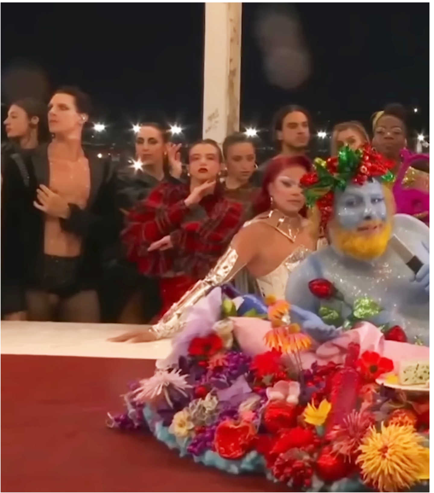
巴黎奥运开幕式仿《最后的晚餐》的片段。