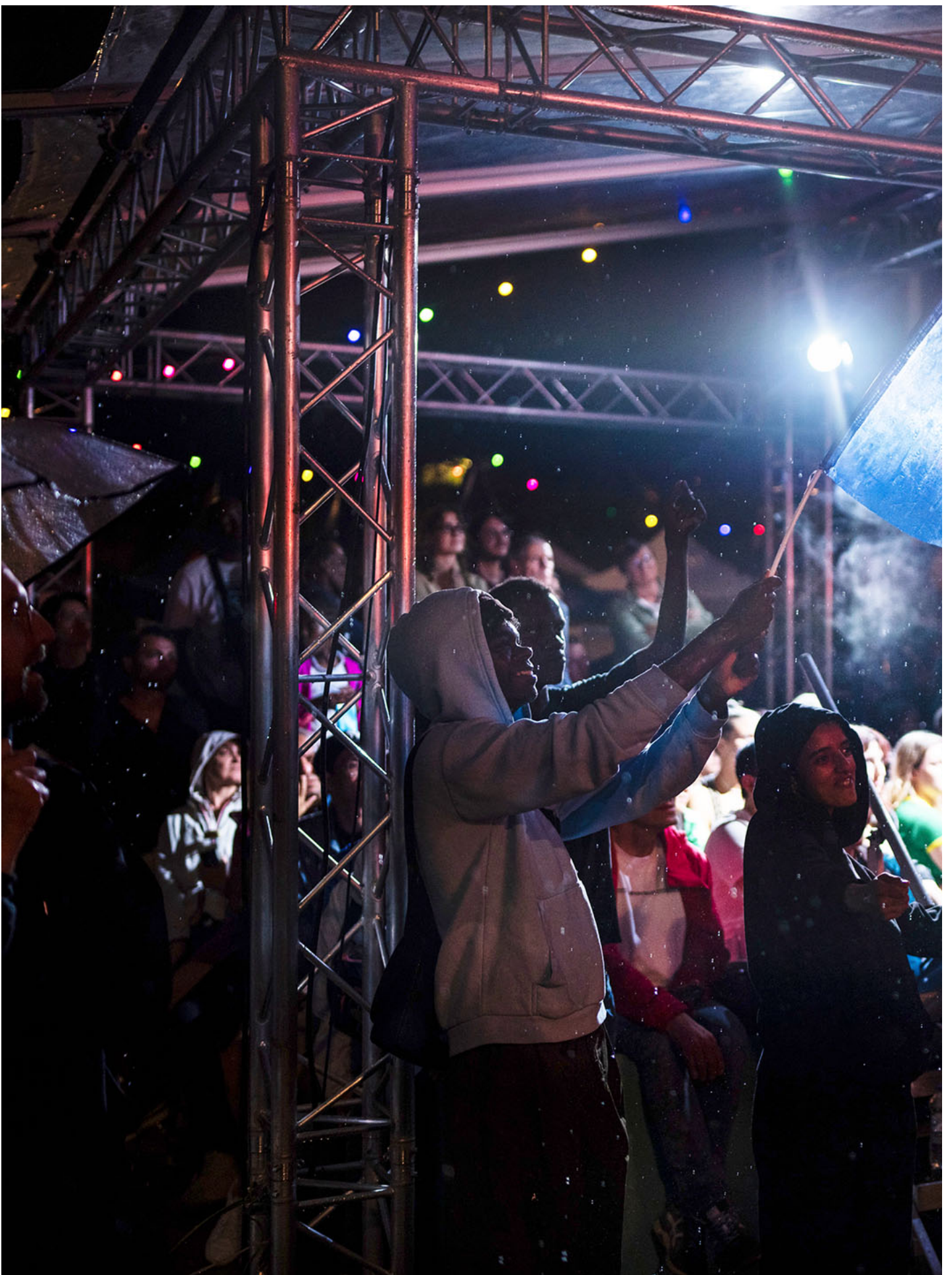
2024年7月26日，法国巴黎，公众在奥运会球迷区观看萤幕上投影的开幕式。

这加剧了对于“女性定义”的“精确性”的要求。被指派为女性的人，要经过一层又一层身体的审查，从外生殖器官-染色体-激素水平，最后无论拥有多么精确的判断标准，话语模式总是又回到身体表现规范上，对于性别的视觉上的刻板印象就像是世界上最大的一头隐形大象：“要看起来像个女性”。