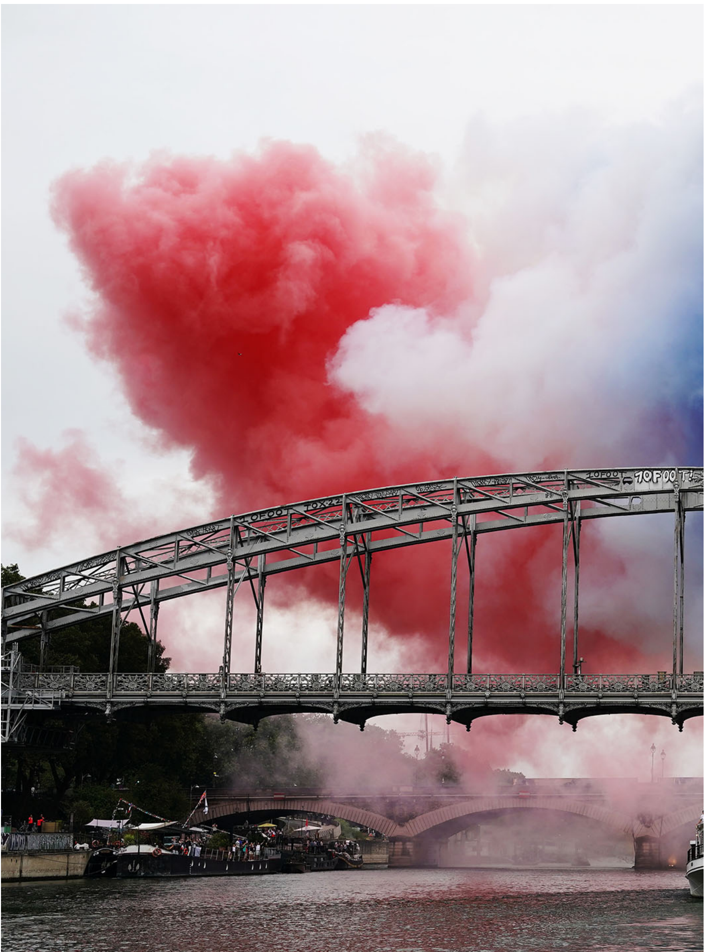
2024年7月26日，法国巴黎，桥上冒出法国国旗颜色的烟雾。

这项新的政策承认不同运动项目对体力、耐力等要求各不相同，因此决定权下放到各单项体育联合会，让它们根据各自项目的特点制定适合的政策。这意味着对女性性别的定义在不断扩展，偏离了传统的霸权规范，女性性别的定义也变得更加丰富。同时，性别多样性的增加也在提高公众对性别理解的意识。