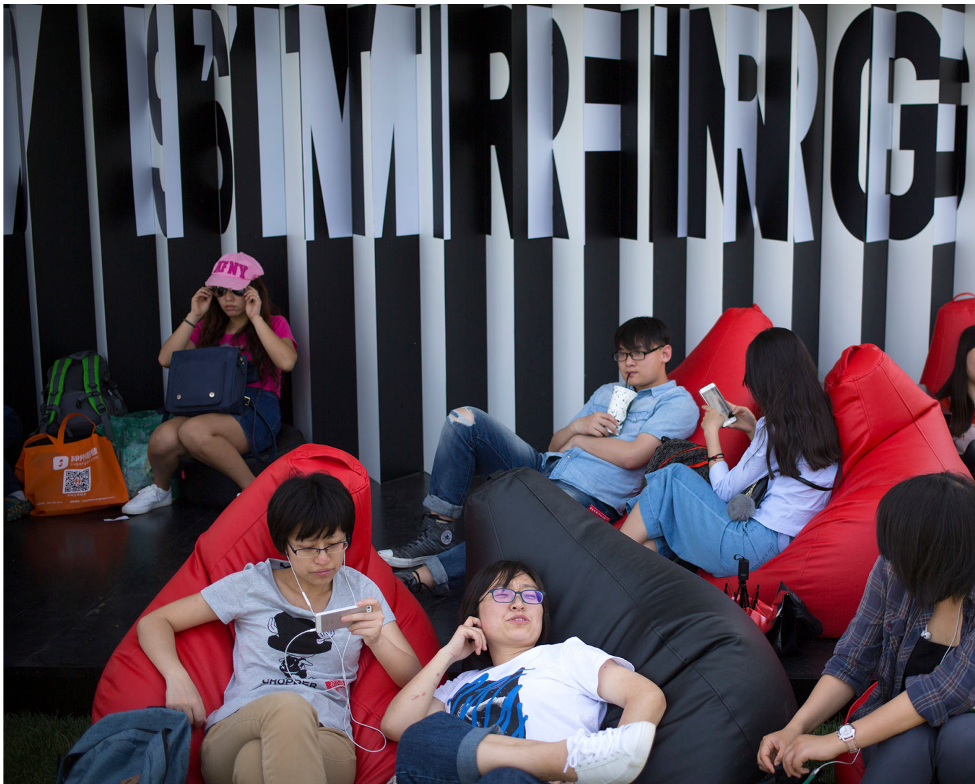
2017年4月29日，中国北京，全球移动互联网大会（GMIC），参观者在沙发上看手机。

7月26日，中国公安部、国家互联网信息办公室（下称“网信办”）起草的《 国家网络身份认证公共服务管理办法 》（下称“《办法》”）公开征求意见。