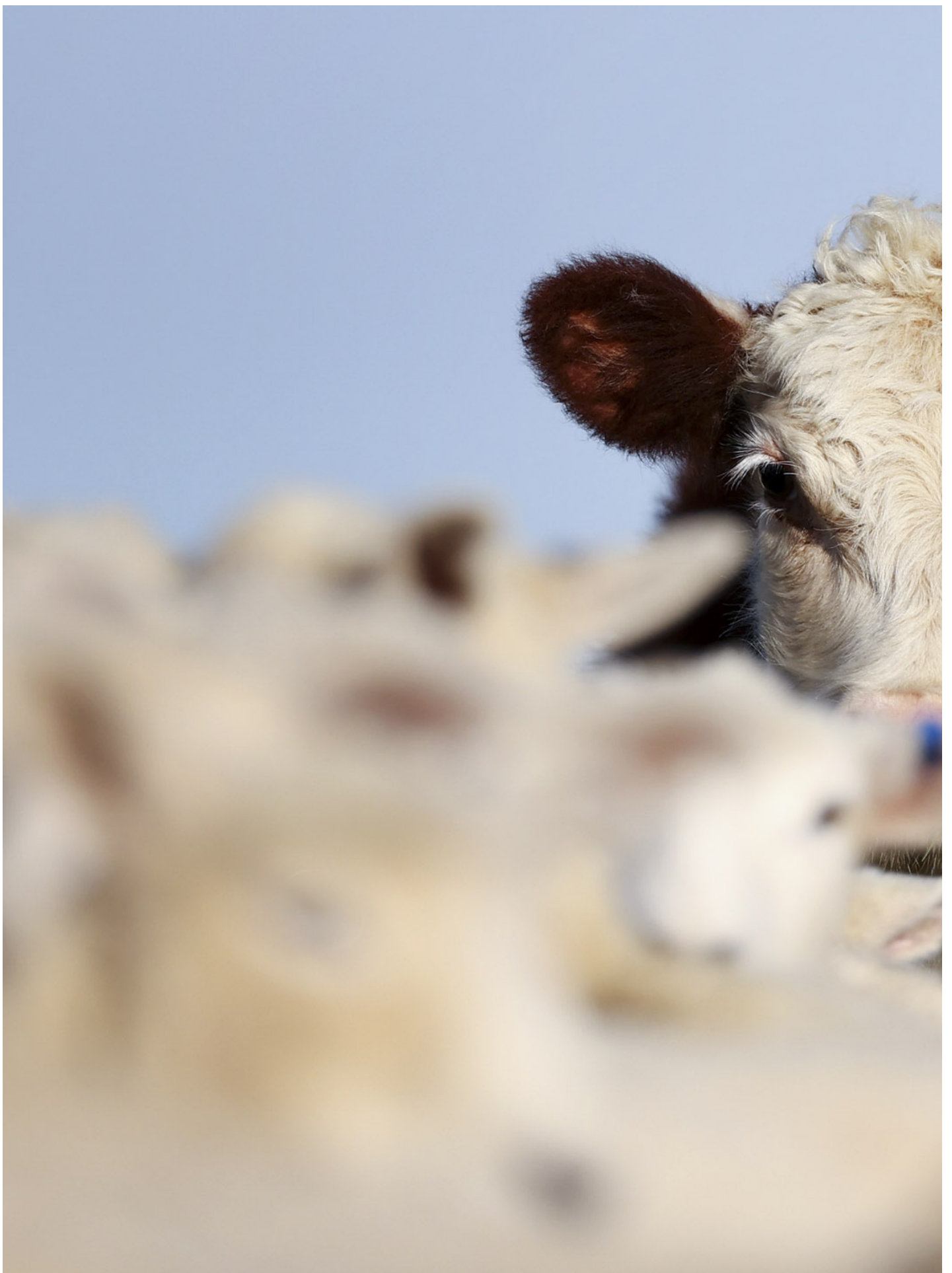
2022年6月14日，新西兰奥克兰的一个农场，羊群中有一只小牛。