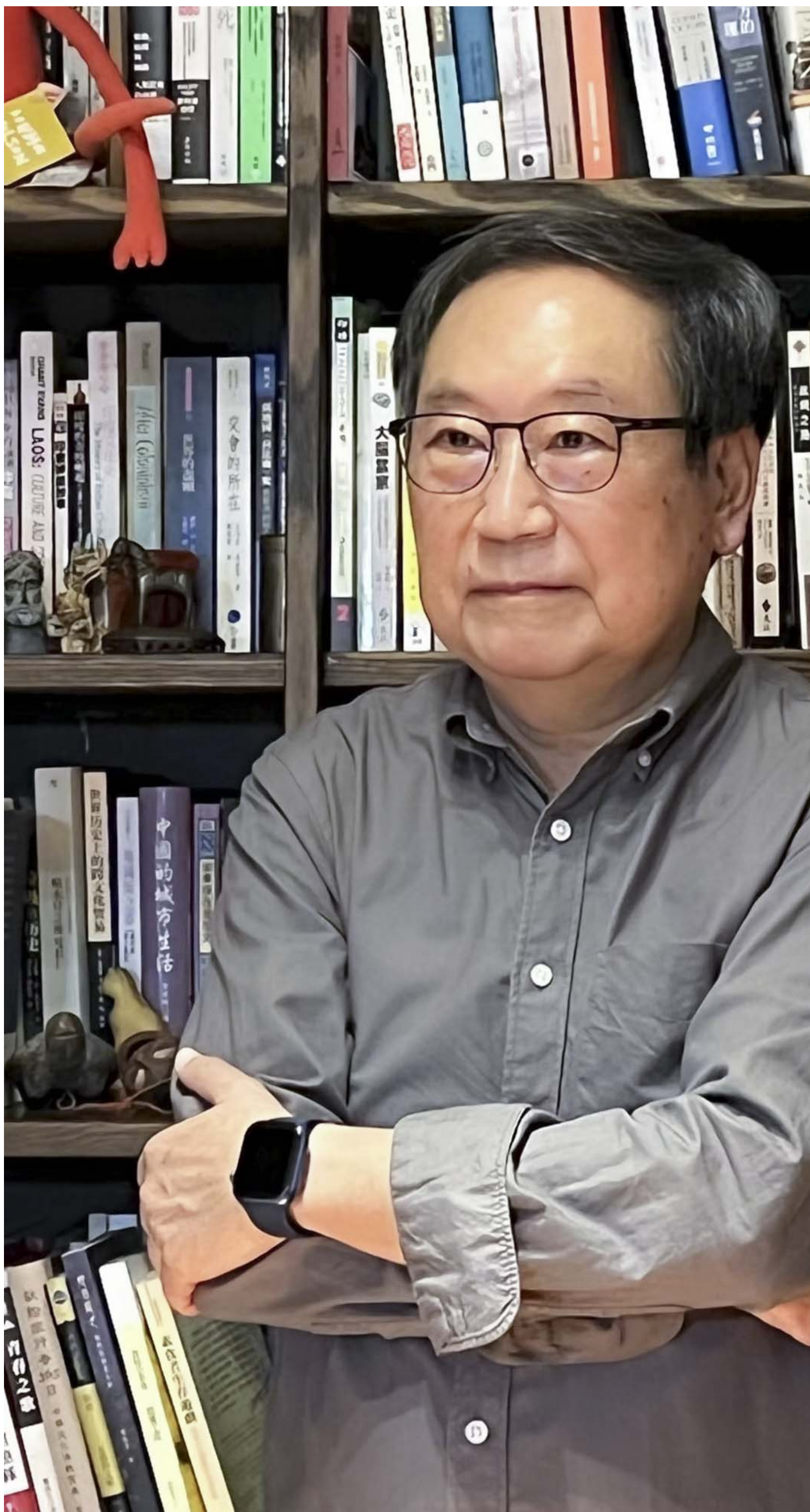
学者钱永祥。