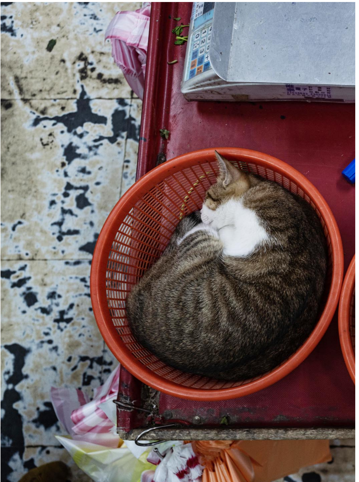
2023年5月10日，台北，店舖內睡著两只猫。