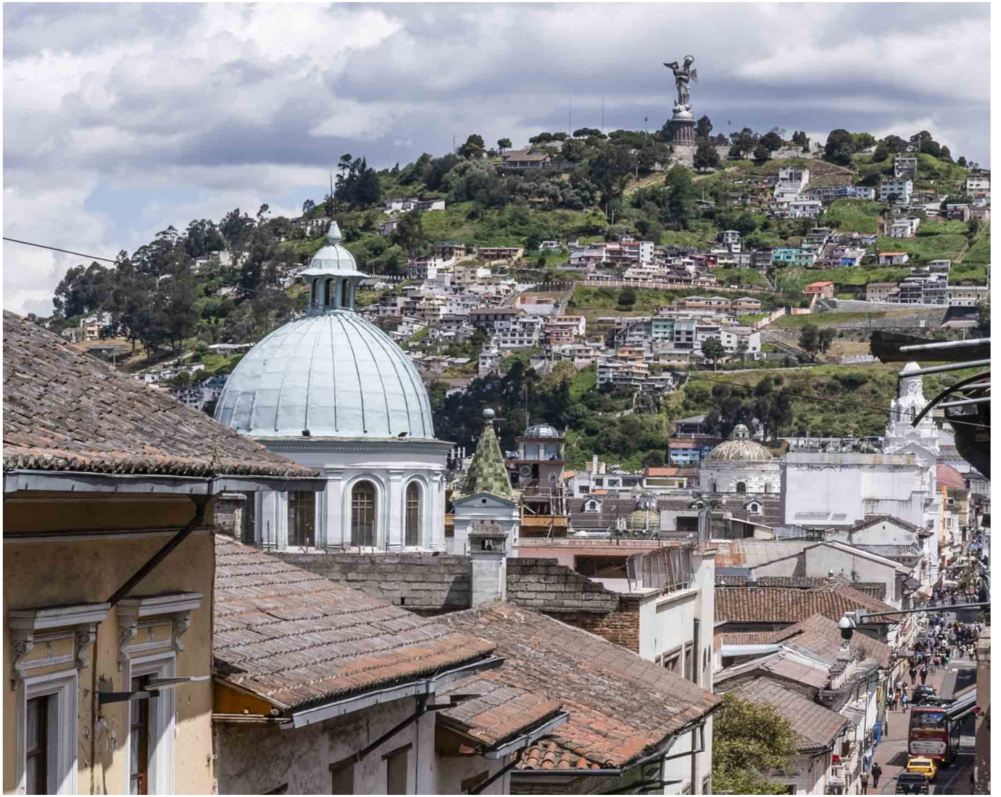
厄瓜多爾基多的「麵包山」（El Panecillo），在山上可以俯瞰城市全景。

「我們那裏的人『走線』都多少年了，都是悄悄走。你們倒好，偷渡就偷渡，幹嘛要一直在抖音上發。」