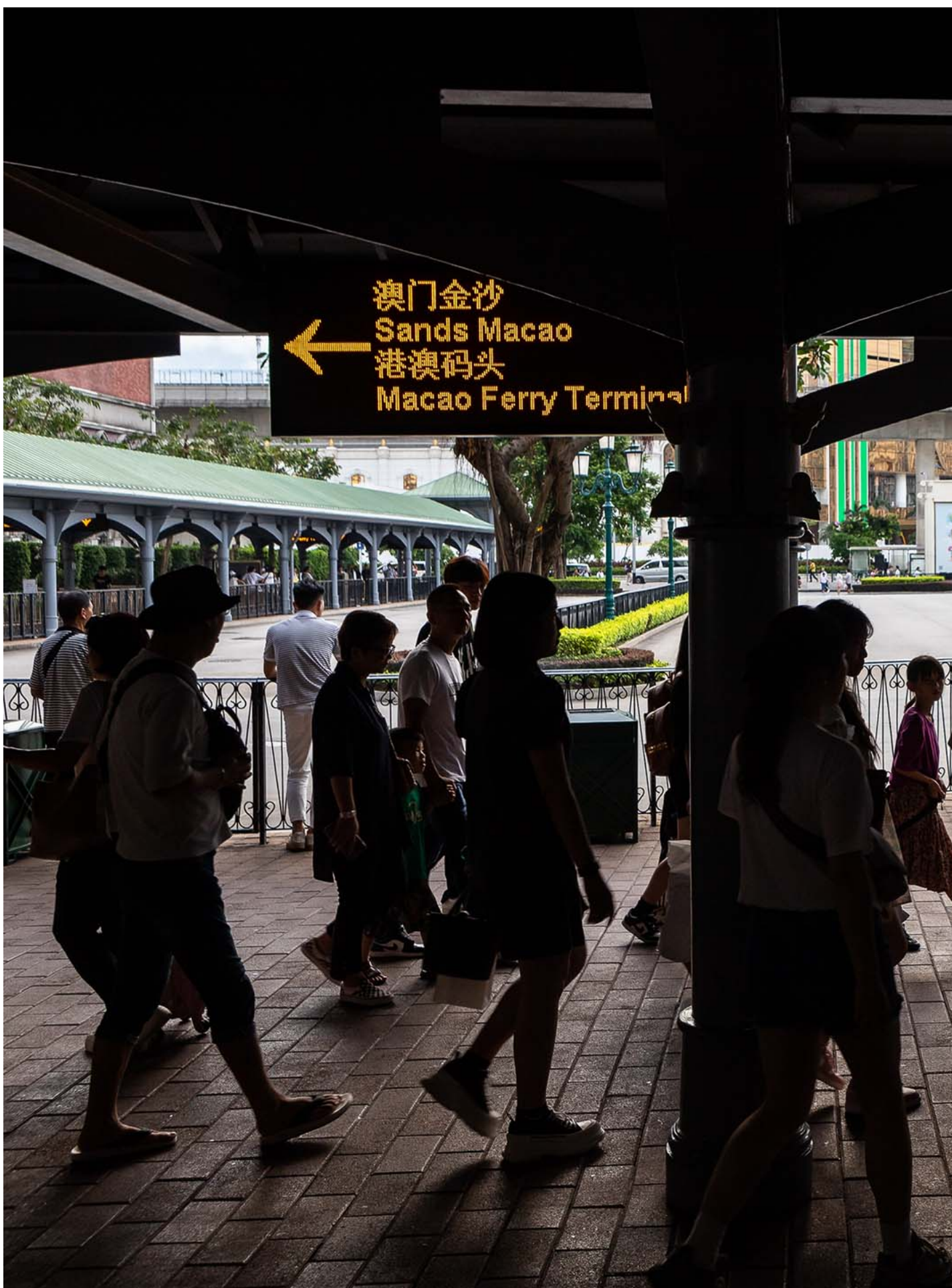
2023年8月24日，澳門，人們在賭場度假村的巴士總站前經過。

我認真問母親，多少錢的工才算有前途。她說，「最少四五萬。」我覺得她想太多。如果是為了錢的話，我一開始就不會挑這工作了。她剛把衣服晾好，站了起來，我鼓起勇氣問，「其實你能不能理解，為什麼我想當記者？」我還想掙扎呀。