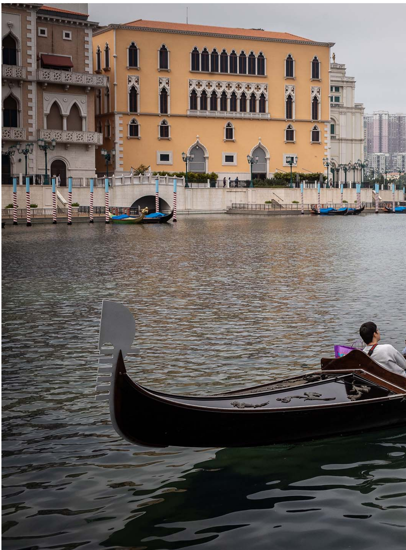
2023年1月25日，澳門，人們在酒店度假村內乘坐木船觀看風景。

吃完飯後，在回家路上我急着跟男友解釋說，事情我媽只說了一半，原形是這樣子的：那時我剛結束一段戀情，心受重創。人又剛搬進新的房子，租金好貴，錢又沒了。而當然說着說着眼就紅了。但我不知道母親就在旁邊，不然才不會表現得如此狼狽。