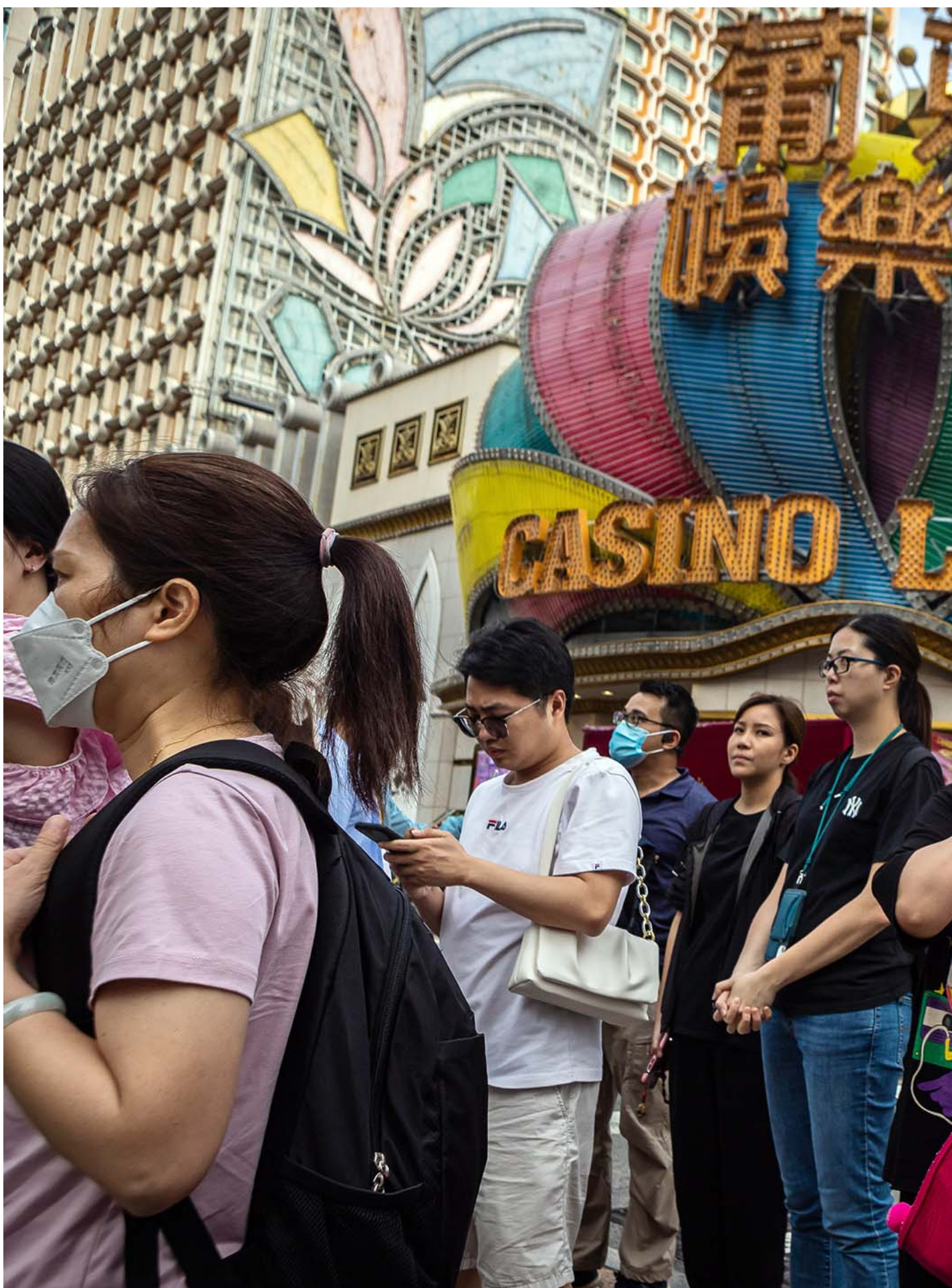
2023年4月30日，澳門，行人在賭場前等待過馬路。

給她提醒的，還有自己的哥哥。阿壯說，哥哥年輕時在廣告公司上班，也超不看不起公務員，覺得一點挑戰性都沒有。在疫情前兩個月，他還很帥氣地裸辭，但沒想到發生疫情，完全找不到工作，積蓄就像水一樣流走，「他很要面子的，也只好回原公司工作。」