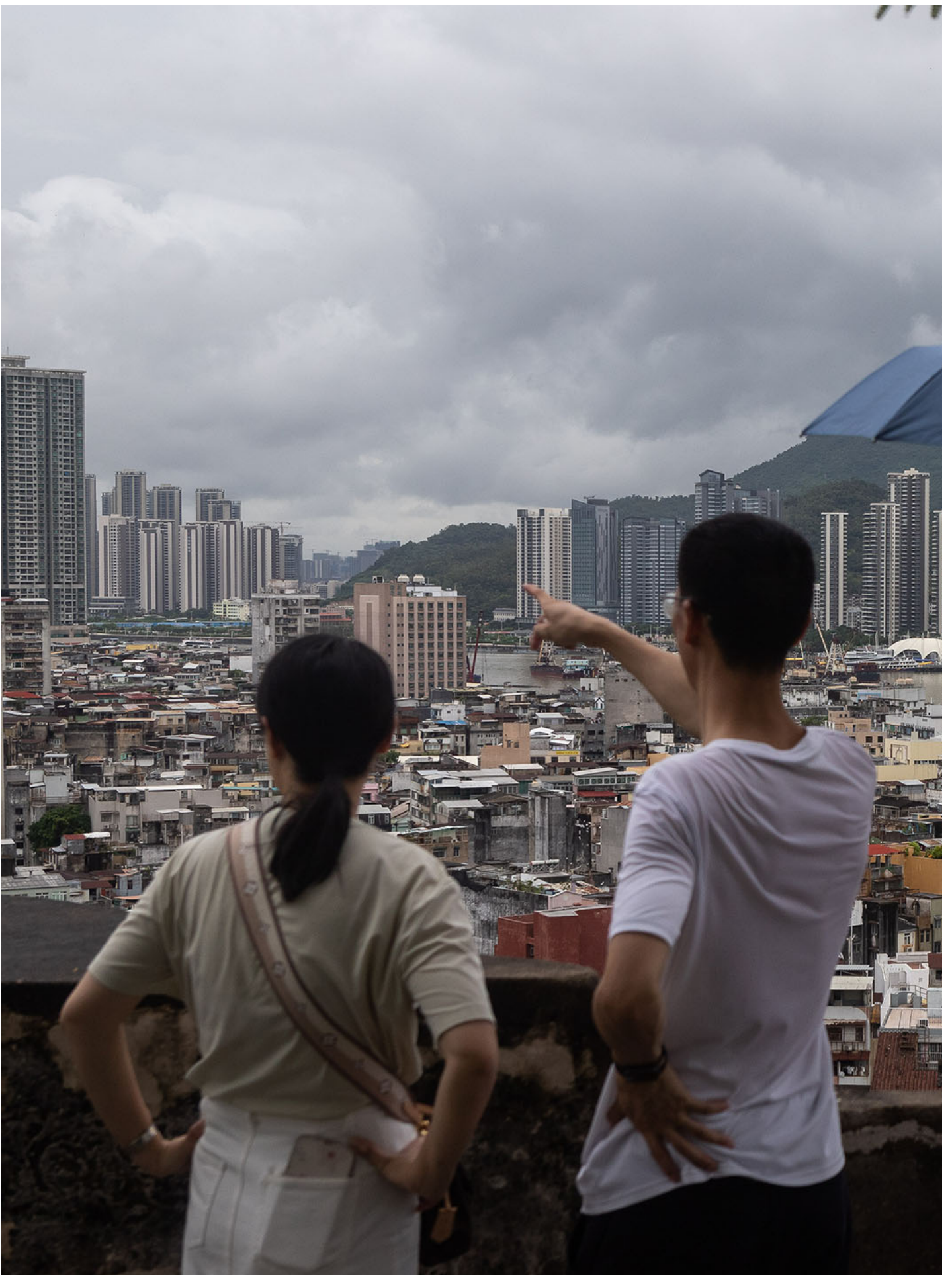
2023年8月24日，澳門，人們在大砲台上觀看風景。