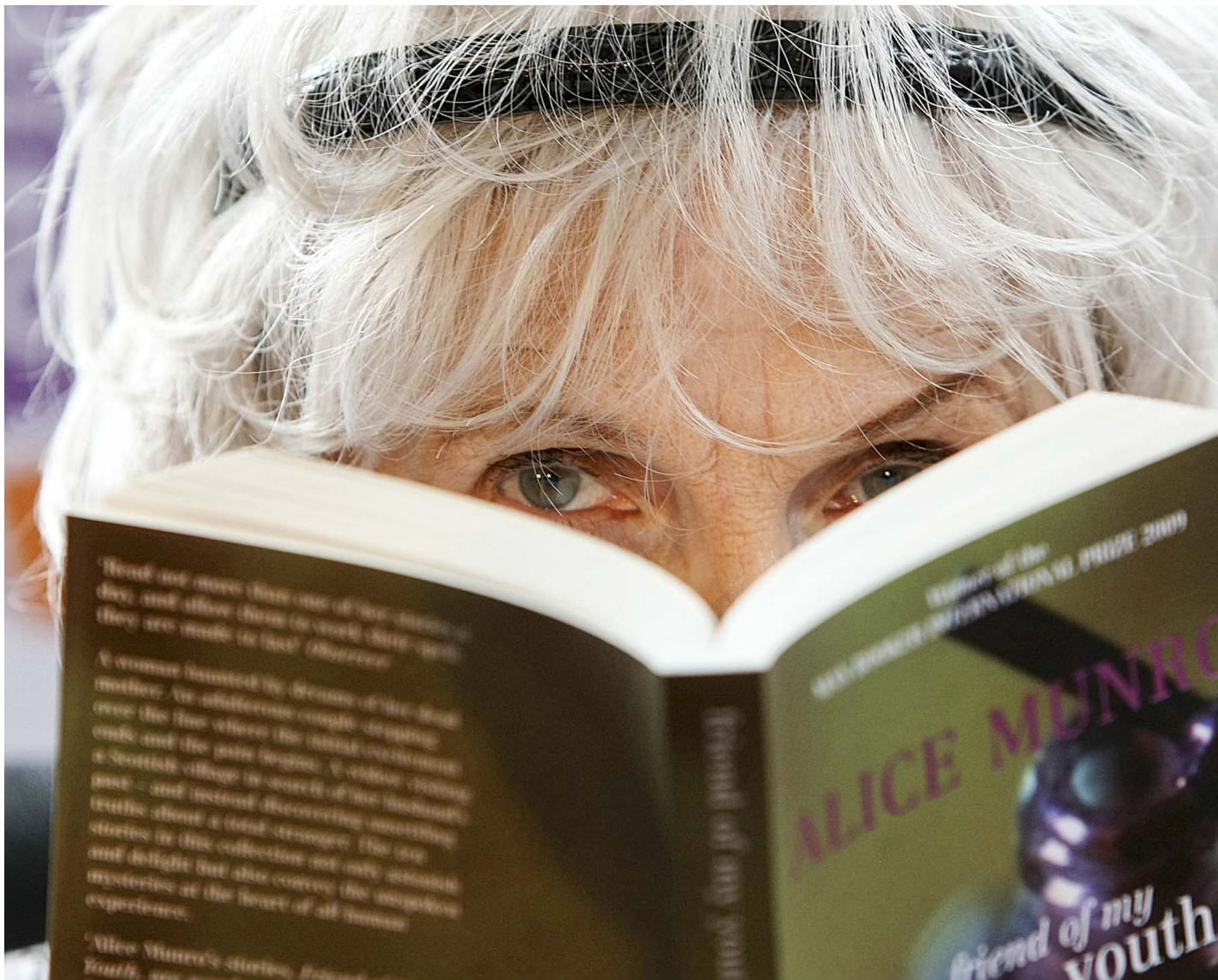
加拿大著名小说家、2013年诺贝尔文学奖得主艾莉丝·孟若 (Alice Ann Munro)。

端闻 podcast 的报导和制作都依赖端传媒会员的订阅付费支持。如果你喜欢我们的播客报导，请成为端传媒会员，支持我们持续产出，也让更多人透过音频获取深度报导和多元观点。