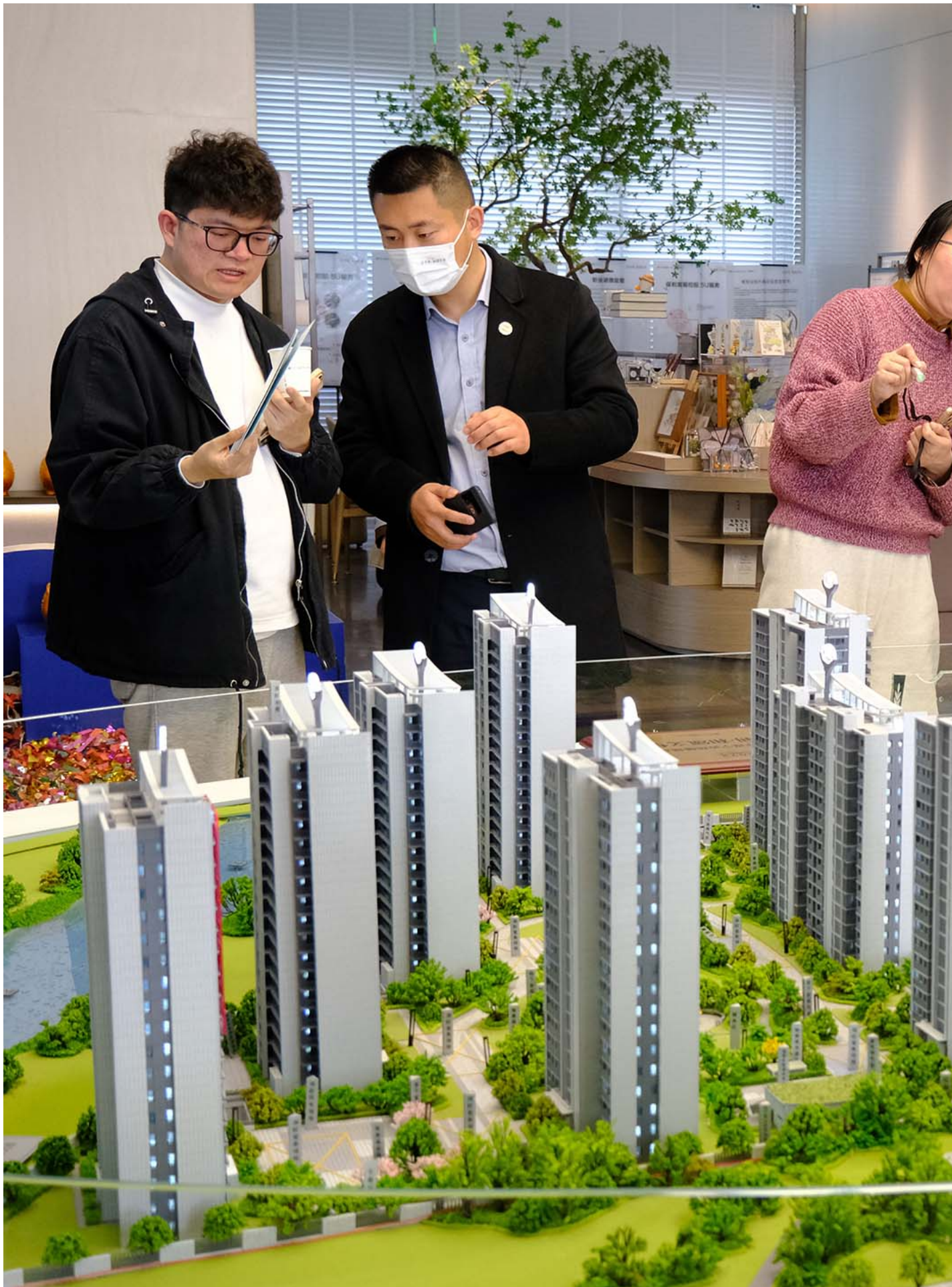
2023年3月4日，中國浙江省寧波市，人們在銷售處觀看住宅建築模型。

這次三中全會確認和延續了已經部署的政策，其結論明確表示房地產的方向是「租購並舉，既消化存量亦優化增量，將賦予各城市政府房地產市場調控自主權，因城施策，允許有關城市取消或調減住房限購政策，同時加大保障性住房建設和供給，滿足工薪群體剛性住房需求。」