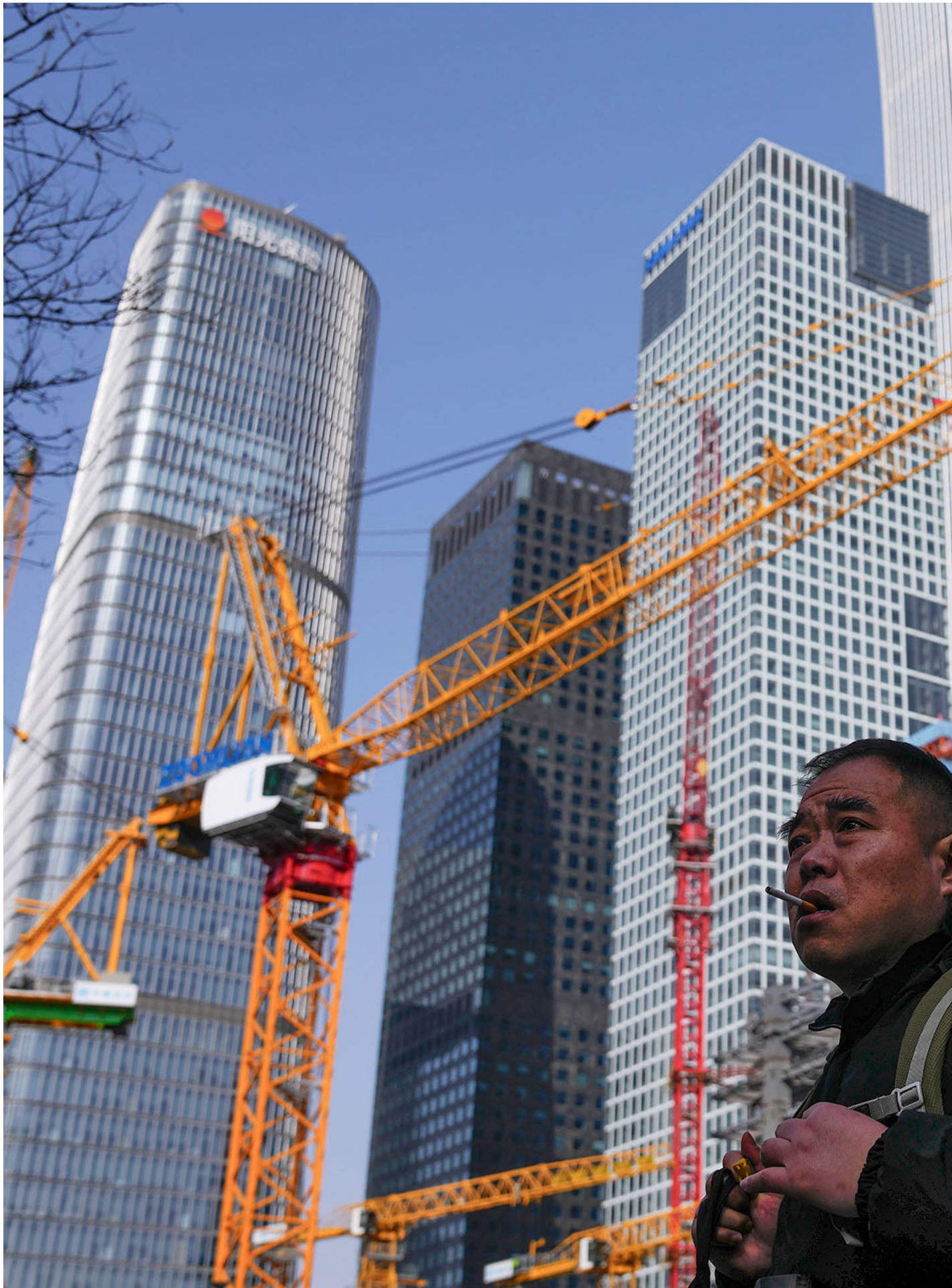
2024年3月2日，中國北京，一名男子經過中央商務區附近的建築工地。

在這種情況下，中國地方政府開始尋找自己的經濟來源，它們一邊大推「土地財政」，依賴土地出讓金的收入，一邊通過各種顯性和隱形債務增加收入，推動GDP增長。然而，這種模式近年受到嚴重挑戰，先是疫情影響地方政府收支，然後是2021年的房地產市場 陷入嚴重低迷 ，使土地出讓金從2021年的8.7萬億港元，下跌至2023年的5.8萬億元，嚴重影響地方政府的財政，何況地方政府本來已積累龐大的債務。