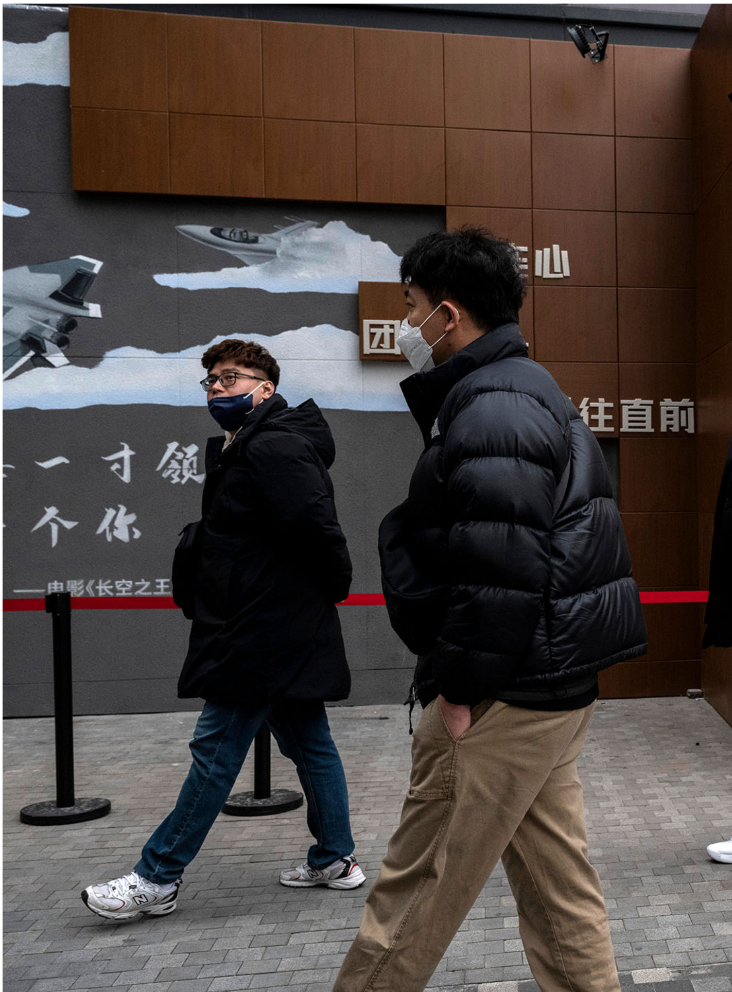
2023年11月15日，中國北京，人們在購物區經過。

由此也可以猜測，中國政府也在評估開放給外資的領域。開放吸引外商投資的前提是外來投資是可控的，且對中國是有利。