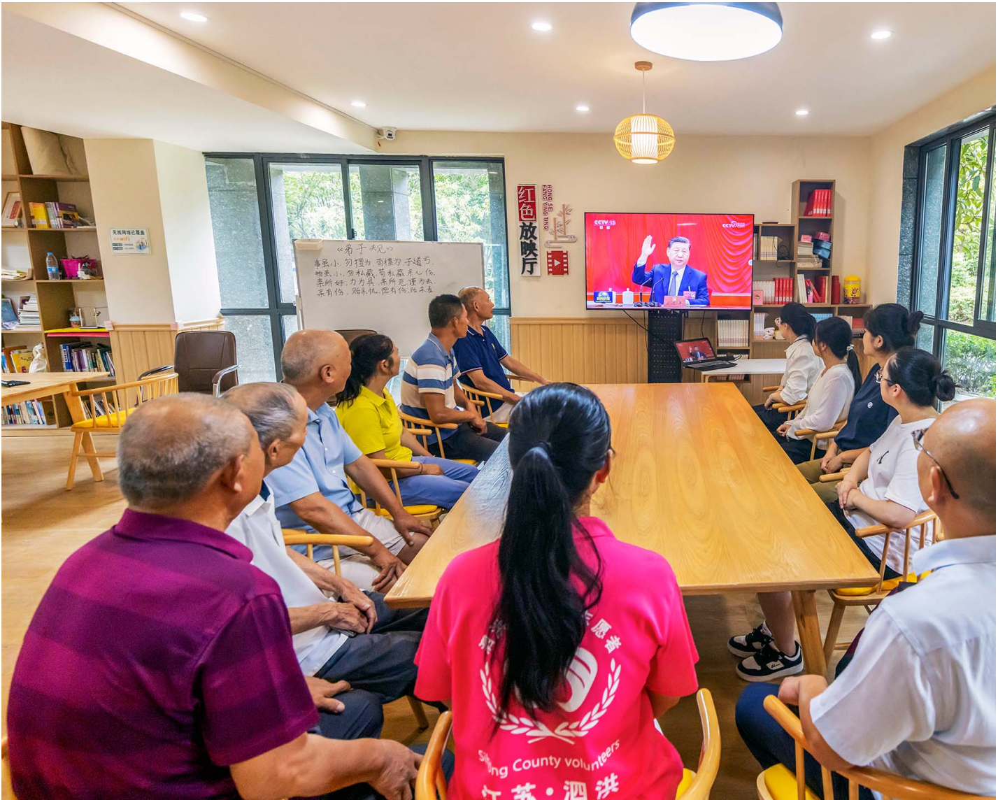
2024年7月19日，中國江蘇省宿遷市，人們正在觀看中共三中全會。

解讀三中全會的核心議題，我們將看到中國共產黨和國家機器的煩惱清單、代辦事項和心願列表。