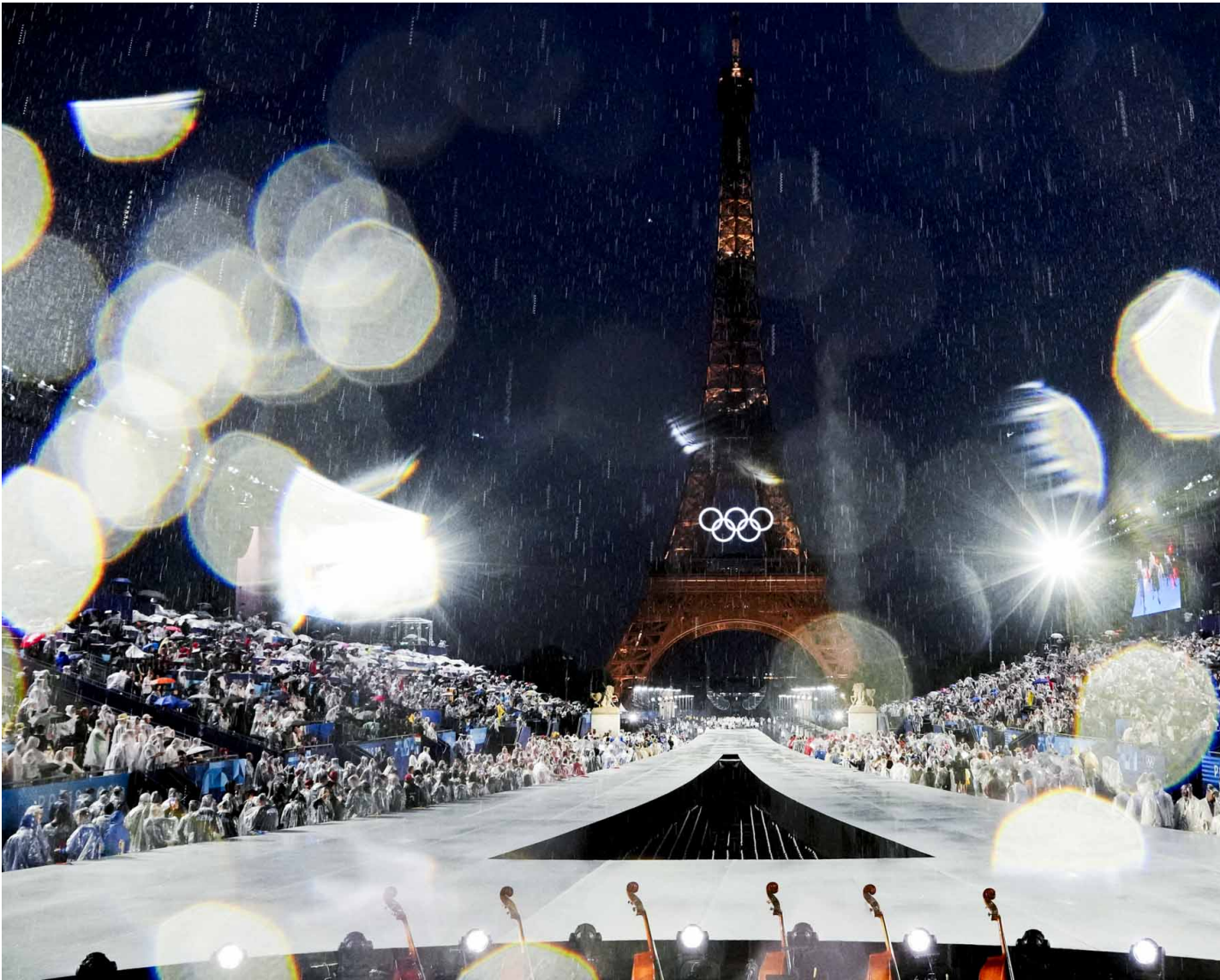
2024年7月26日，巴黎睽違100年再次舉辦奧運，開幕典禮的晚上在雨中舉行。

巴黎奧運開幕禮藝術指 Thomas Jolly 指慶典是要歌頌法國和全球各地在文化、語言、宗教和性傾向方面的多元融合。