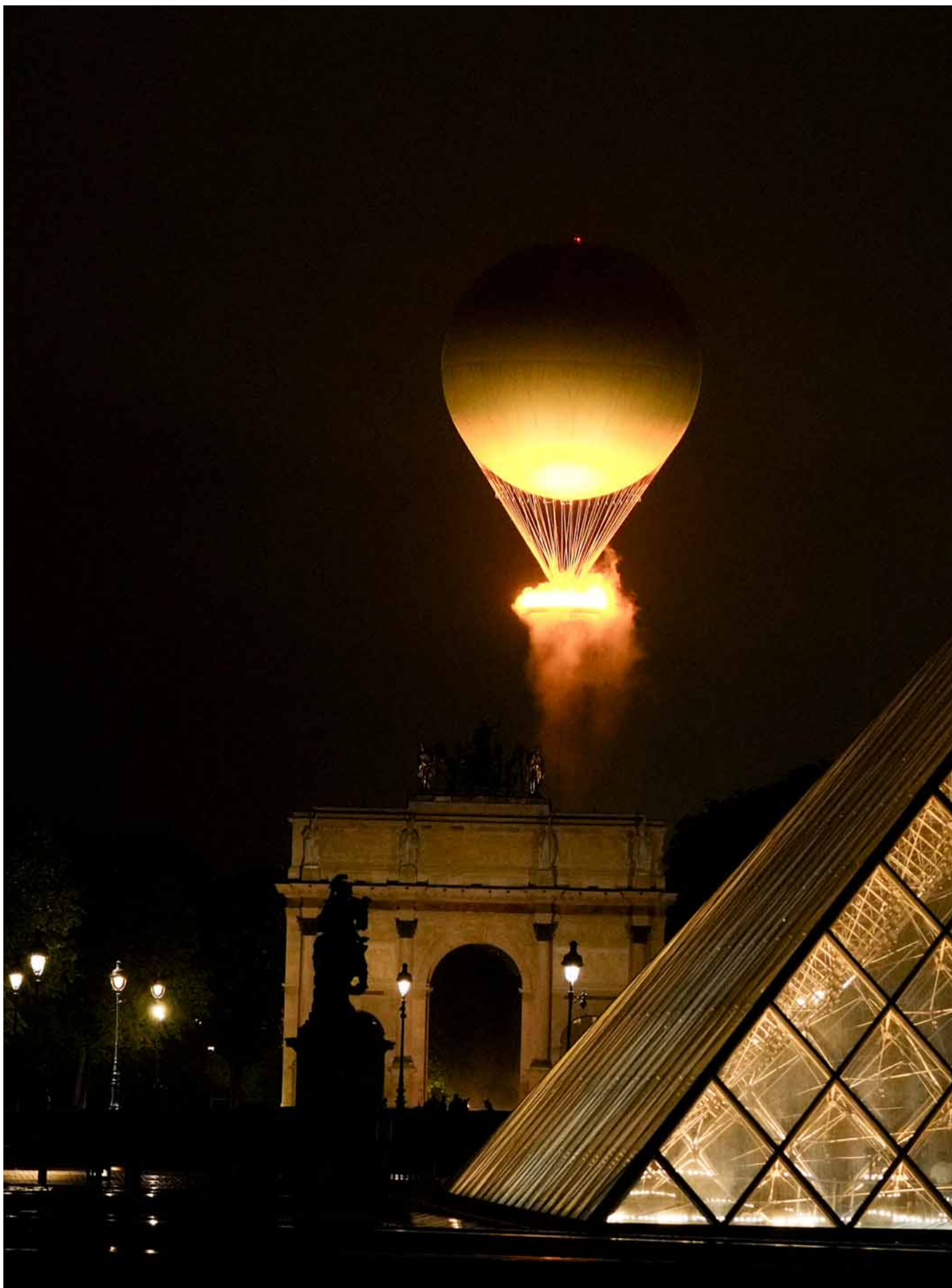
2024年7月26日，巴黎奧運將火炬台以熱氣球型式懸浮於巴黎上空。