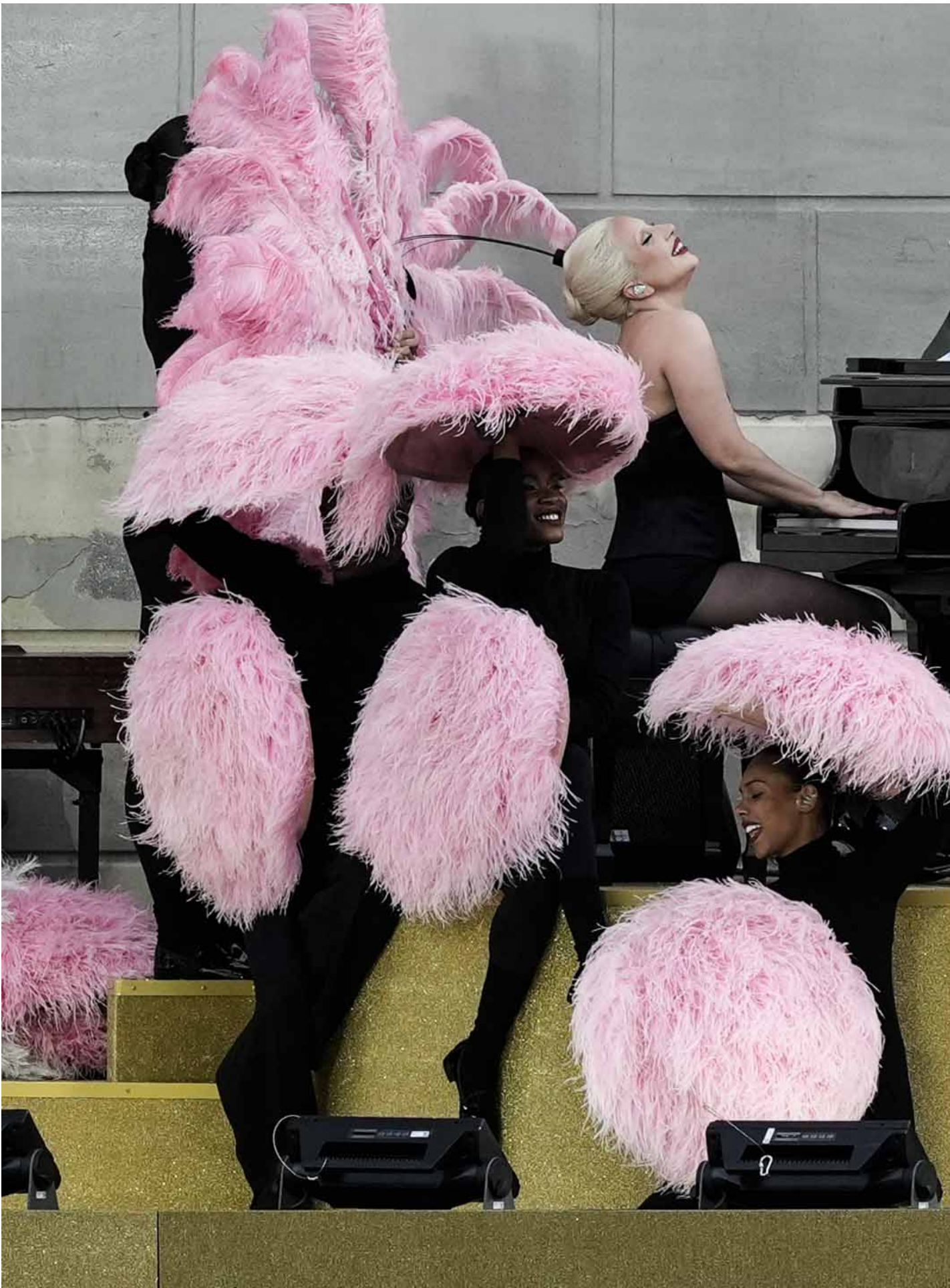
2024年7月26日，Lady Gaga 在巴黎奧運開幕典禮上表演。