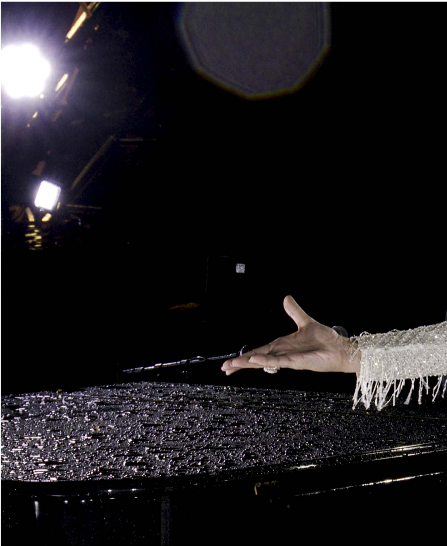
2024年7月26日，罹患僵硬人症候群的樂壇天后Celine Dion 在巴黎奧運開幕典禮作壓軸演出，獻唱《愛的讚歌》（Hymne A L'Amour）。