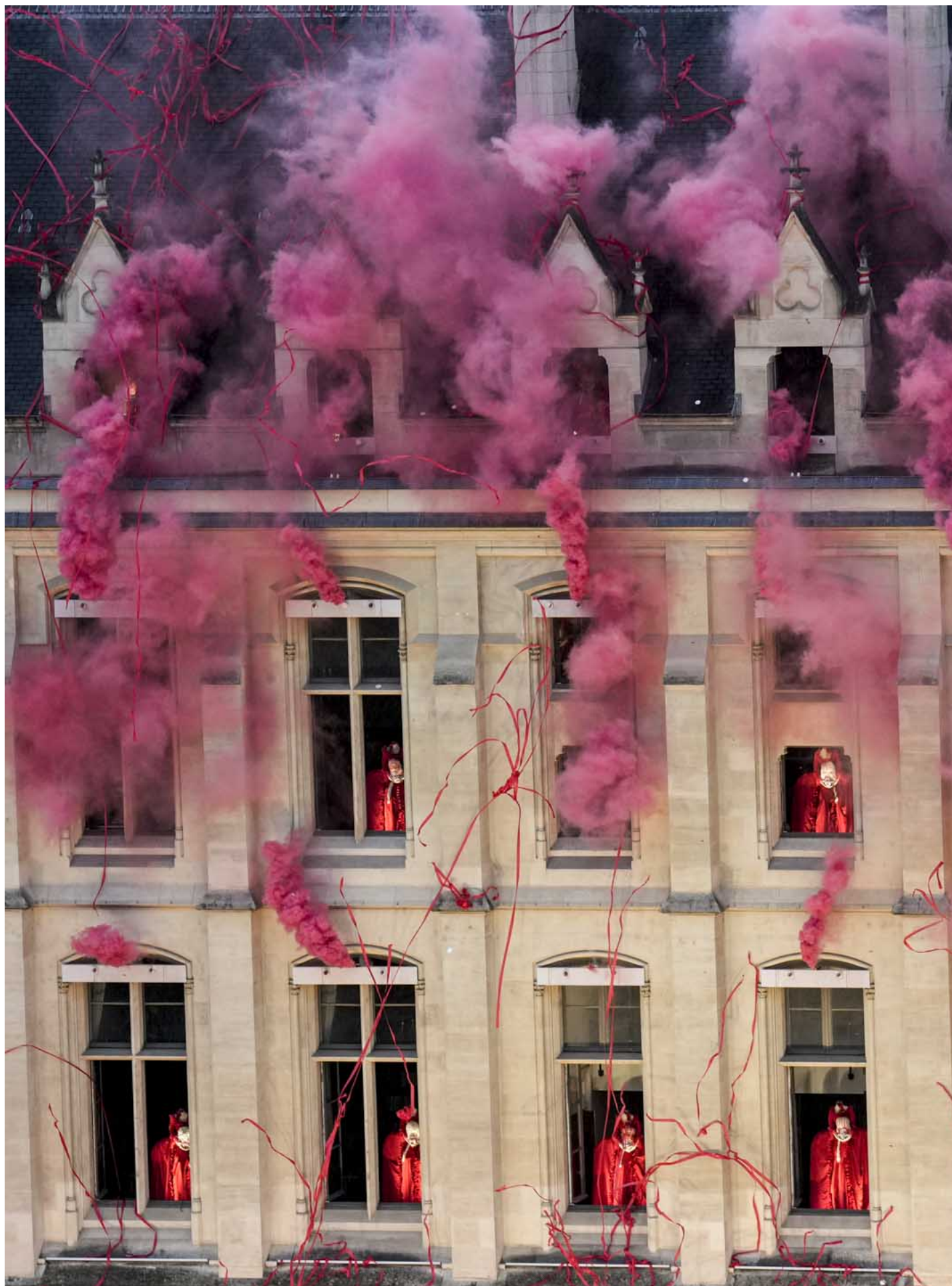
2024年7月26日，法國重金屬樂隊Gojira 在開幕禮上演唱法國大革命時期流行的歌曲Ah ! Ca Ira。