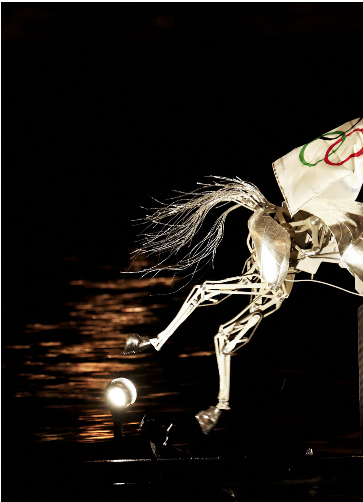
2024年7月26日，身著銀色盔甲、披上奧運會旗的女騎手穿梭過塞納河。