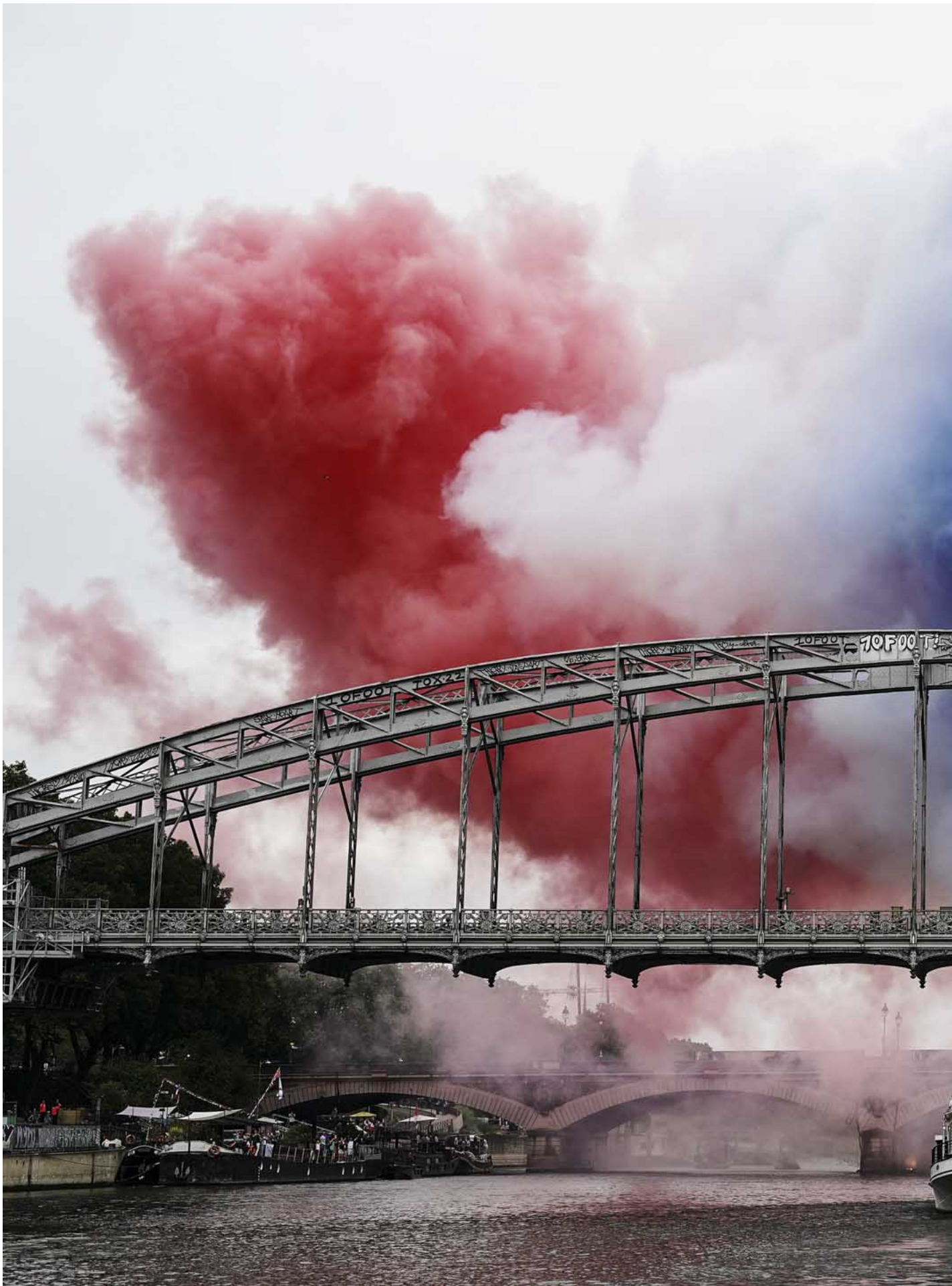
2024年7月26日，河上的橋噴出紅白藍法國國旗的顏色。