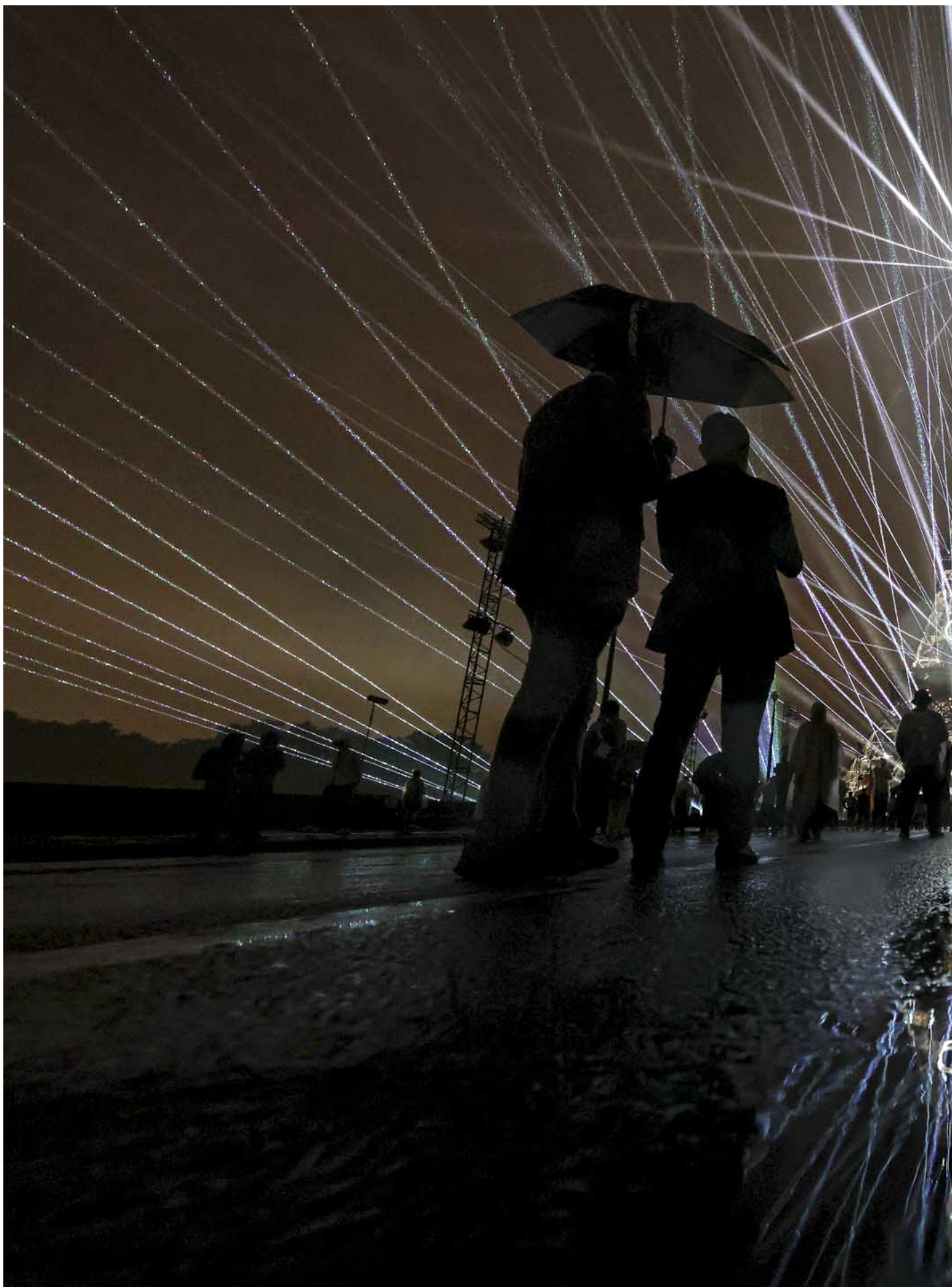
2024年7月26日，特羅卡德羅廣場舉行的 2024 年巴黎奧運會開幕式上，埃菲爾鐵塔上的奧林匹克五環被照亮。