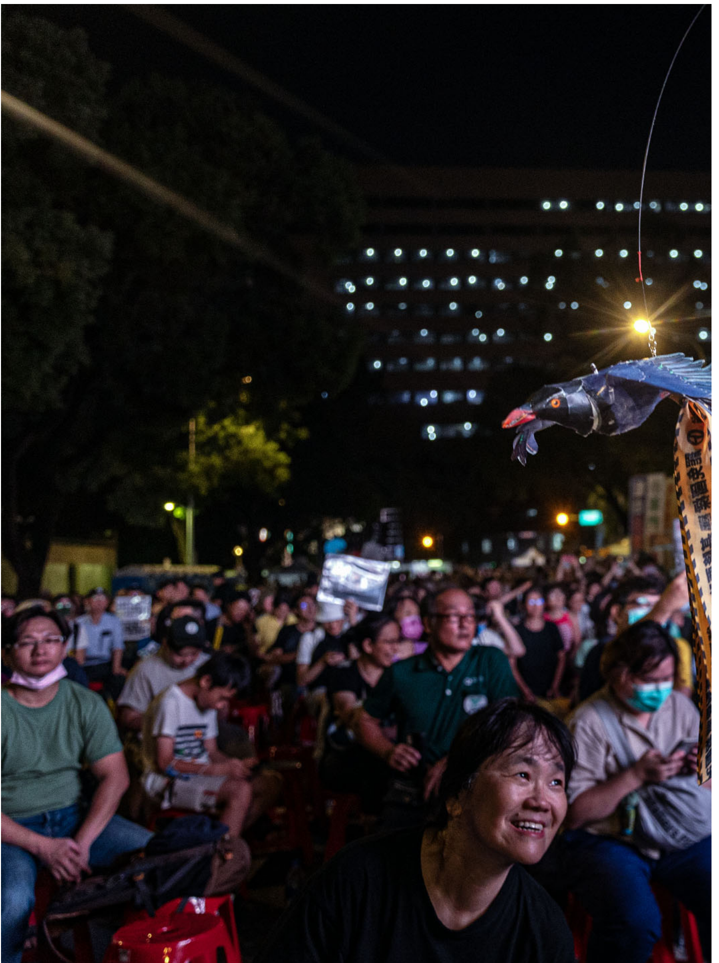
2024年6月21日，台北，公民团体发起“青鸟行动”，号召支持者到立法院外声援。