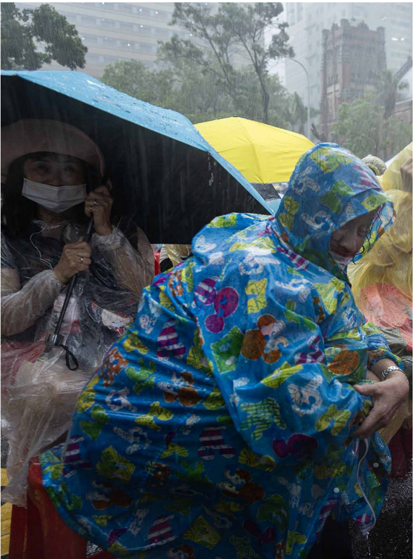
2024年6月21日，台北，公民团体发起“青鸟行动”，号召支持者到立法院外声援。