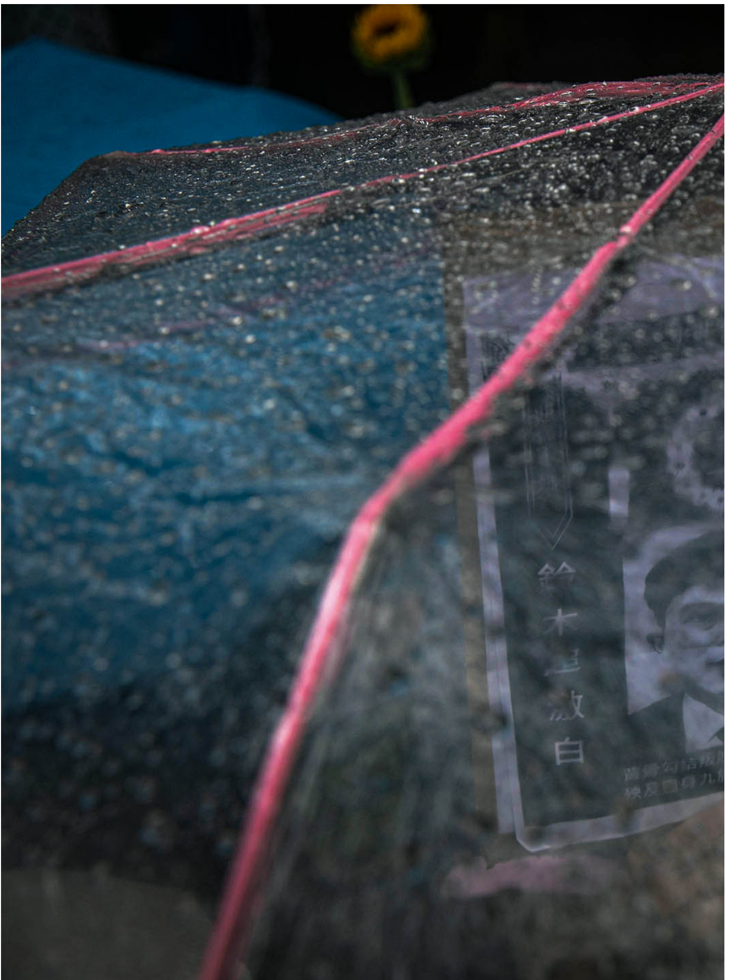
2024年5月21日，台北，立法院继续处理国会改革提案，场外上万民众集会抗议。