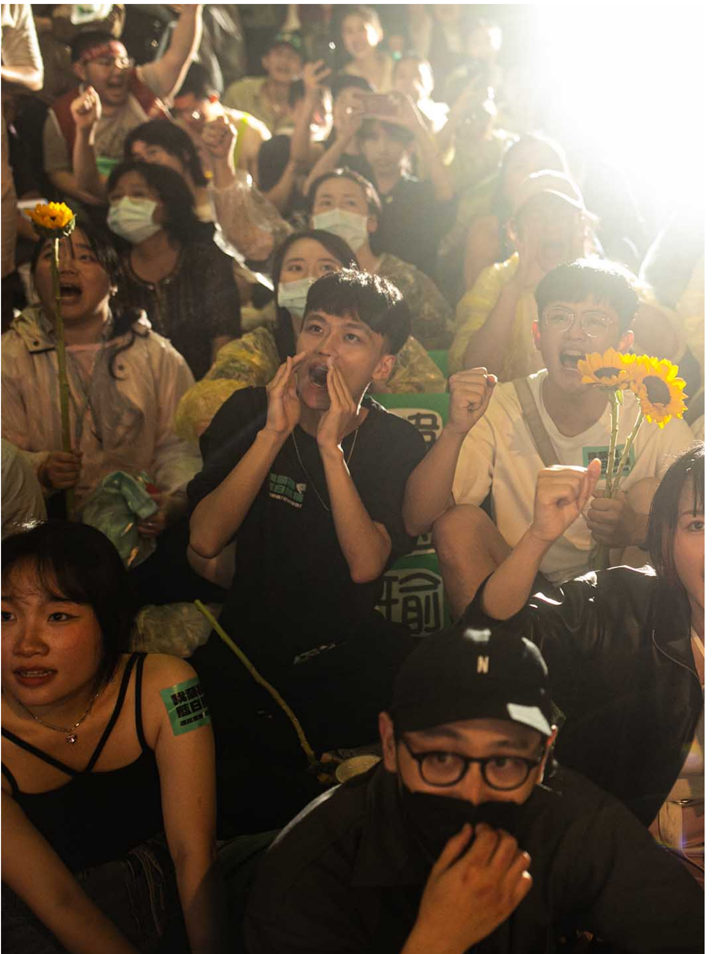
2024年5月21日，台北，立法院继续处理蓝白国会改革提案，场外上万民众聚集抗议。