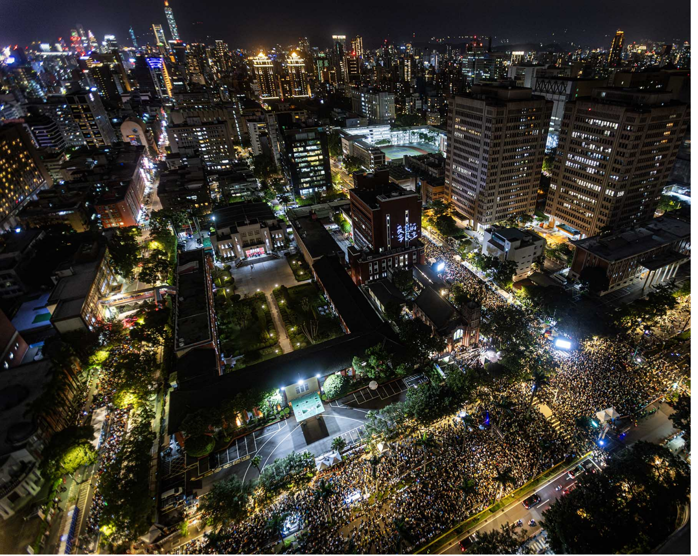
2024年5月28日，台北，立法院审议国会改革法案，立法院外有民众集会。

他说课金像是花钱让年轻人去郊游，但他觉得无所谓。过去的他在街头抗争因而认识了体制，现在的他希望年轻一代能看清体制的脆弱。