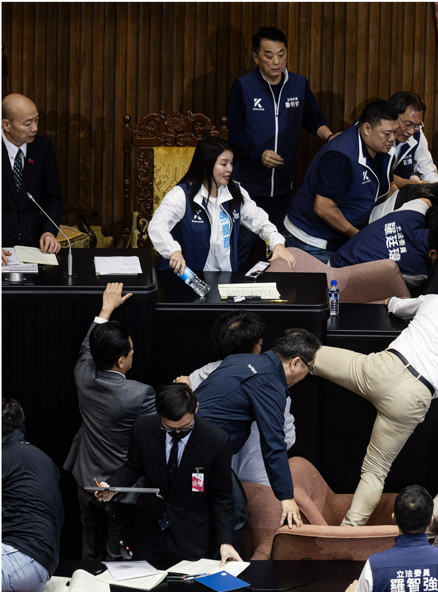
2024年5月17日，台北，国会改革法案在立法院力拼三读，国民党立委跟民进党立委于议场表决期间爆发冲突。

轮流举起麦克风宣讲。好几队手持盾牌的警力迅速集结，并在群众聚集的道路上摆上路障，不再让车辆通行。志斌在现场拍了照，上传社群媒体，他写下“干我都40岁了，还要被逼上街头喔”。他在青岛东路上绕了绕，没有停留太久，在人潮散场前他已先离开，沿著来时路上台北桥，回到桥的另一边。