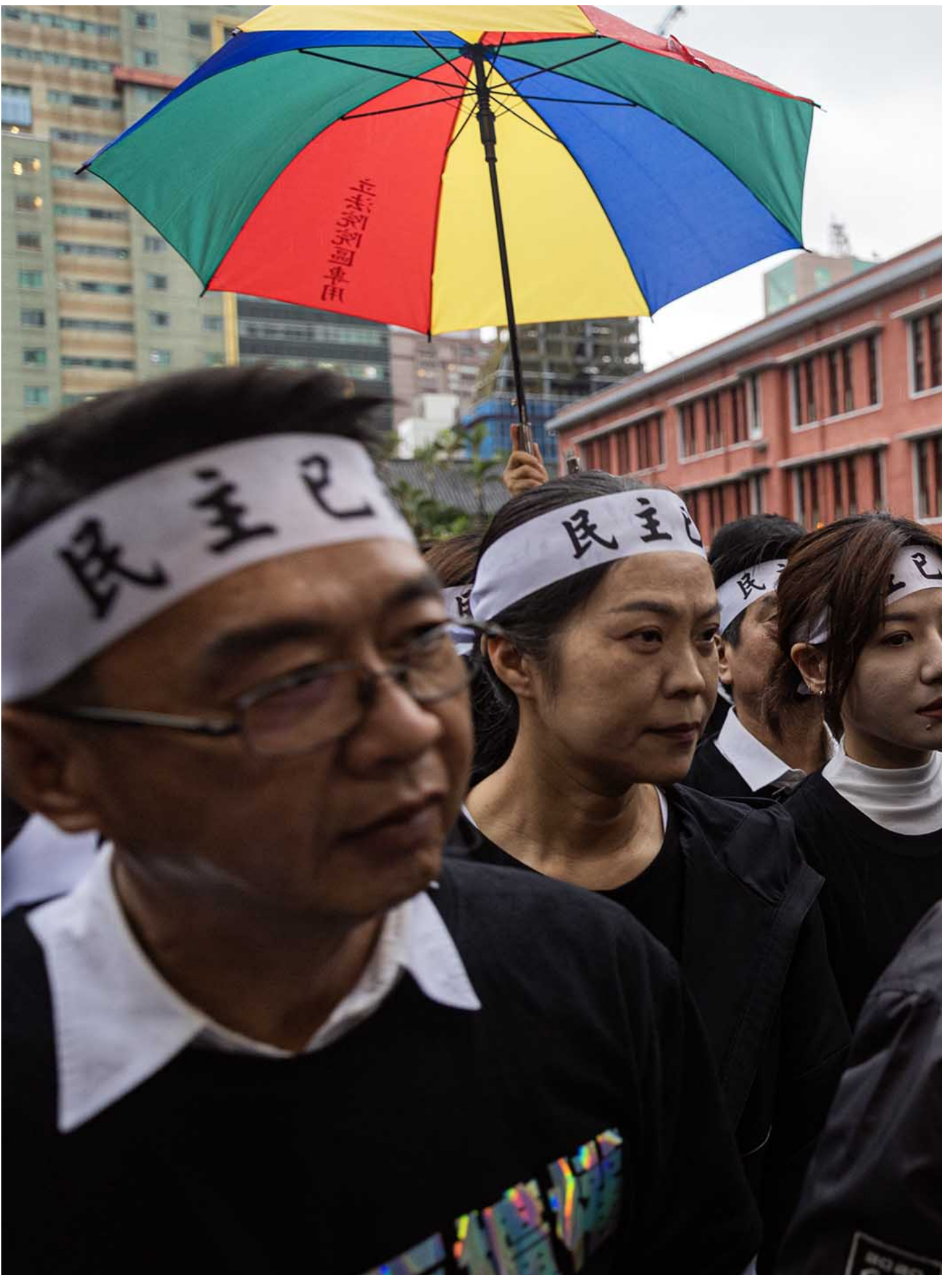
2024年5月28日，台北，立法院审议国会改革法案，民进党立委一起走入议场。