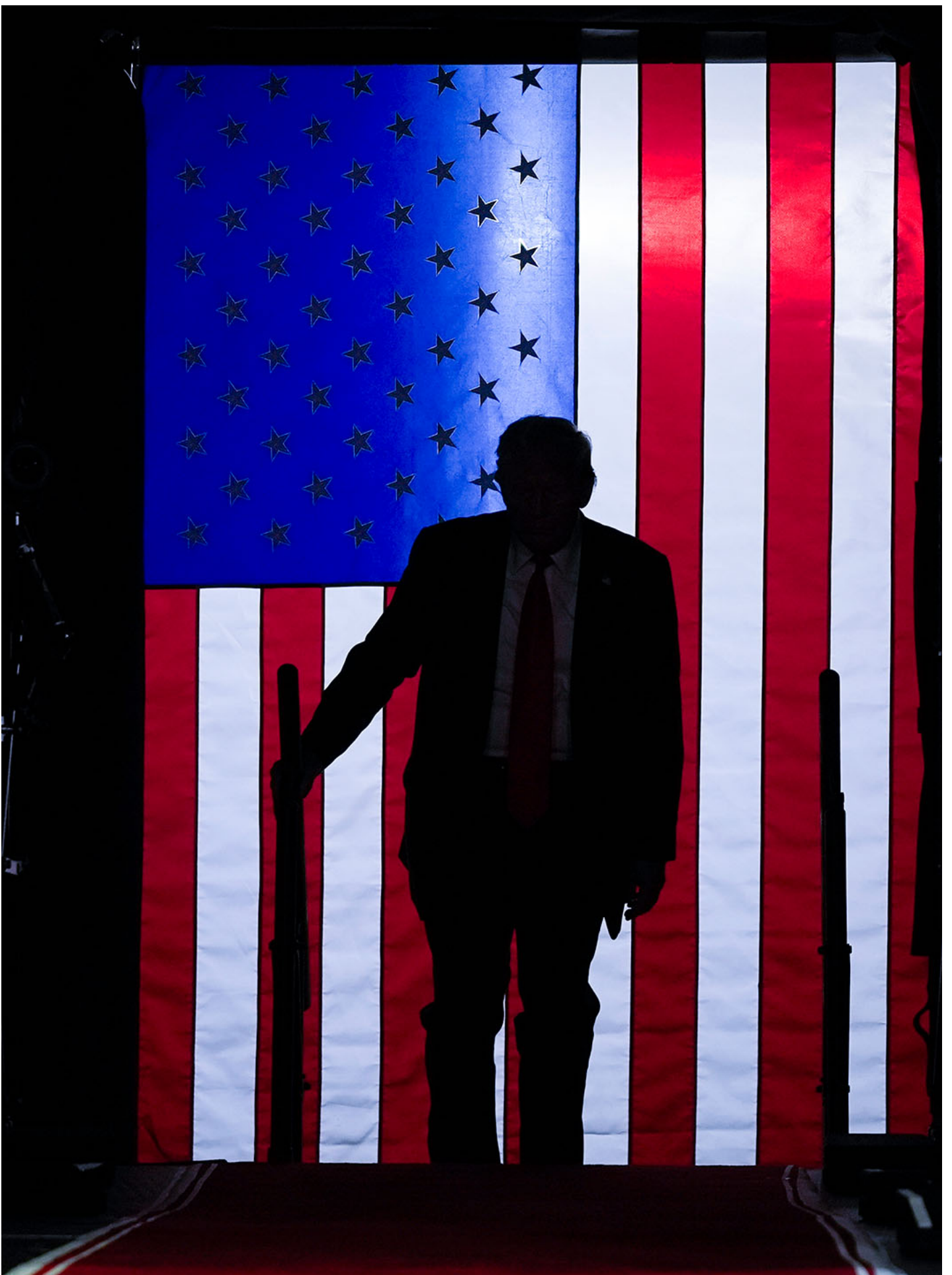
2024年7月30日，美国密西根州大急流城，共和党总统候选人、前美国总统川普参加竞选集会。

事实上，上一届特朗普当选之后，很多政策本来就并未按照选民的意愿走。特朗普原先其实有机会当“全民总统”，做很受欢迎的事：2015、16年选举时他使用某些人所谓经济民粹主义的语言，仿佛宣示要跟传统共和党走不一样的路，而选民多数也都支持他的主张，要对中产阶级减税、开办育婴假、增加基础设施建设投资。反而，人们并不是一味反移民：有三分之二反对强迫小孩和非法入境的父母分开（就连共和党选民也有43%反对，仅36%赞成），也有三分之二支持延续 DACA 政策，希望继续让从小被带入境、在美国受教育长大的年轻无证移民有机会取得公民权。