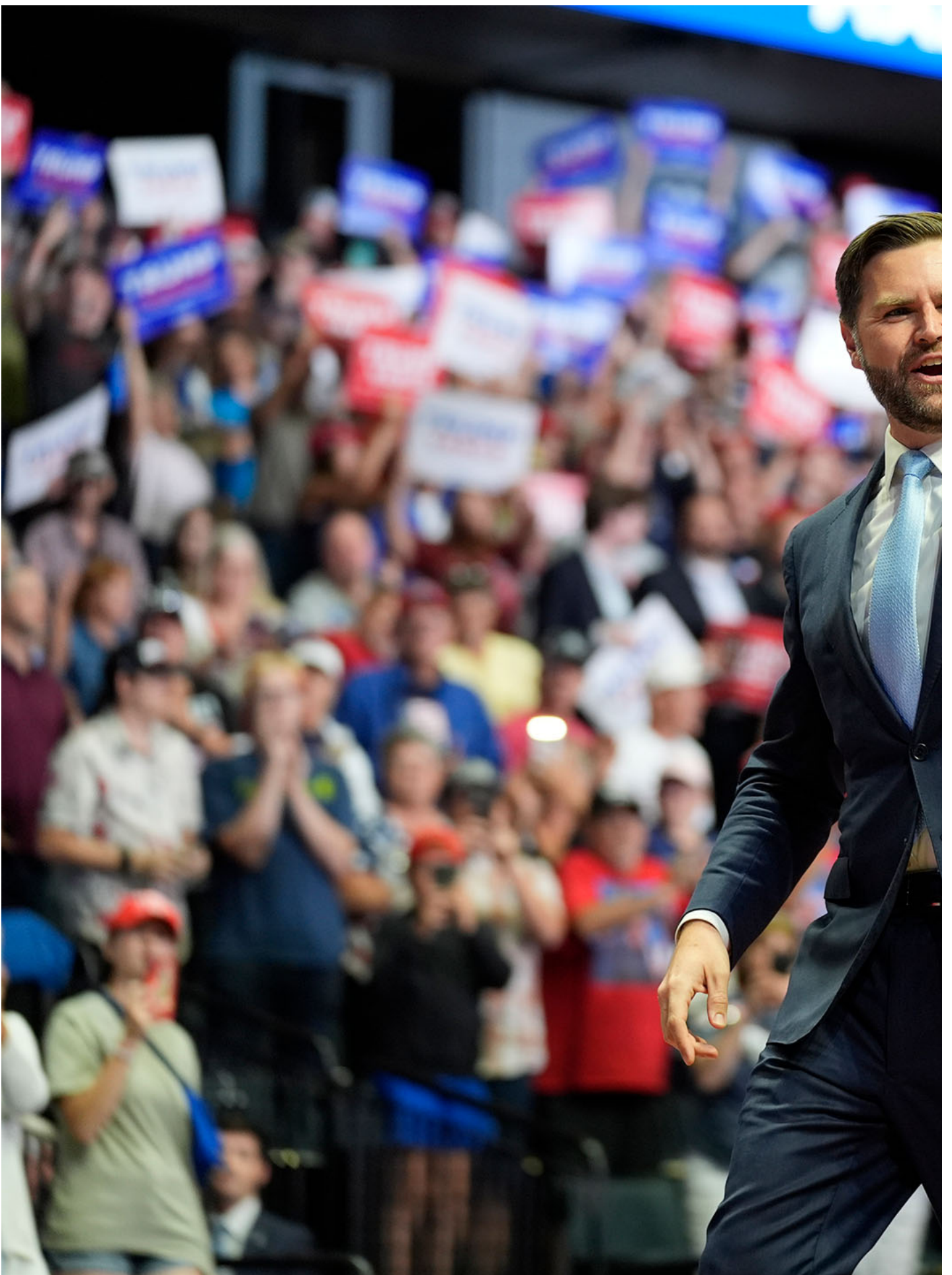
2024年7月20日，美国密西根州大急流城，共和党副总统候选人、俄亥俄州参议员 J.D. Vance 参加特朗普的竞选集会。