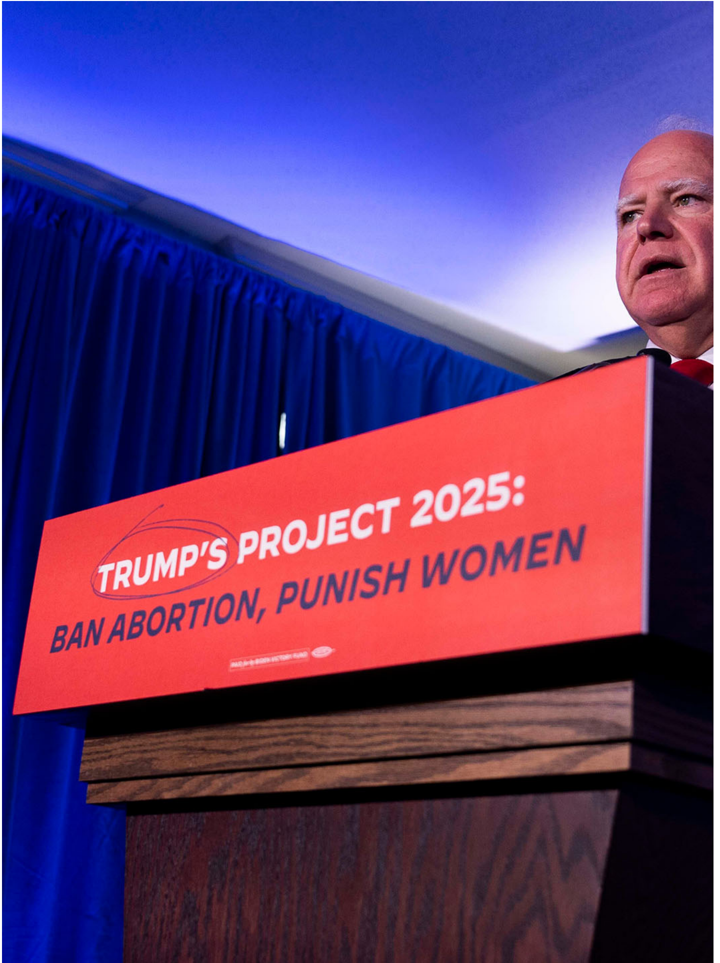
2024年7月17日，美国威斯康星州密尔沃基，拜登与贺锦丽竞选团队在新闻发布会上，抨击特朗普的“Project 2025”。

总而言之，这不是特朗普亲自主导的计划，但是为了特朗普所打造的计划，而计划的打造者当中又有许多真的是特朗普的人。