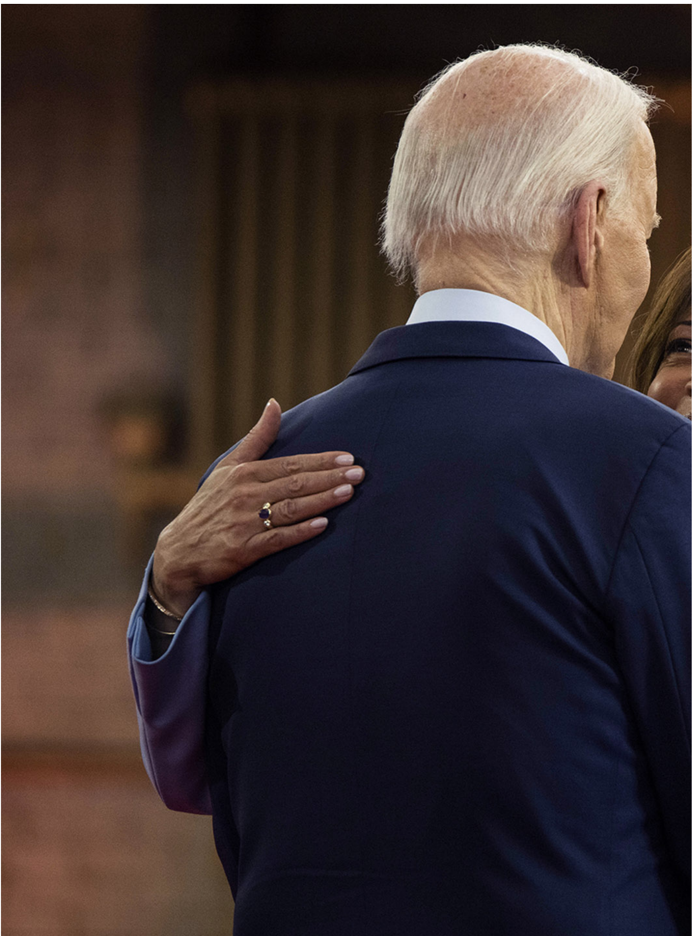
2024年5月29日，总统拜登和副总统哈里斯于费城吉拉德学院举行的竞选活动中拥抱。