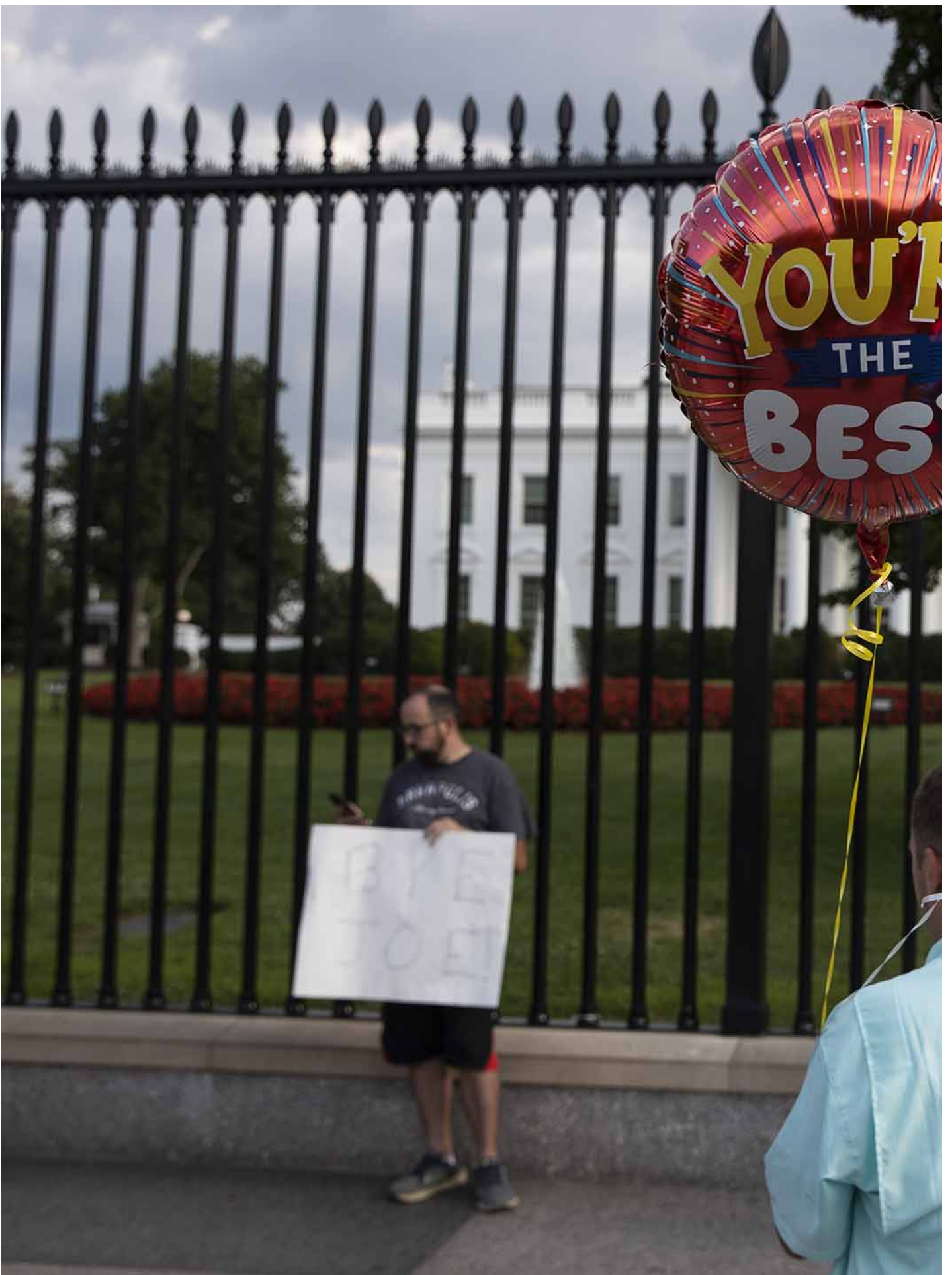
2024年7月21日，美国华盛顿，美国总统拜登宣布退选后，一个支持者在白宫外举着气球。