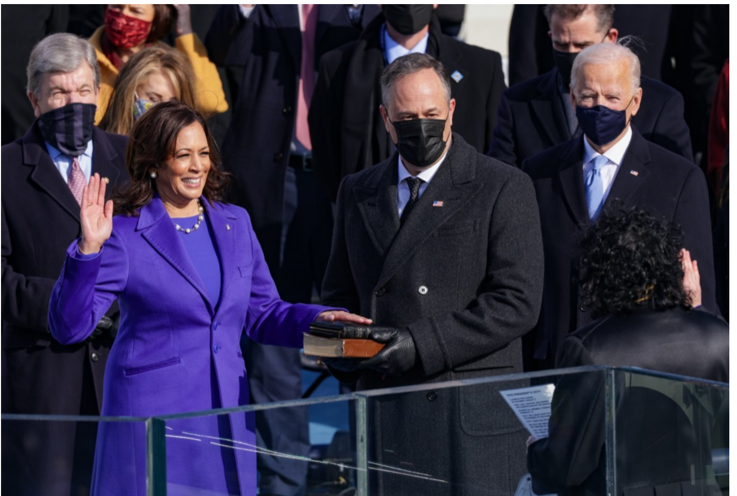
2021年1月20日，副总统哈里斯宣誓就职。

2016年特朗普的爆冷胜选，2020年拜登收复蓝墙，重夺锈带，都说明中西部有相当一部分选民习惯于选择白人男性作为总统。当然，这并不代表哈里斯一定就无法帮助民主党守住宾夕法尼亚、密歇根、威斯康辛这三个关键的锈带州，只是她很难继承拜登在劳工群体中的独有优势，这让她只能通过刺激党内少数裔和年轻选民，吸引女性选民和部分高教育程度城郊选民来另辟蹊径，抵消她替换拜登后失去的部分相对优势。此外，拜登在白人群体，特别是老年人中的特殊优势，恐怕也是哈里斯所无法完全复刻的，是注定要失去一部分选民了。