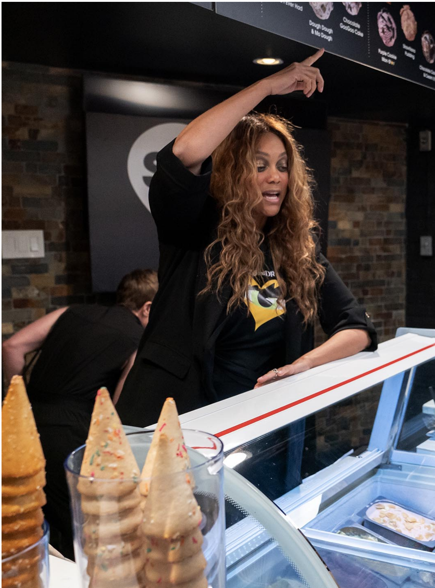
2024年7月19日，华盛顿，美国副总统哈里斯和她的两个侄孙女购买冰淇淋。

(Hakeem Sekou Jeffries)，以及老一辈政治家奥巴马、佩洛西都尚未直接背书哈里斯，但整个党的政治意愿毋庸置疑：就是要团结在哈里斯周围，尽快结束换马之后出现的权力真空期。