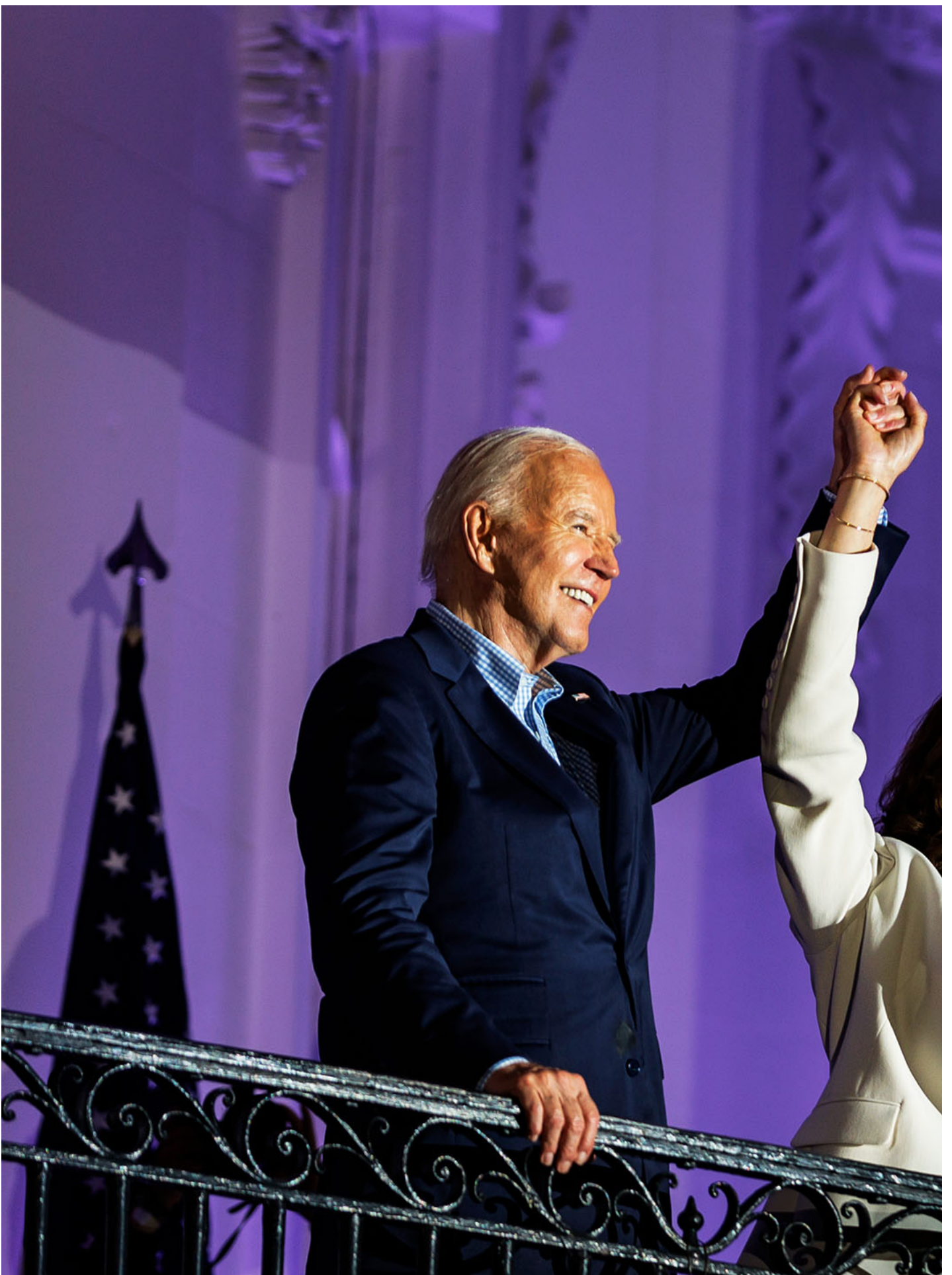
2024年7月4日，美国华盛顿，总统拜登与副总统贺锦丽在白宫阳台庆祝独立纪念日活动。