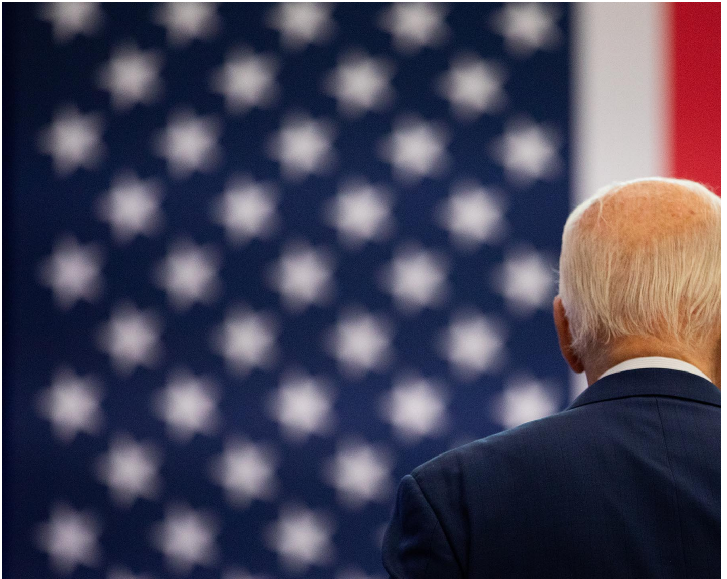
2024年7月12日，美国总统拜登在美国底特律举行的竞选活动中。

民调数字表明要求拜登退选已成为主流民意，五成六的民主党注册选民和超过七成的独立选民都表示拜登应该退出竞选。