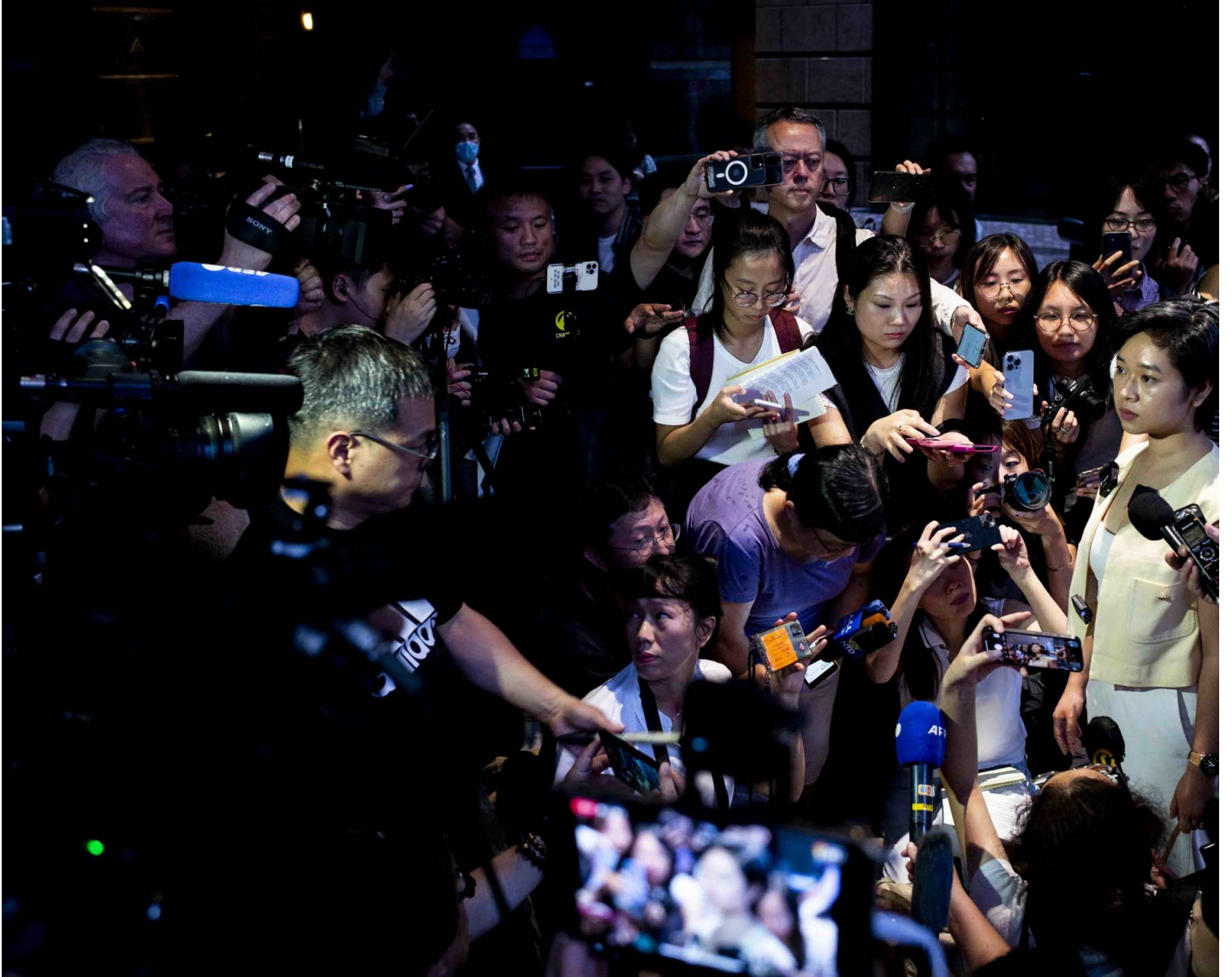
2024年7月17日，香港记者协会主席郑嘉如遭《华尔街日报》辞退，在中环广场的办公室下接受传媒访问。