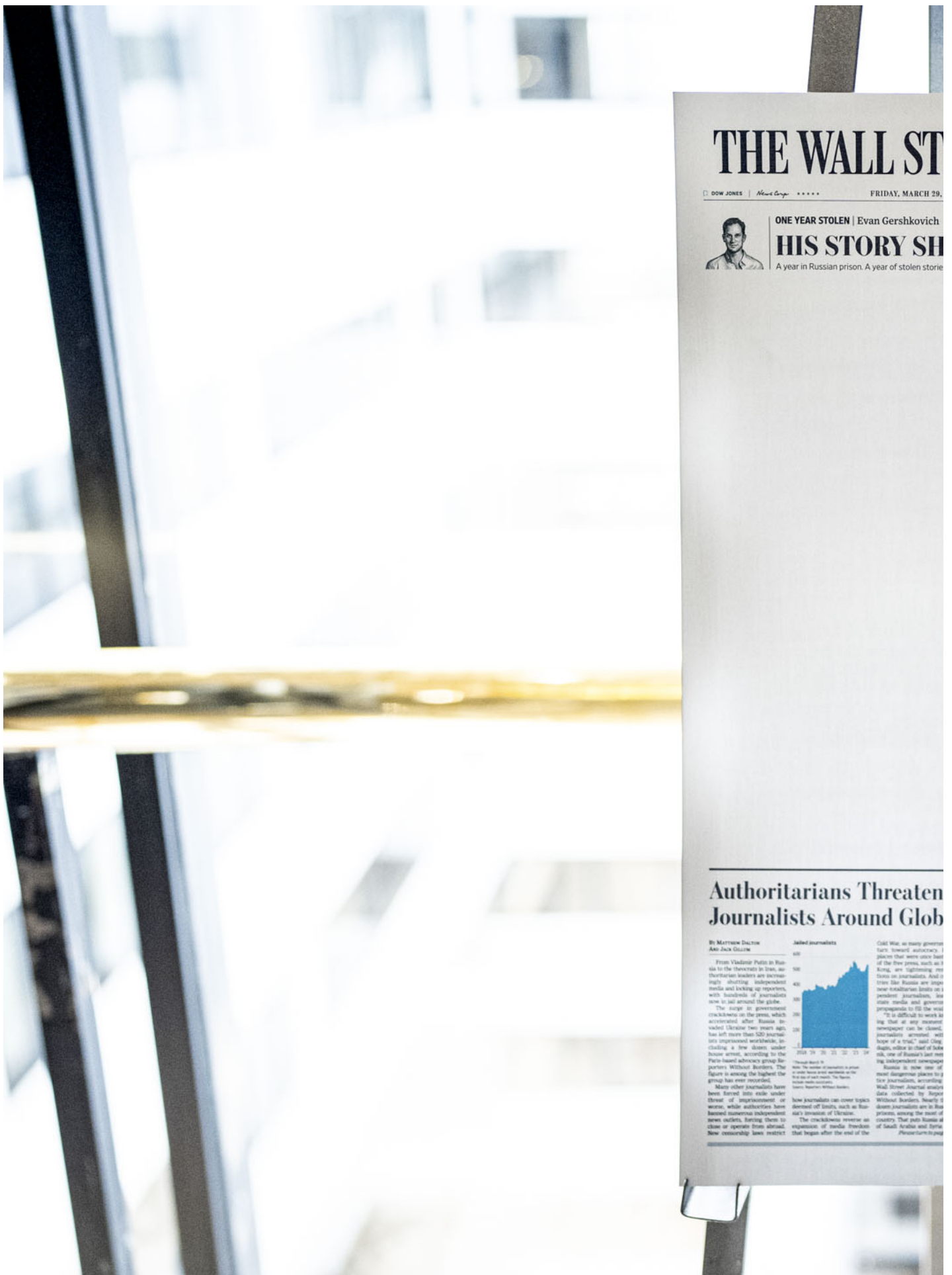
2024年5月3日，华盛顿国家新闻俱乐部展示《华尔街日报》记者 Evan Gershkovich 被捕一周年的《华尔街日报》头版。