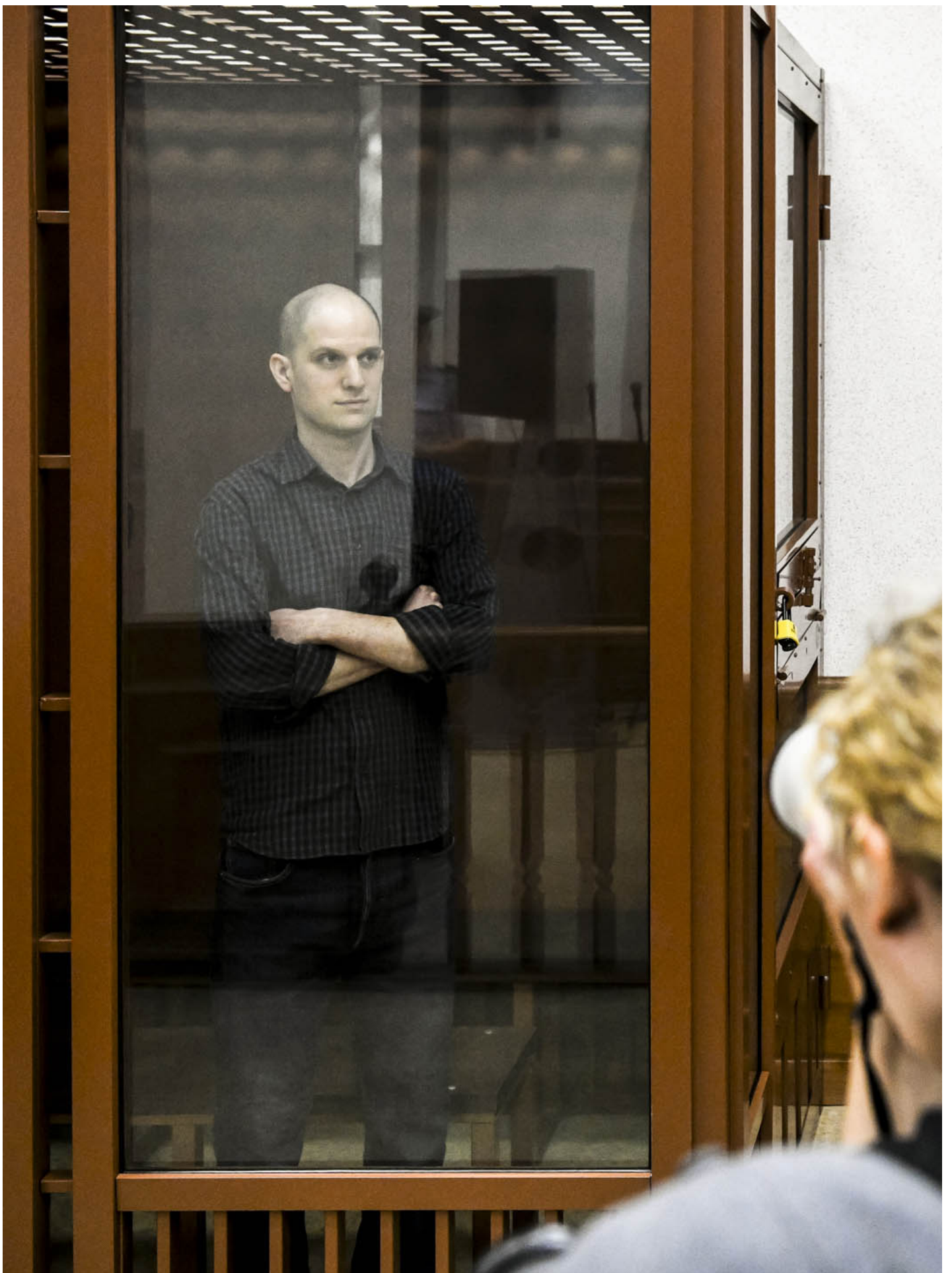
2024年6月26日，《华尔街日报》驻莫斯科记者 Evan Gershkovich 站在俄罗斯叶卡捷琳堡法庭的玻璃笼子里看著记者。