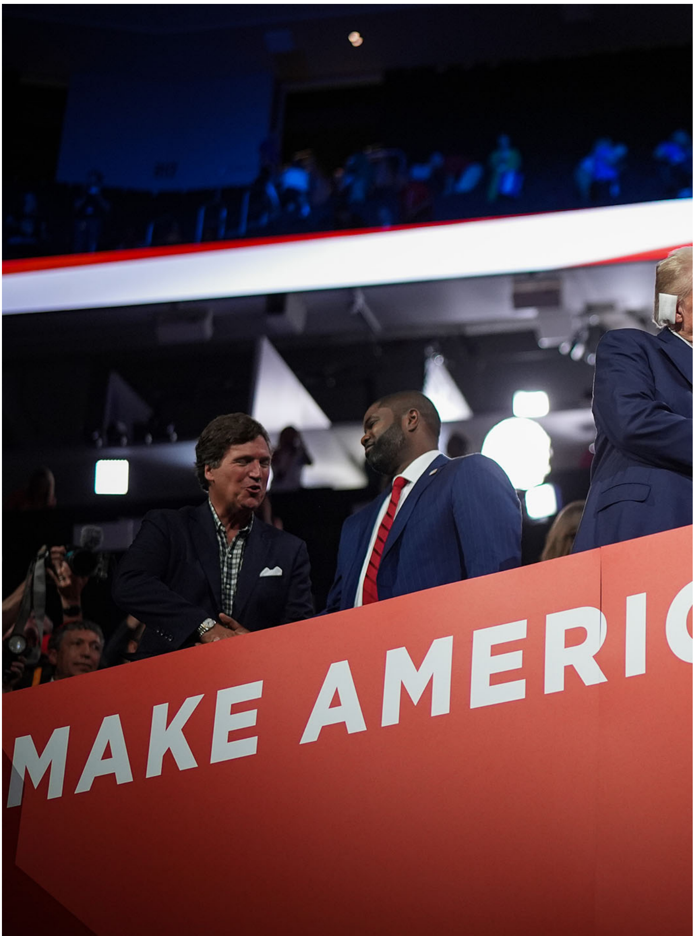
2024年7月15日，美国密尔瓦基，共和党总统候选人、前美国总统川普（左）与副总统候选人、俄亥俄州参议员 J.D. Vance（右）在共和党全国代表大会上握手。