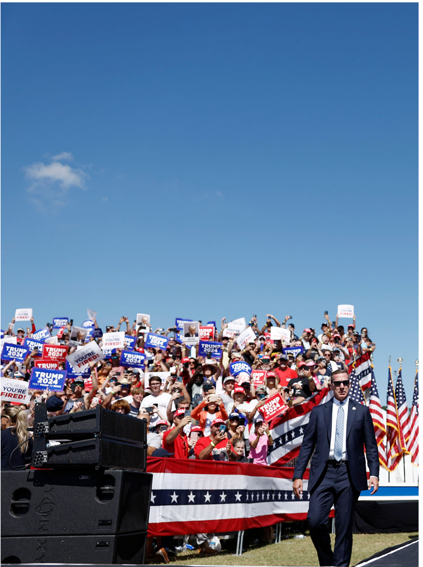
2024年6月28日，美国美国维吉尼亚州，共和党总统候选人、前美国总统川普参加竞选集会。