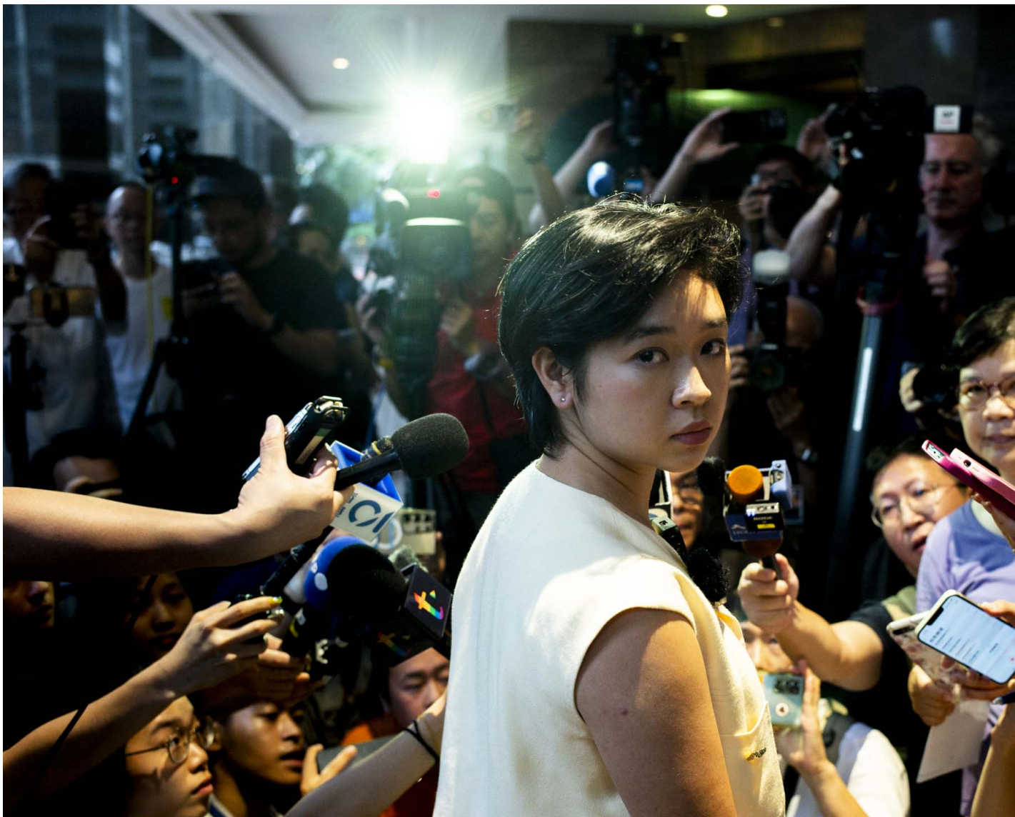
2024年7月17日，香港记者协会主席郑嘉如遭《华尔街日报》辞退，在中环广场的办公室下接受传媒访问。

“记者去推动和保护新闻自由是必须的，这在世界各地所有地方都是一样。新闻自由的需要不会因为地域而改变。”