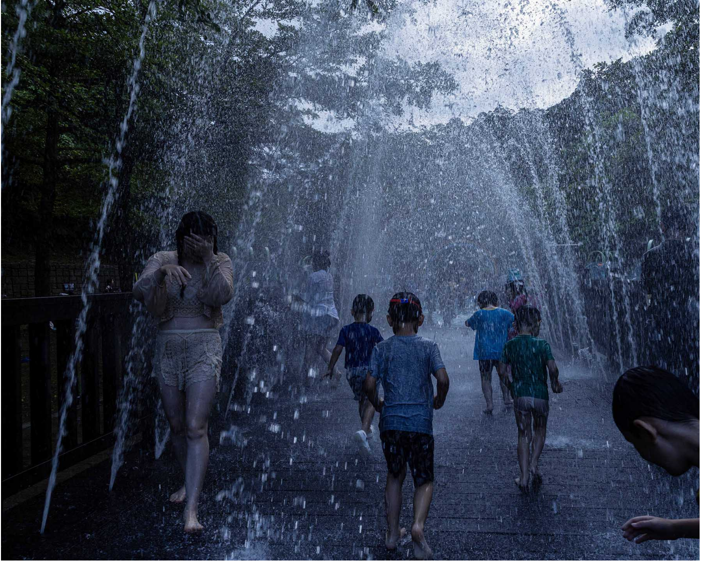
2024年6月30日，儿童在亲水公园嬉水。

台北市一间私立幼儿园园长之子被控于2023年涉嫌猥亵、性侵多名幼童，目前全案依涉犯儿少性剥削等罪持续侦办，台北地院将在8月宣判。