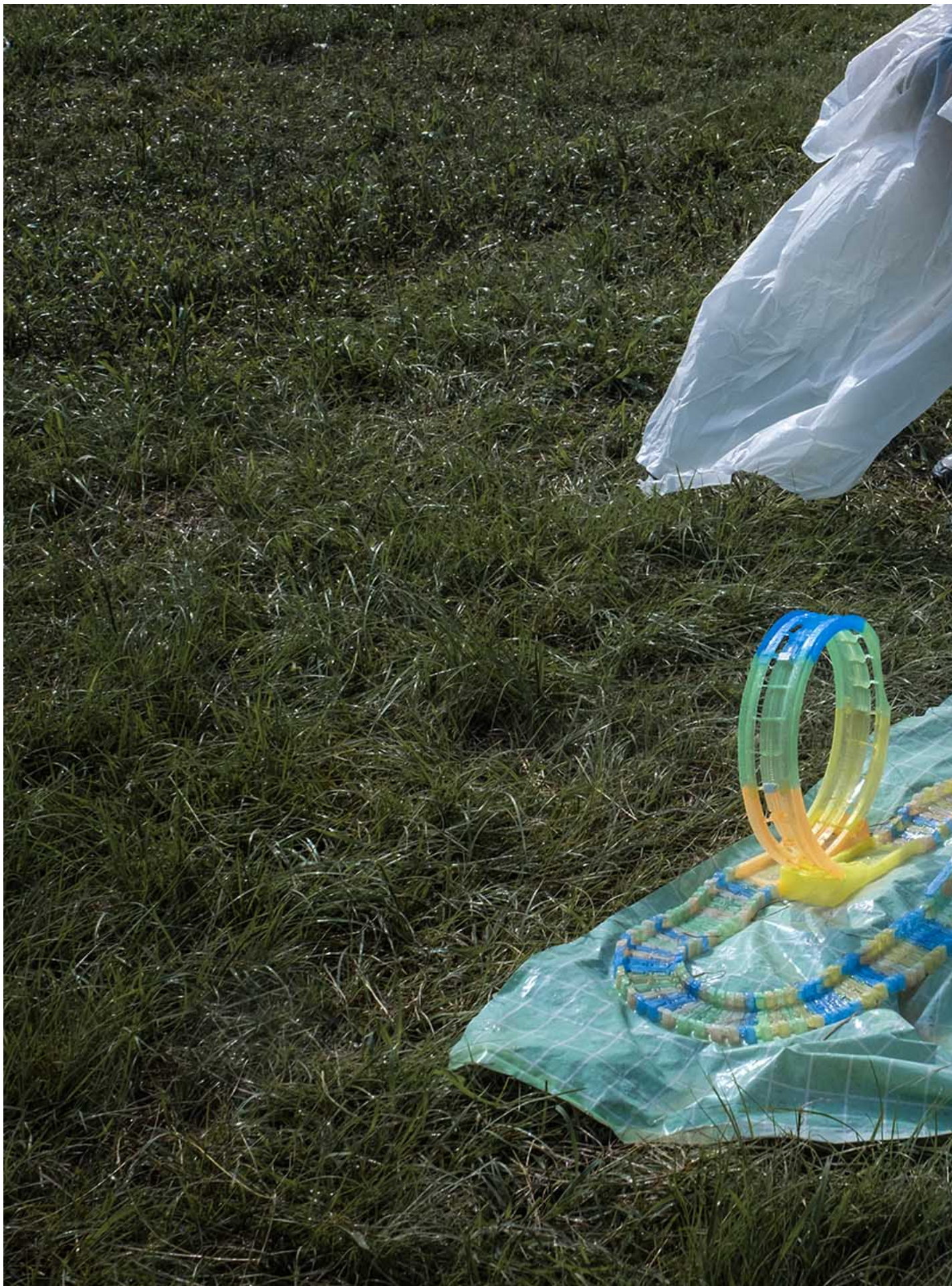
2023年7月22日，台北市的一场园游会。

不过，去年12月， 新北国中生割喉案也曾引发报导界线的相关疑虑 ，但却是部分媒体过度揭露事件特征，引发网友跟进指涉、公布当事人相关资料，新北地院也因此特别声明警告媒体与民众勿触犯《少年事件处理法》中限制公开资讯等规范。