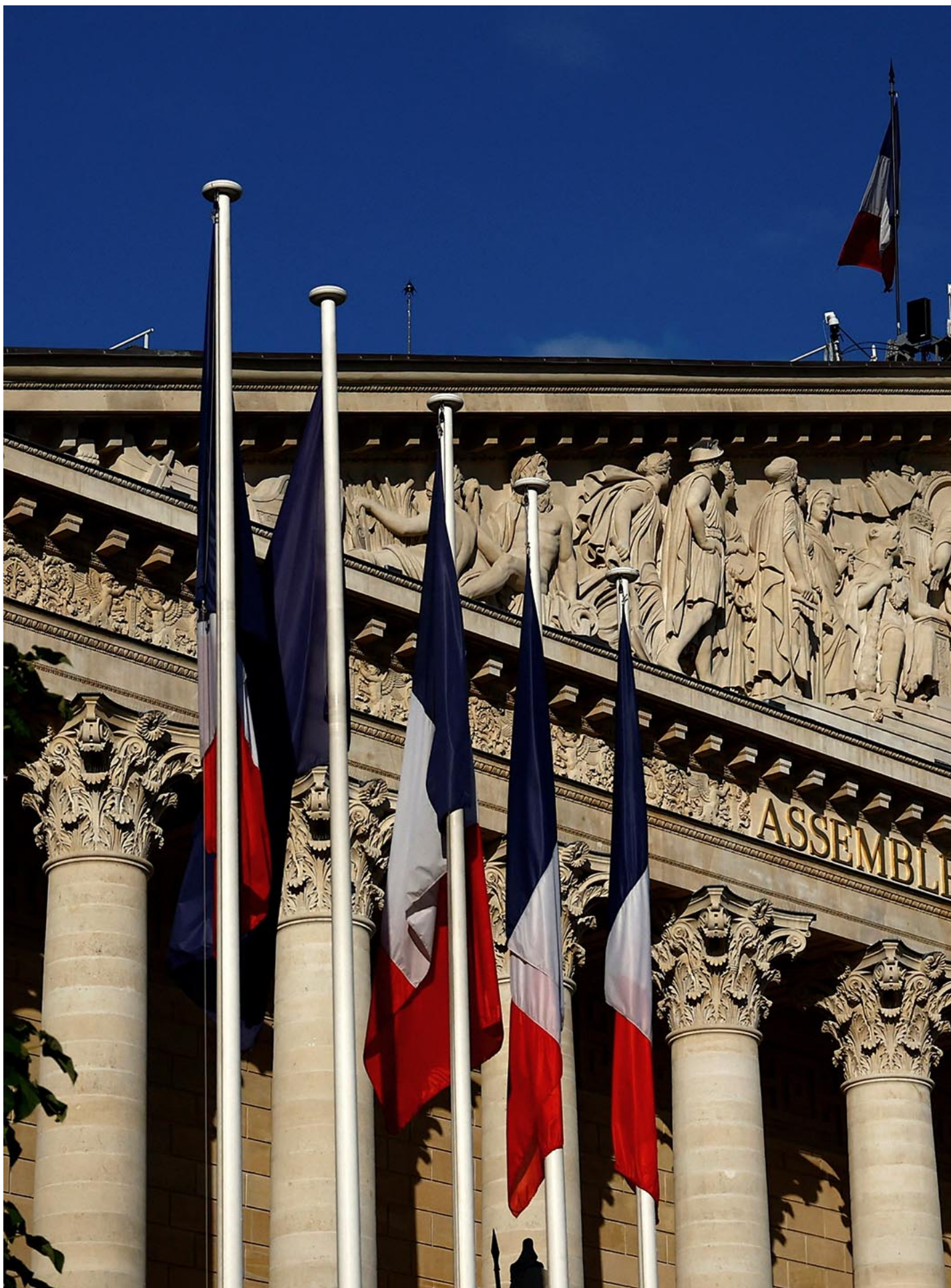
2024年7月9日，法国巴黎国民议会。

造一种全新政治文化的责任，将决定这次选举带来的是“政治瘫痪”，还是欧洲式议会政治在法国的重新崛起。