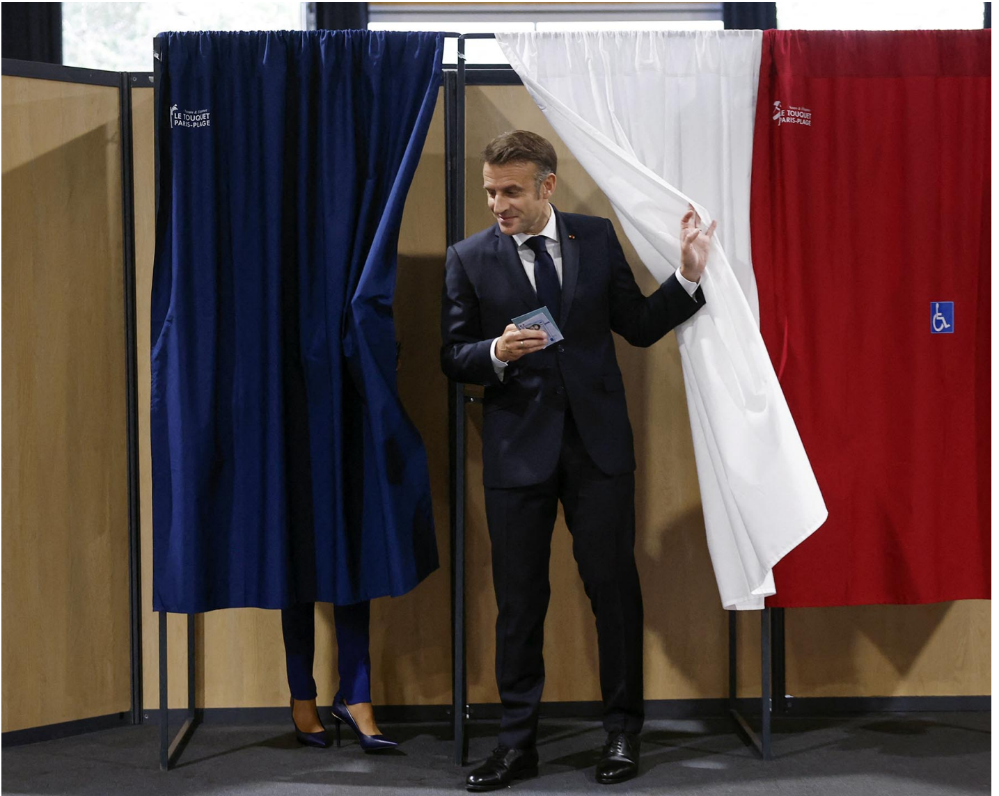
2024年7月7日，法国议会选举第二轮投票，法国总统马克龙在投票所投票。

如果说2024年7月7日的法国议会选举第二轮投票的结果，给了我们何种一般性的教益，那就是永远不要低估法国政治的戏剧性潜力。如通常被认为出自拿破仑一世之口的名言所说，“‘不可能’这个词不属于法语。”（L'impossible n'est pas français.）偶然和意外，似乎刻在了这个大革命以来从不缺乏惊人转折的国家的政治基因里。