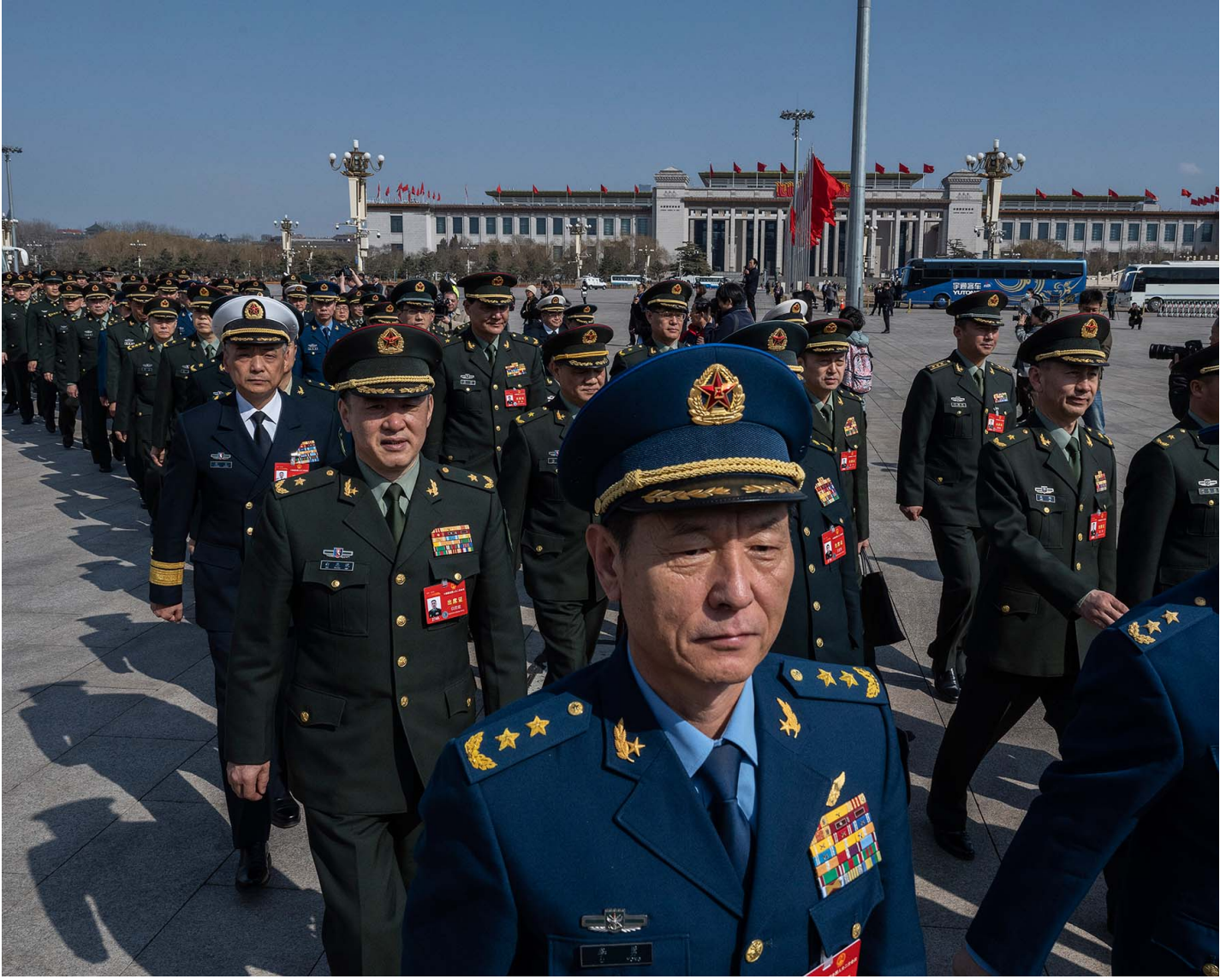
2024年3月11日，中国北京，军事代表在人民大会堂出席第十四届全国人大二次会议闭幕仪式。

改革开放历史中那些相对隐秘、不为人知的片段，如何在潜移默化中为中国经济在今天暴露出的问题埋下导火索？