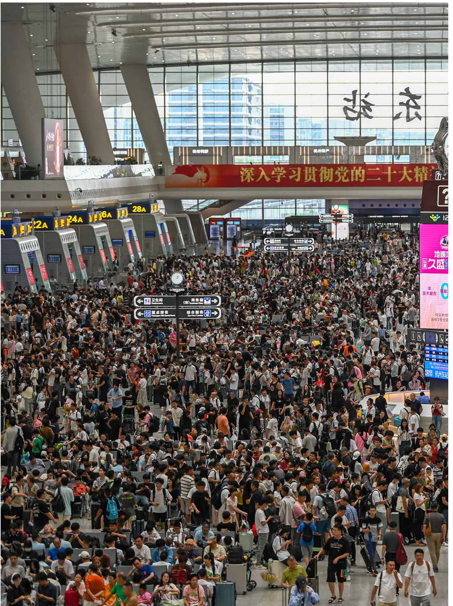
2024年7月1日，中国杭州，旅客在杭州东火车站等候。

但本书作者指出，官僚体系归根到底是由一个个具体、鲜活的人组成的，这些人并不真的仅仅是官僚机器的螺丝钉，而是有着自己的精神气质、认知方式、喜怒哀乐、职业野心。因此，如果要深入理解官僚体系的运转，仅仅在组织层面分析官僚体系的运行逻辑是不够的，还必须同时关注身处官僚体系中的那些人究竟是怎样的人。本书作者对各个官僚群体的背景爬梳，使这些人物的形象在读者眼中变得生动起来。我们看到，不同官僚群体的教育背景、以及其在官僚体系中的职业轨迹，是如何赋予这些官僚群体特定的认知模式、形塑他们对经济问题的理解。我们同时还看到，在围绕政策制定而展开的竞争中，不同的官僚群体如何运筹帷幄、寻找机会，努力推动自身的政策主张成为主导范式。换言之，王颖曜笔下的中国官僚体系，是一个充满个体能动性、人物戏剧性的官僚体系。