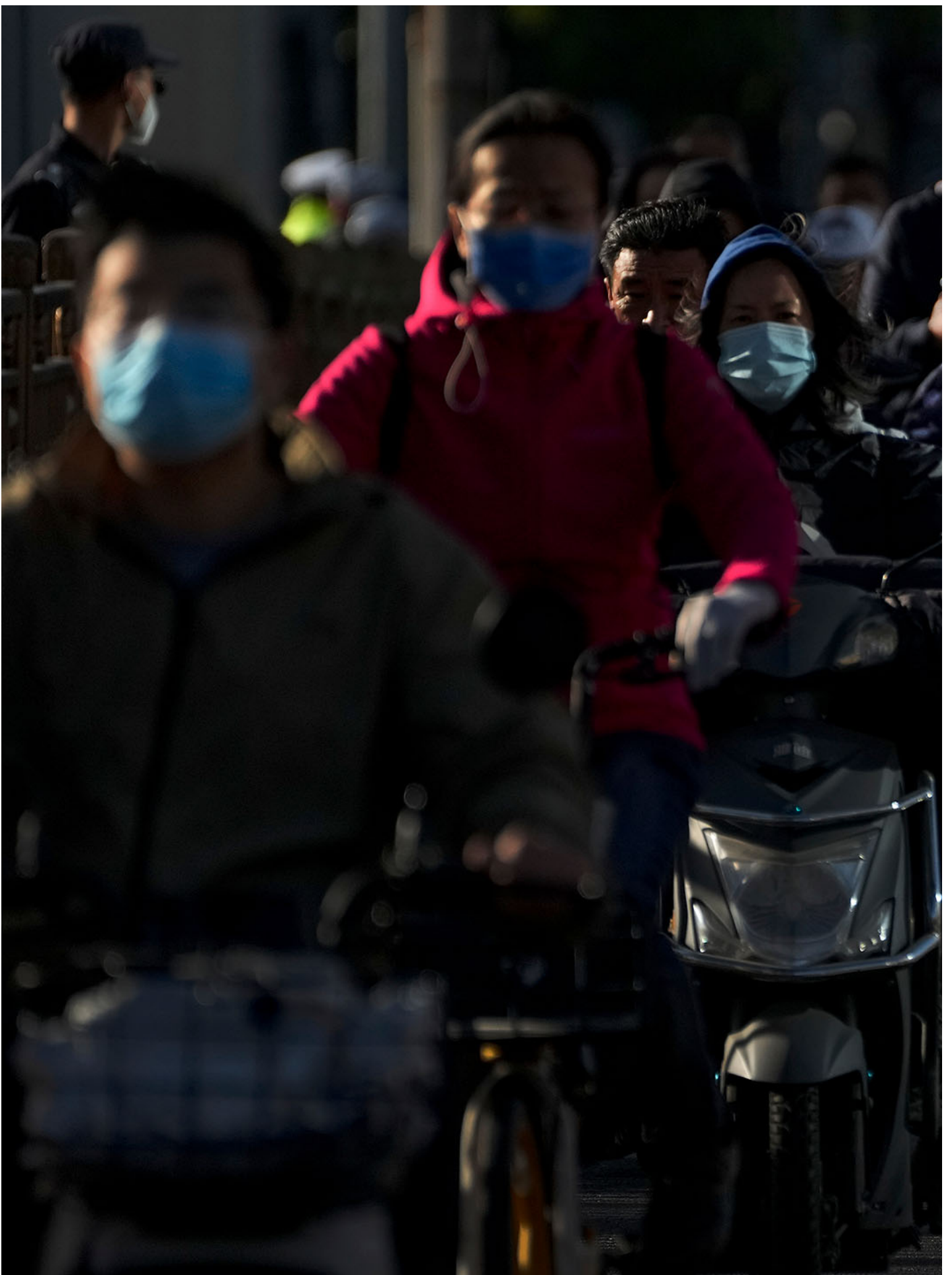
2022年10月16日，中国北京，人们在街上骑着电动车。

最后，在产业政策领域，2008年工业与信息化部（简称“工信部”）的成立是重要的转折点。作者指出，在此之前，“比较优势”理论在经济政策制定者中影响很大，政府积极鼓励劳动密集型、低附加值的制造业发展——换言之，中国并无严格意义上的产业政策。但随着工信部的成立，一批既具有科学技术方面的教育背景，又有工厂与产业部门的具体工作经验的官僚被聚拢起来。这批“产业官僚”带来了一种看待产业发展的新方式：不是将经济体看作一个一个可被分割开的产业，而是将其视为一系列流动的产业链条。“产业官僚”们从而能够通过这些链条，去追溯哪些零部件生产环节可被广泛用于多个产业、因而最具战略价值。这样一种分析思路，将关键零部件生产环节的自主创新、技术升级的重要性凸显出来。“产业官僚”带来的认知方式革新，使其在产业政策的制定上获得越来越大的话语权。作者在书中细致地描述了“中国制造2025”计划是如何在工信部的推动下出台的。这一批官僚的努力，使得2008年金融危机之后的中国出现了强调自主创新的产业政策转向。