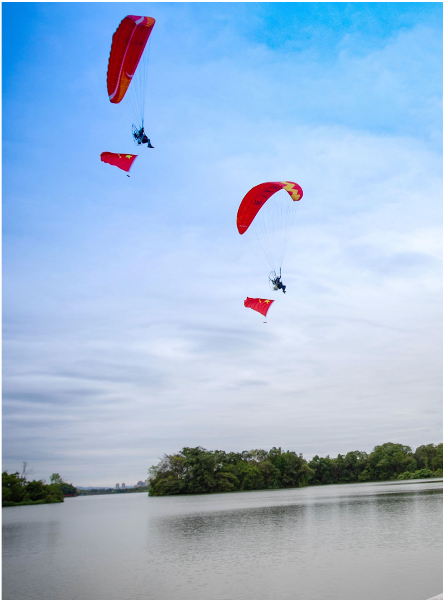
2024年4月30日，中国重庆举行低空飞行消费周，人们在龙水湖附近观赏低空飞行表演。

但是，笔者在读完本书后还是不禁要问：中国的经济政策制定到底在多大程度上是“去政治化”的？在中国，经济管理真的是一个由“专业的人办专业的事”所驱动的过程吗？诚然，中共政权在90年代和21世纪初使用了“去政治化”的统治策略，即通过调动人们在市场经济中致富的热情来消解政治参与和政治改革的诉求。但这并不意味着政治问题、意识形态问题以及阶级问题不再是中共统治者在制定经济政策时需要考虑的重要因素。事实上，如何稳定自身的统治基础与分配联盟、如何构建与时代大环境相适应的统治策略和公共话语、如何回应社会基层力量中潜滋暗长的政治挑战——这些问题历来在中共政权眼中是优先级最高的，经济政策也是为这些目标服务的（在习近平时代，这一点变得越发明晰起来）。换句话说，中国的经济政策制定至少是一个政治考量与技术考量共同驱动的过程。本书作者之所以认为经济政策制定是“去政治化”的，恐怕是因为作者在分析时仅仅关注了经济政策场域，而忽视了经济政策与其他政策场域之间的联系。