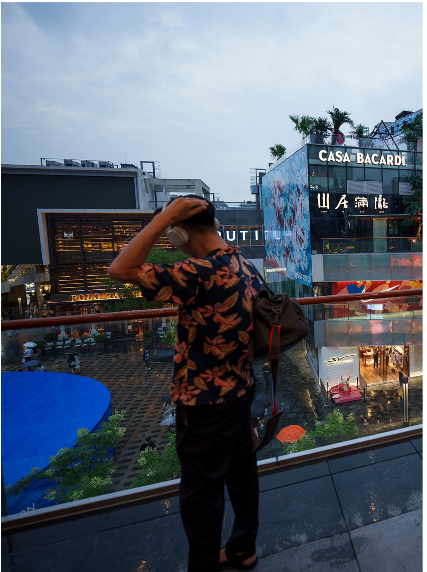
2024年7月2日，中国北京，人们在商场内购物。

第二，本书的历史叙事让我们看到，在80年代与90年代的经济改革逻辑之间，倒是恰恰存在着很大程度的断裂。由于“地方官僚”群体的推动，80年代的市场改革常常是以中央政府向地方政府、向企业、向社会基层力量放权的形式展开的。地方政府和企业的权力扩大，导致地方保护主义盛行、基层的经济活动充满盲目性，造成宏观经济的失序。中央政府对经济的管控能力日益变弱，面对经济失序常常一筹莫展。而到了90年代，随着工科背景的“技术官僚”群体上台执政，中央政府的权力被大大加强。中央政府对地方保护主义的削弱，也使得全国范围的市场整合成为可能。重新将权力集中起来的中央政府，开始以狂飙突进的速度推进各项市场化改革，并且也习得了使用新的市场工具管控经济的能力。随着“宏观调控”政策范式的确立，邓小平在1989年提出的“稳定压倒一切”的口号也在真正意义上照进了经济现实。