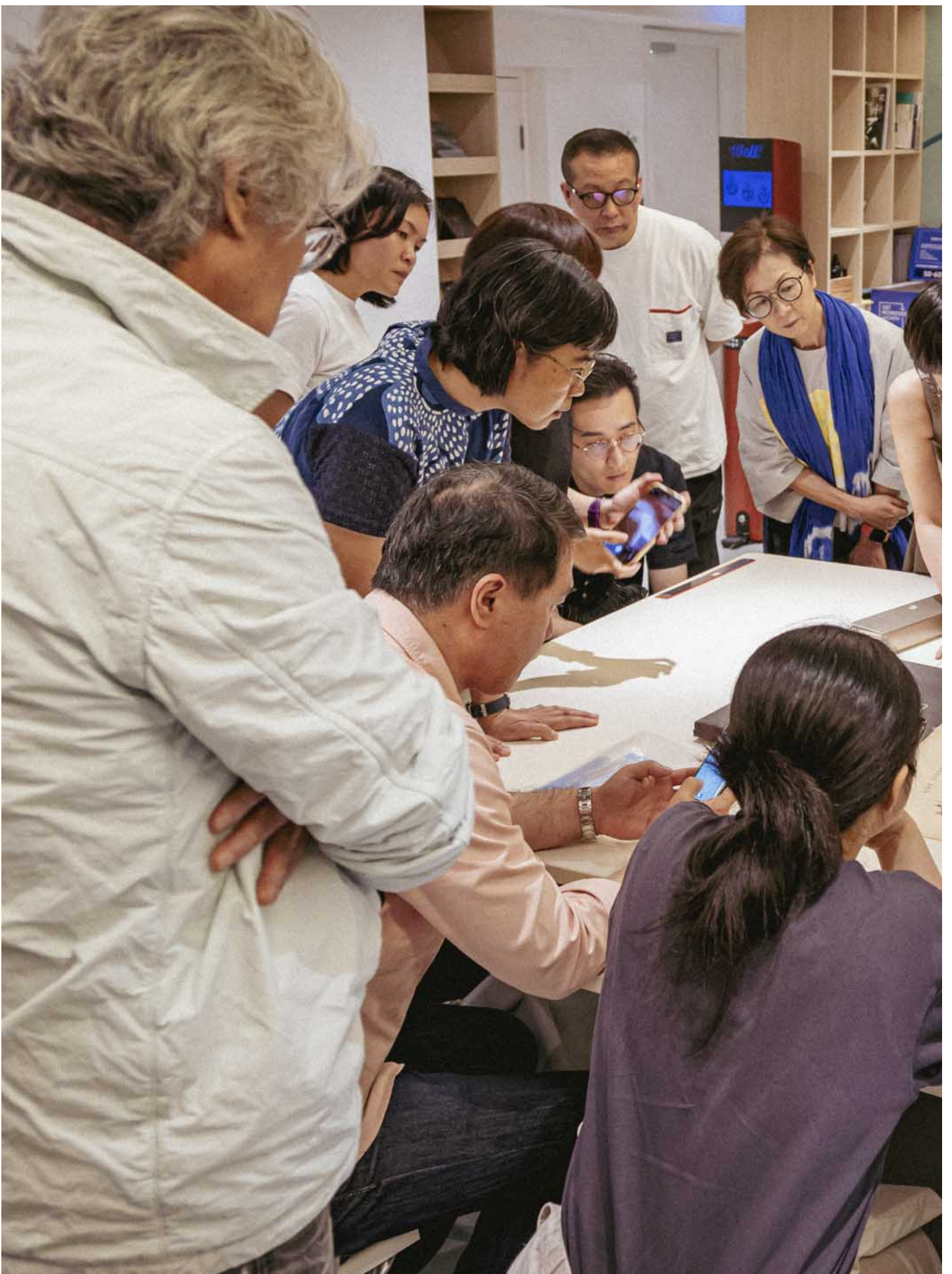
举办文献修复班，教大家如何保存发霉受损的家庭史料。