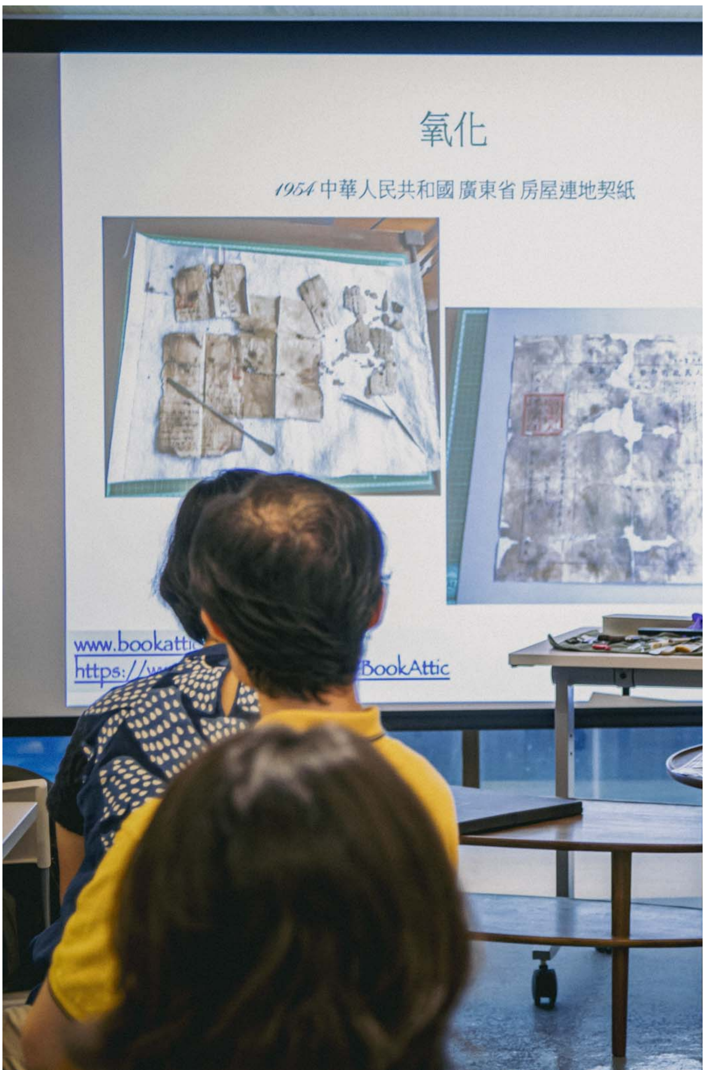
除了分享资料搜集及口述历史的心得，我们还举办了教大家保存及复修家中珍贵文件的工作坊。