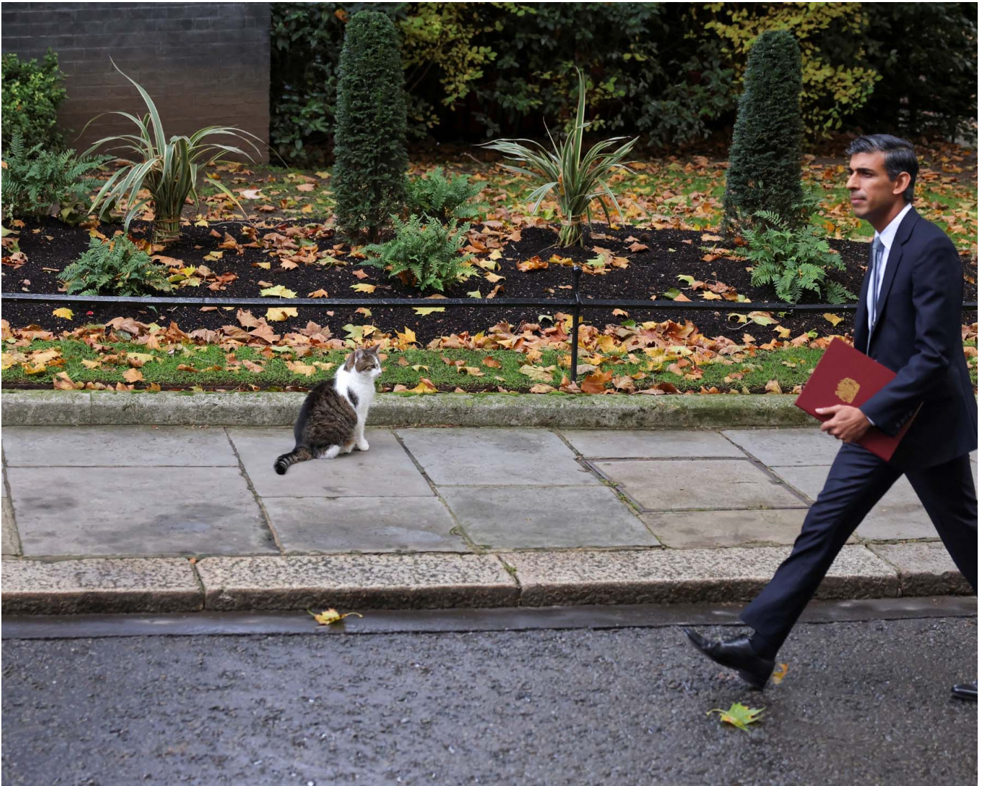
2022年10月25日，英国伦敦唐宁街，英国首相苏纳克碰上唐宁街的猫Larry。

保守党的问题大概可分为两类。其中之一是面临困难时有缺陷的回应与战略；另一种则是完全自我招致的，近乎不可理喻的政治灾难。