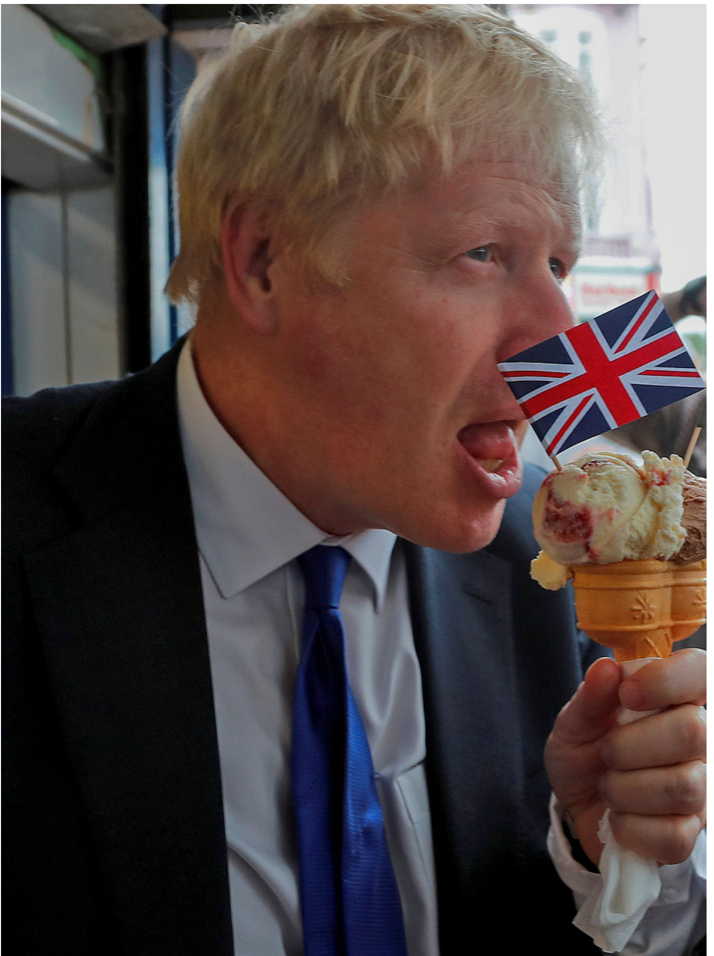
2019年7月6日，英国保守党约翰逊在英国巴里岛出席竞选活动。

撒切尔夫人或许是一位自豪、张扬的英国爱国者与传统价值观维护者，但她同时也是欧洲共同市场的奠基人之一。根据乔治·奥斯本的说法，鲍里斯·约翰逊（Boris Johnson）或许从来内心深处并不支持脱欧，但是这并不妨碍他以脱欧作为抓手，在选民中制造分裂和极化，于2019年大选中从工党的传统强势阵地英格兰北部获得席位突破（这些席位在2024年选举中全部被工党收回）。