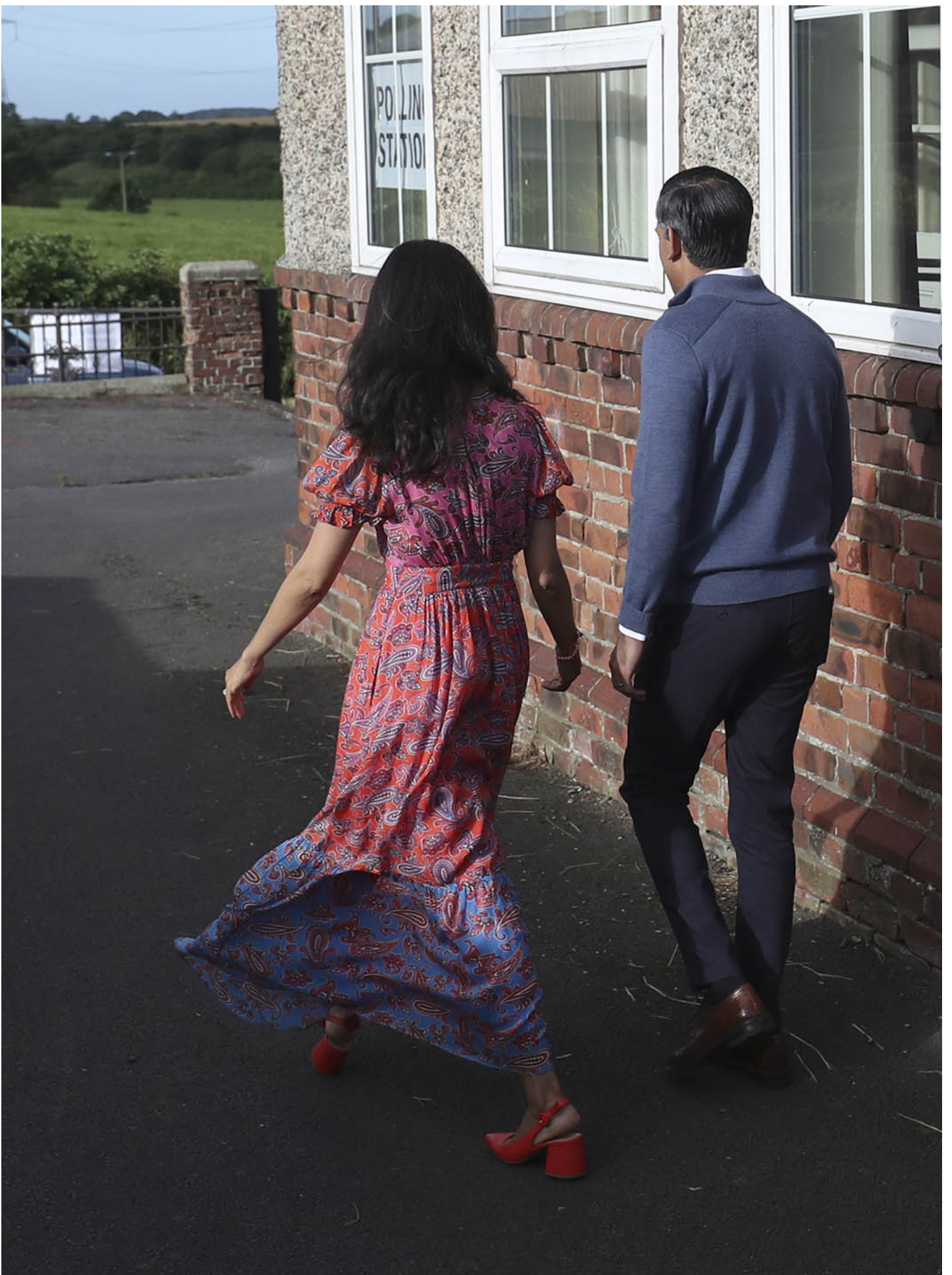
2024年7月4日，英国首相苏纳克(Rishi Sunak) 和他的妻子阿克莎塔·穆蒂(Akshata Murty) 投票后从投票站离开。