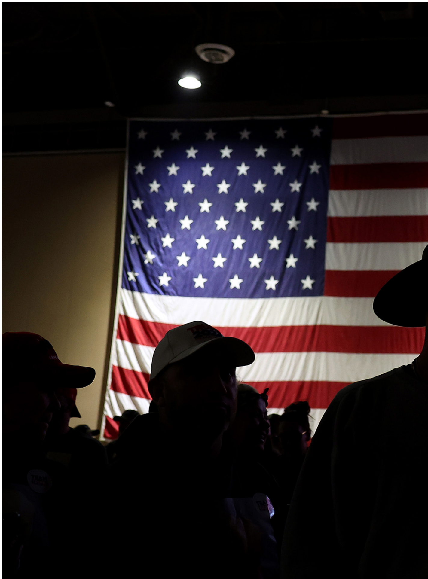
2023年12月17日，共和党候选人科朗普的竞选集会。

如果说这种趋势有什么积极意义的话，或许可以说齐泽克当年的命题还是有其正确的一面。如果民主党在败选后能够意识到，他们的行为不是没有后果，左翼选民不是只用煤气灯就可以动员起来，而是必须正视和重视其政治诉求，那么从长期来看，败选还可以提供一个教训。当然，类似的教训，民主党之前也不是没有面对过；况且吸取教训的前提，也在于特朗普的第二个任期不会对民主制度造成彻底的、不可逆的破坏。