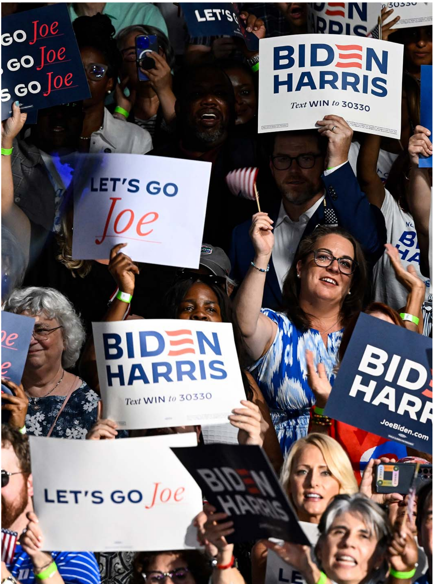
2024年2月28日，美国总统拜登在竞选集会上发表讲话。