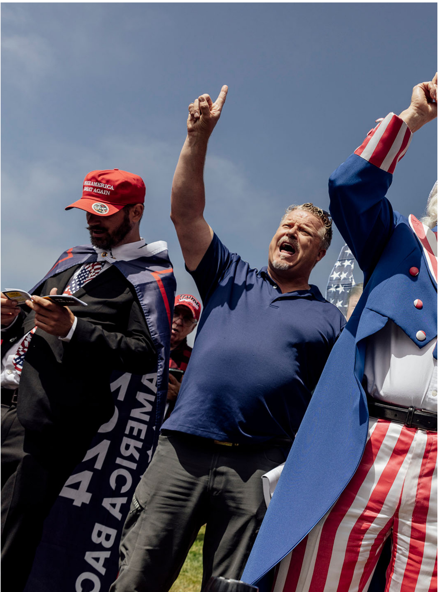
2024年6月6日，共和党候选人特朗普的竞选集会，支持者在台下唱歌。