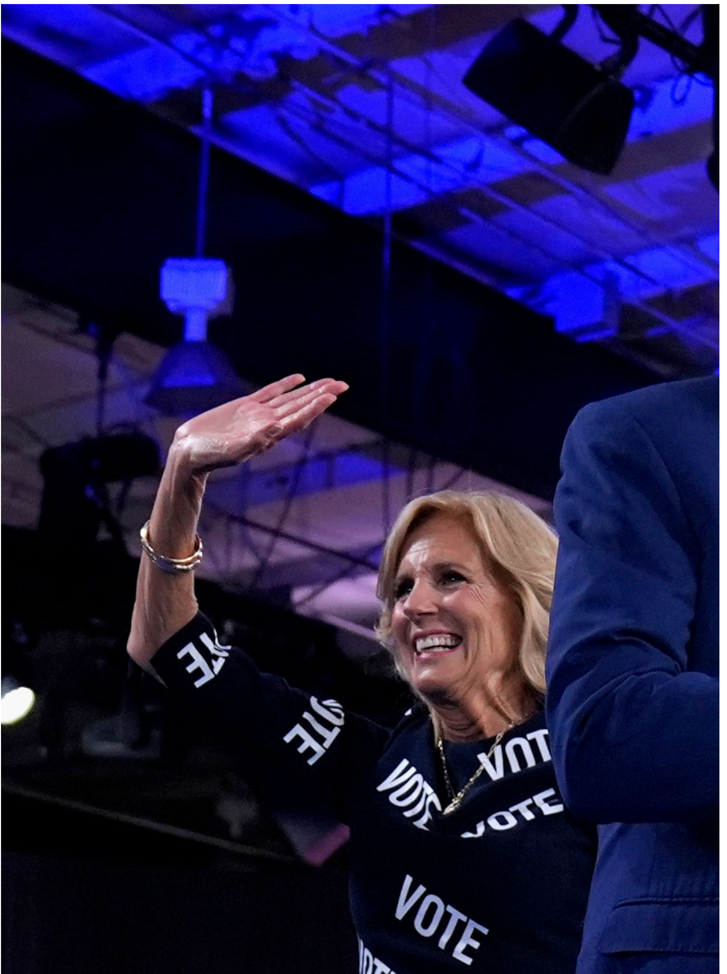
2024年6月28日，美国总统拜登（右）和第一夫人吉尔（左）在竞选集会上发表讲话。

也正是这样的装点文化，让拜登提名了此前存在感不高的建制派参议员卡马拉·哈里斯（Kamala Harris，贺锦丽）作为副总统。当支持者们欢呼美国的第一个女性副总统和第一个黑人副总统时，似乎没有人意识到哈里斯代表的是一种和奥马尔所代表的截然不同的“黑人女性”。讽刺的是，哈里斯的副总统提名实则为2024年的危机埋下了重要的伏笔。正是因为拜登身边缺乏一个强大而有威信的副总统，民主党才会在四年后感到除了拜登之外无人可推。（拜登不应该没有想到这一点，因为他本人此前正是作为一个比较有作为的副总统获得了人气。）