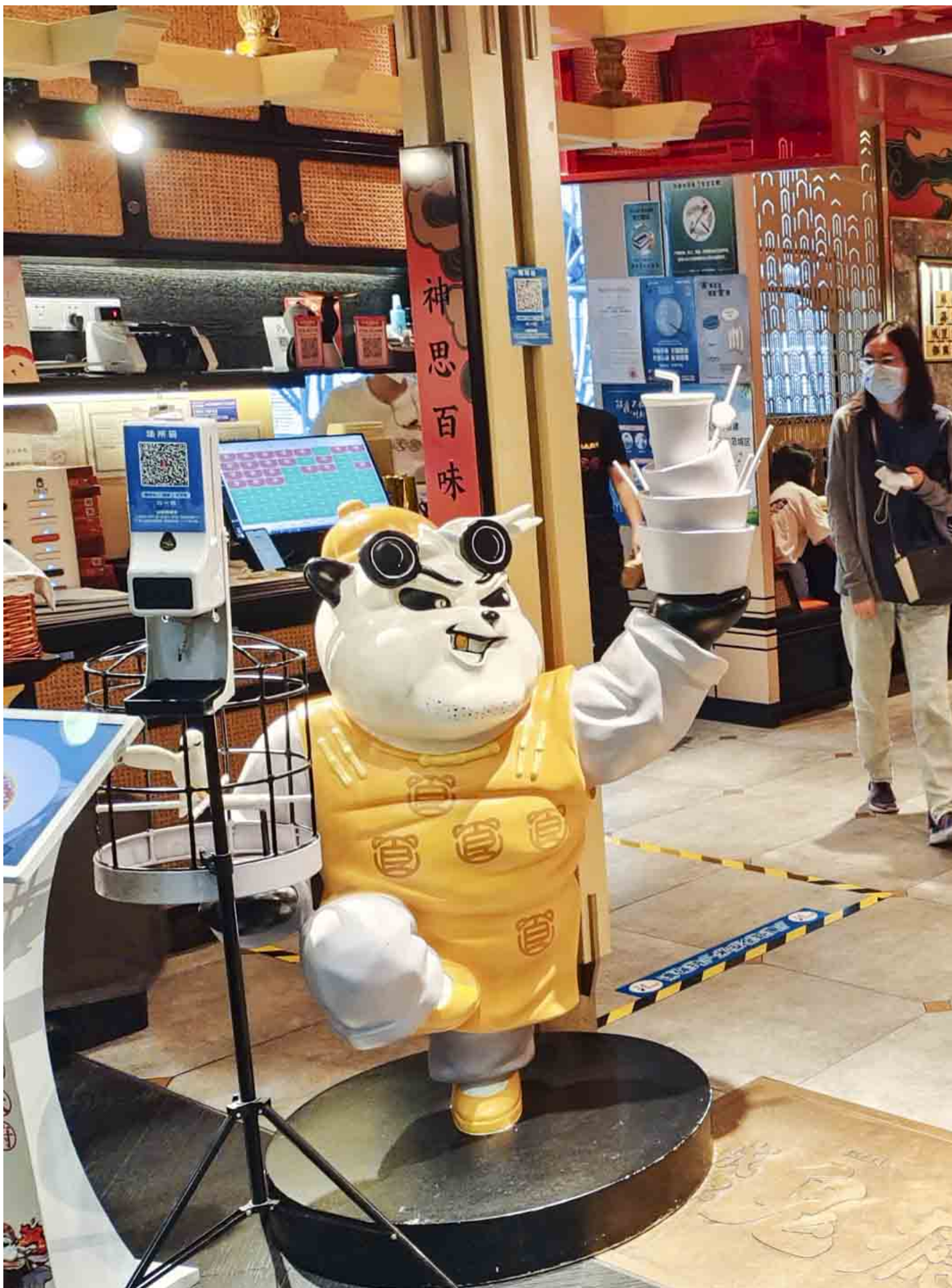
2022年8月28日，中国上海，市民在一家购物中心购物。当时上海政府投入2亿元市财政资金，透过支付宝、银联云闪付等平台发放200万份价值100元的消费券包。

这样大的阵仗，让“国家反诈中心可以有效防止诈骗”的概念植入了很多人的心里。和杨兰有相似遭遇的不在少数，一些遭遇诈骗的受害者称，此前只是因为正常消费就被系统识别进而误封的银行卡，在和“真正的诈骗犯”进行交易时，却能畅通无阻，直到去报案，警察才象征性地对卡进行冻结。“都骗到一分钱没有还封，这种亡羊补牢的做法，和走流程有什么两样。”