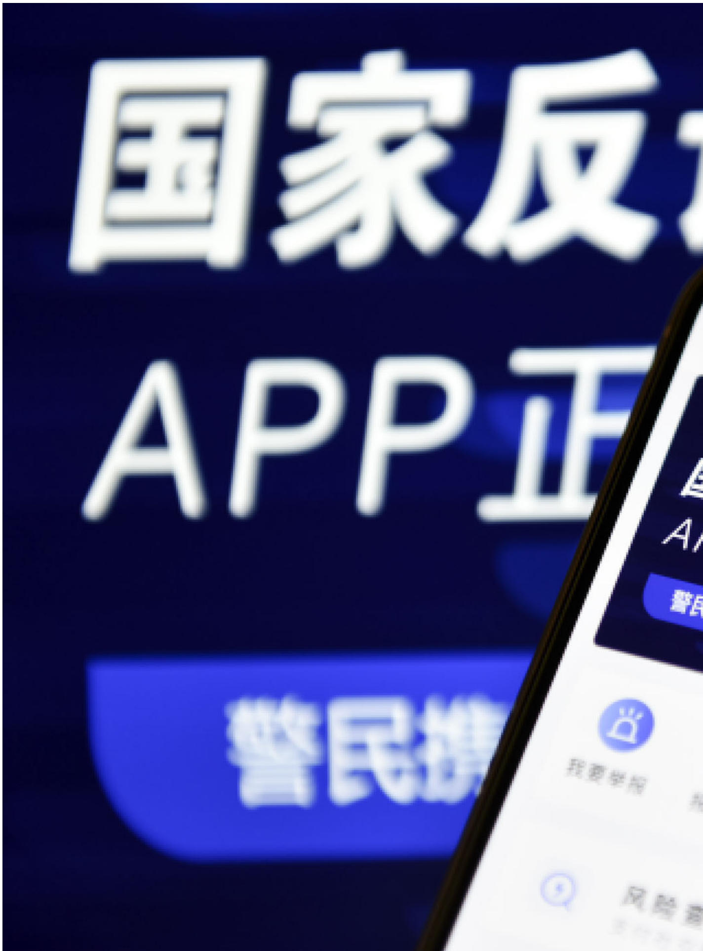
2021年9月9日，中国北京，手机显示“国家反诈中心”app，这是一款由中国公安局开发的应用程序，用于处理可疑和欺诈性的电话、短信和安装的应用程式。

结合多方信源，反诈中心隶属于各地公安局，并与中国移动、中国联通、中国电信三大运营商以及建设银行、中国银行等银行协作。它的运行逻辑，是“利用大数据技术，根据受害人的行为特征建立模型，对于符合这一模型的人，反诈中心将进行预警，在资金损失前，阻止受害人被骗”。