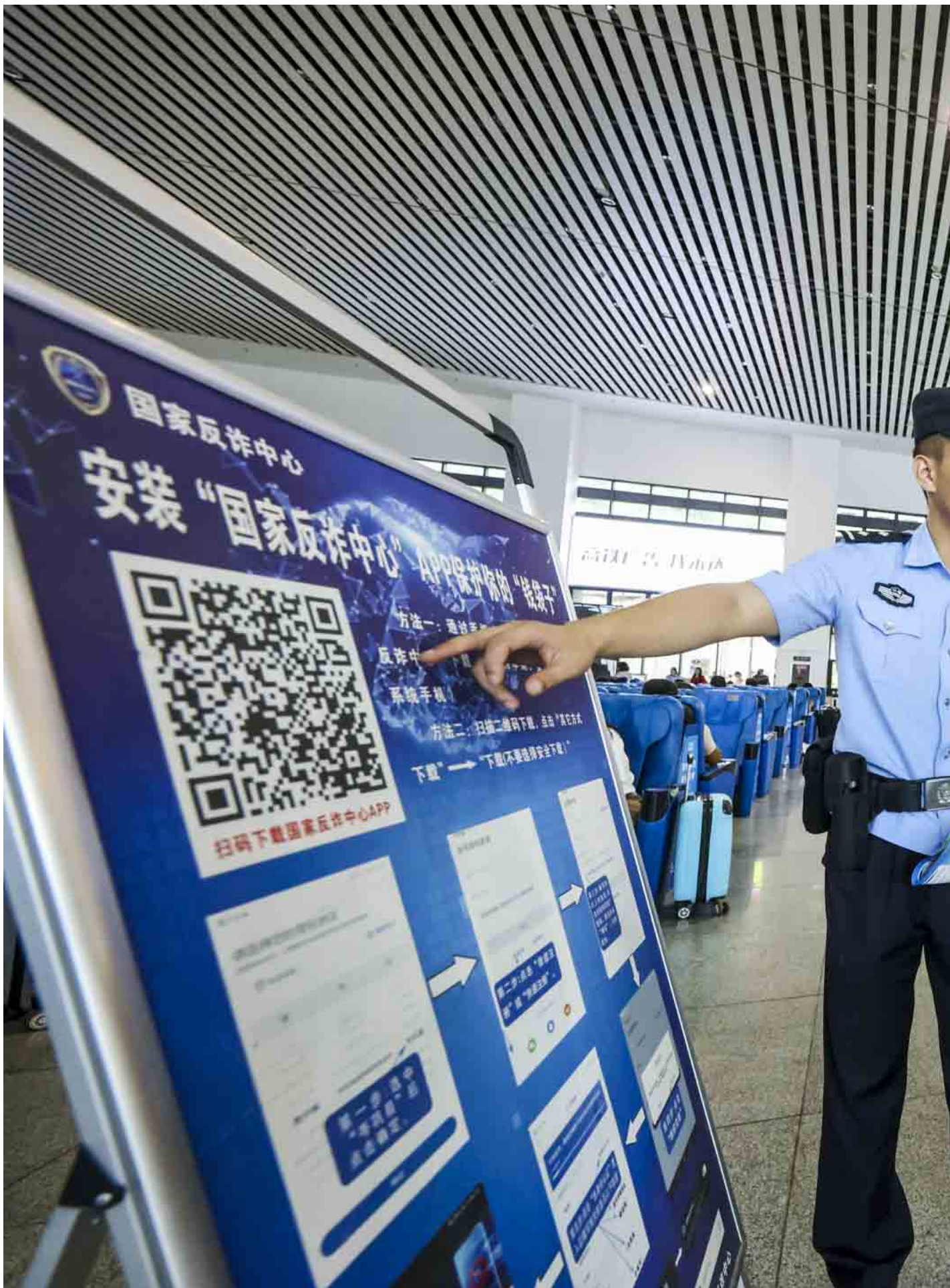
2023年8月24日，中国贵州，铁路警察引导乘客下载“反诈APP”。

“银行和我说，只是市解除了涉案名单，还要经过省，再到更高一层的公安部审批。我觉得这种解释在敷衍我，在拖我的时间。”为了催促工作人员，王均已经习惯了“卖惨”，诉说自己的生活有多难困，“他们这些领固定工资吃皇粮的根本不在乎我们的死活。”