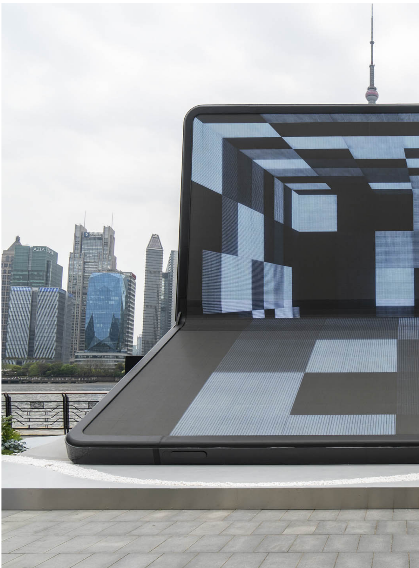
2023年4月11日，中国上海，人们走过在外滩的手机。

吴幽犹豫了一会儿，接著就发现，自己的银行卡被冻结了。理由是：有帮人洗钱的嫌疑。她强烈疑惑，自己什么都没干，怎么就被审判为帮人洗钱了？