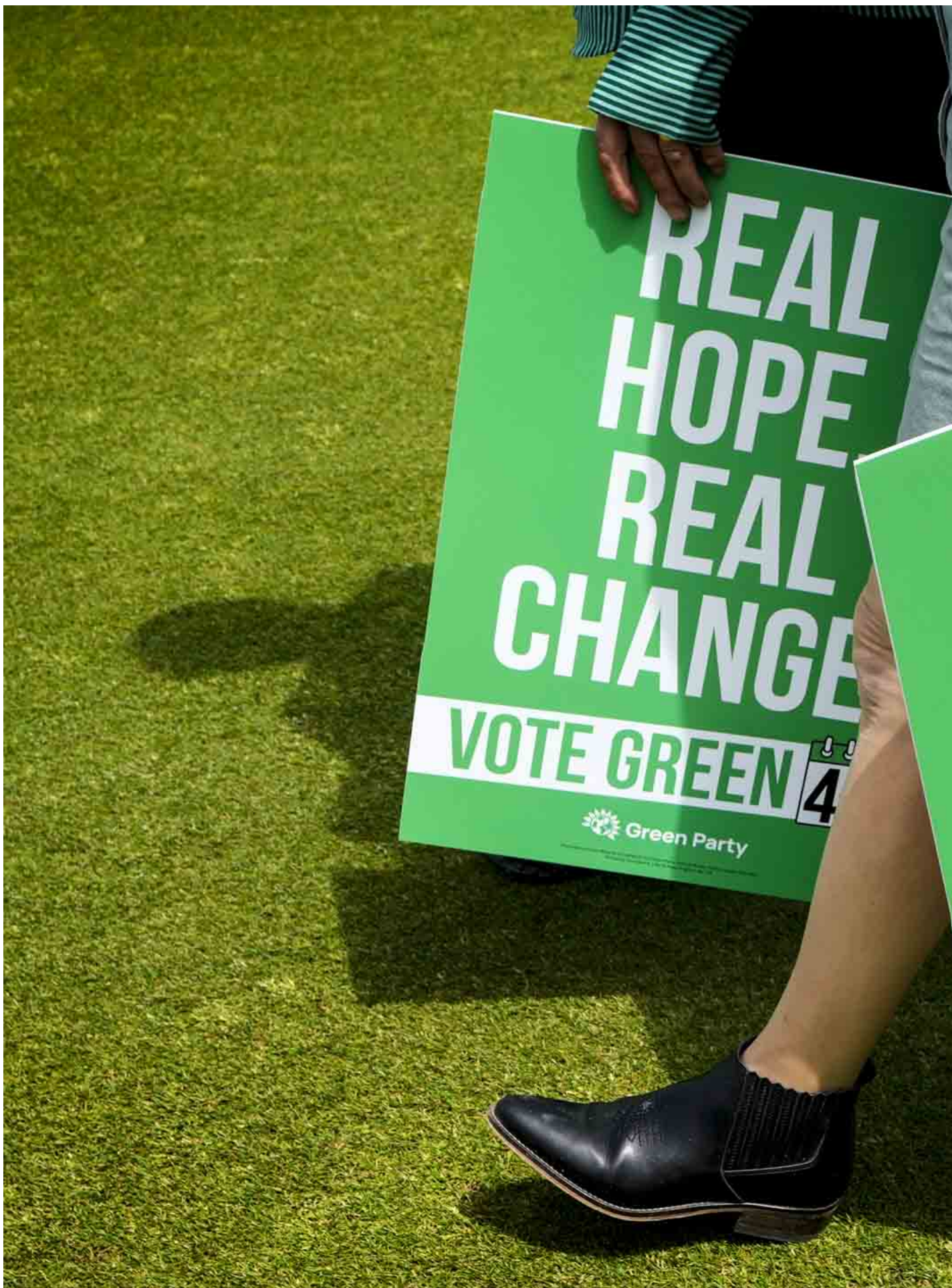
2024年6月12日，英国东索塞克斯郡 East Sussex 举行的大选宣言发布会，绿党支持者上手持标语牌。

韦夫尼谷所在的中修福（Mid Suffolk）议会是全国第一个绿党多数议会，禧福议会的绿党议员也非常多。所以我们在这两个地方都有明显的基础，许多人已经投票给了绿党。我在那里敲了许多人的门，很多人一辈子都在投保守党，但他们现在说“我不能投保守党的票了”，而我们为他们提供了一个真正的替代方案。