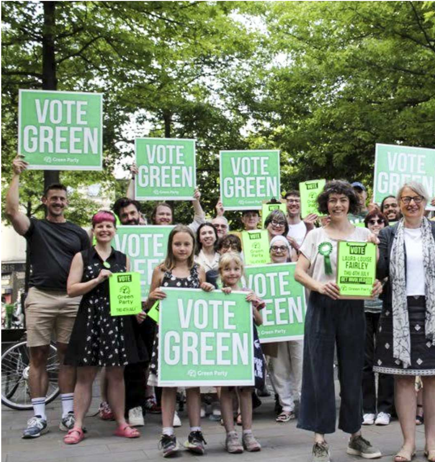
Natalie Bennett 与绿党候选人。

另外，我也正和各种各样的专业机构沟通，希望为香港人扫清障碍，让他们有能力利用自己的专业技能。