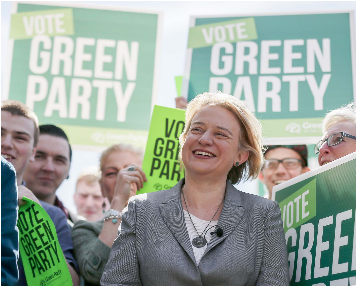
2015年4月26日，绿党领袖 Natalie Bennett 在英格兰北部利物浦的一次竞选活动中向支持者发表讲话。

英国将于本周四（7月4日）举行大选，届时下议院的全部650个席位都将改选，保守党的14年执政也很可能告终。我们此前已刊出关于英国政经、民生政策的懒人包与梳理现况的数洞栏目，请 按此 阅读“2024 英国大选”专题系列。端也推出了免费的英国大选新闻信，请 按此 订阅。