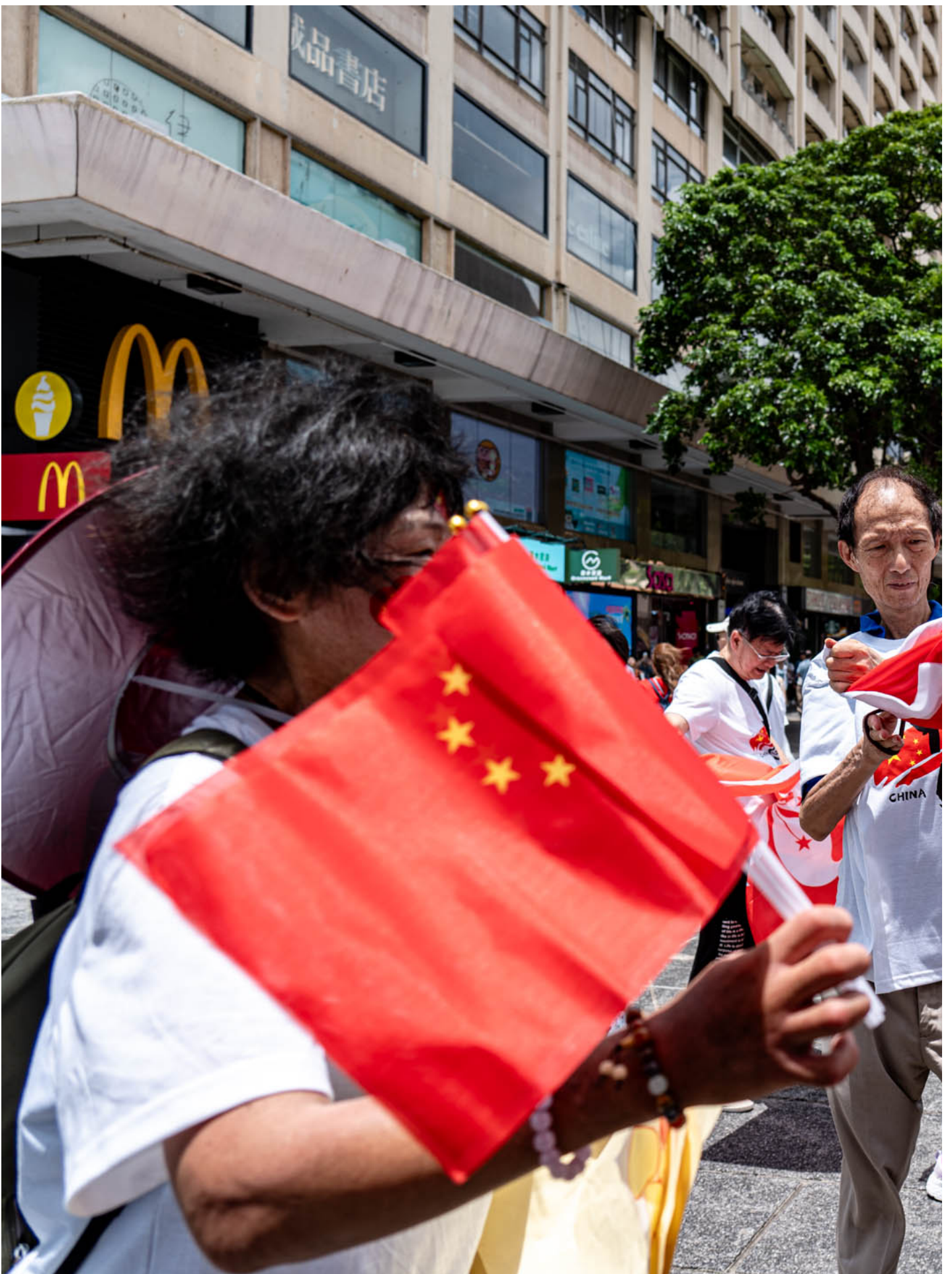
2024年7月1日，有市民在尖沙咀天星码头外挥动国旗与区旗，庆祝回归27周年。

启动礼的另一边，香港梅兴同乡联谊会十多人身穿鲜红色衣服，背著维港举起国旗高唱，又向巡游中的船只挥动国旗。成员袁女士从大陆来港结婚18年，一开始便对记者道“我们大陆过来的，通通都是爱国爱港的”，又说“国家的什么，我们都支持”，也反问记者是否“爱国爱港”，怕报导引来攻击。