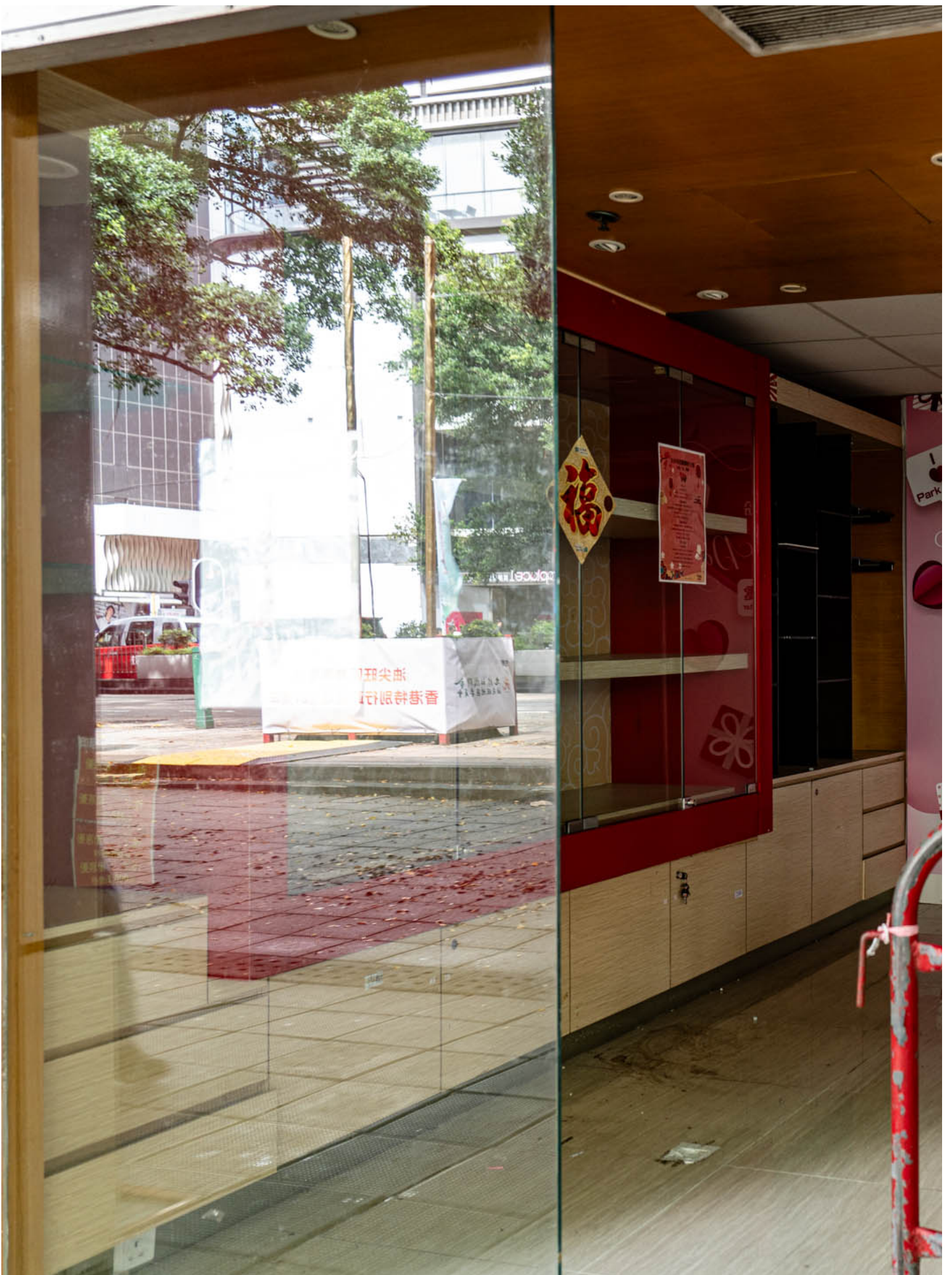
2024年7月1日，尖沙咀栢丽购物大道出现了不少空置的店舖，人烟稀少。

身边人近年纷纷移民，两人也想过离开，但因为父母在香港，他们也想不到理想的移民地方，对他方重新生活仍抱有怀疑，便打消念头。作为留下的人，Q 小姐说要“若无其事”，“这样的情况下，选择最简单的生活。”K 先生说，“我们纯粹行一行街就已经很开心了。”