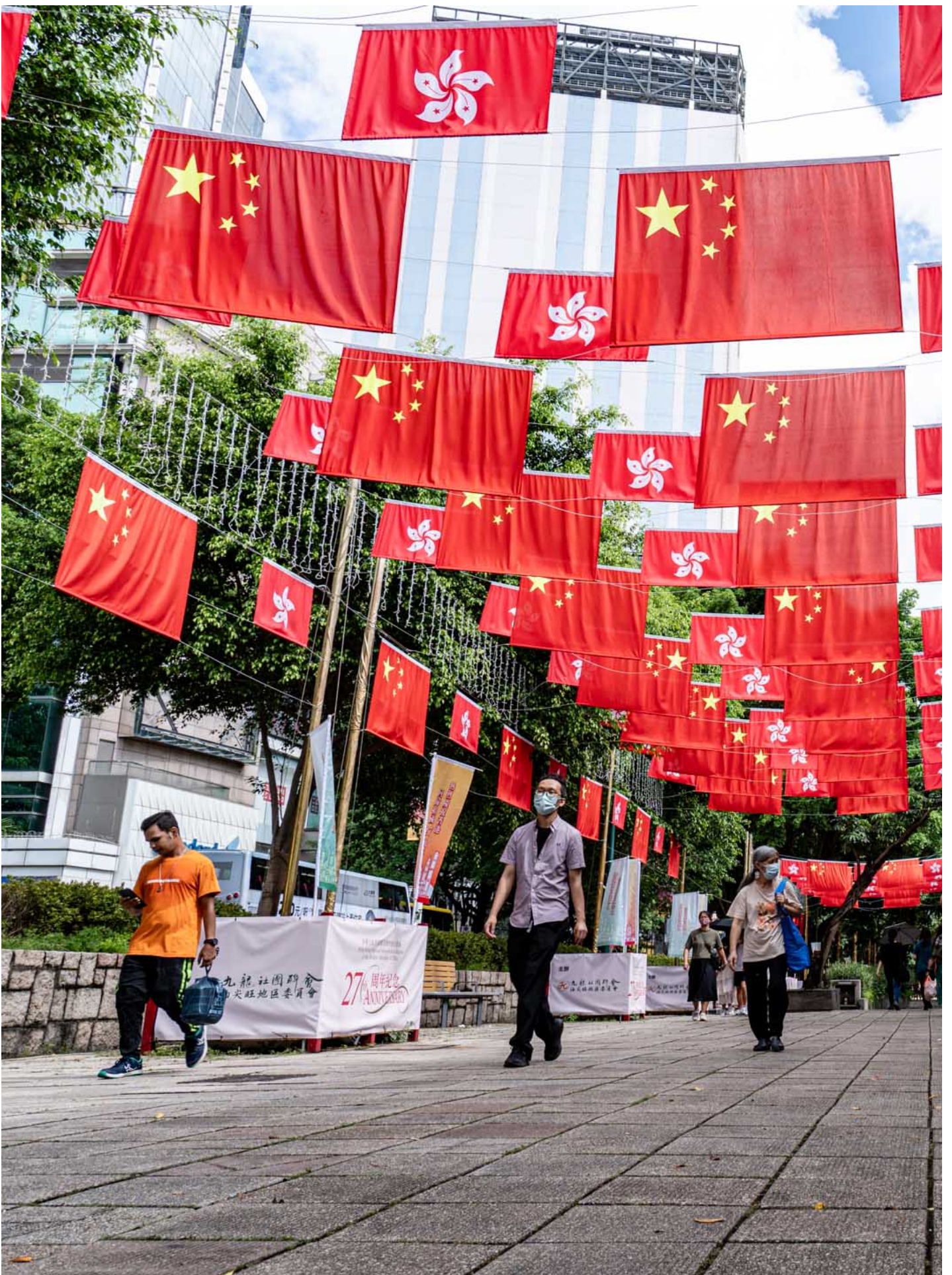
2024年7月1日，尖沙咀栢麗購物大道掛上了國旗、區旗。