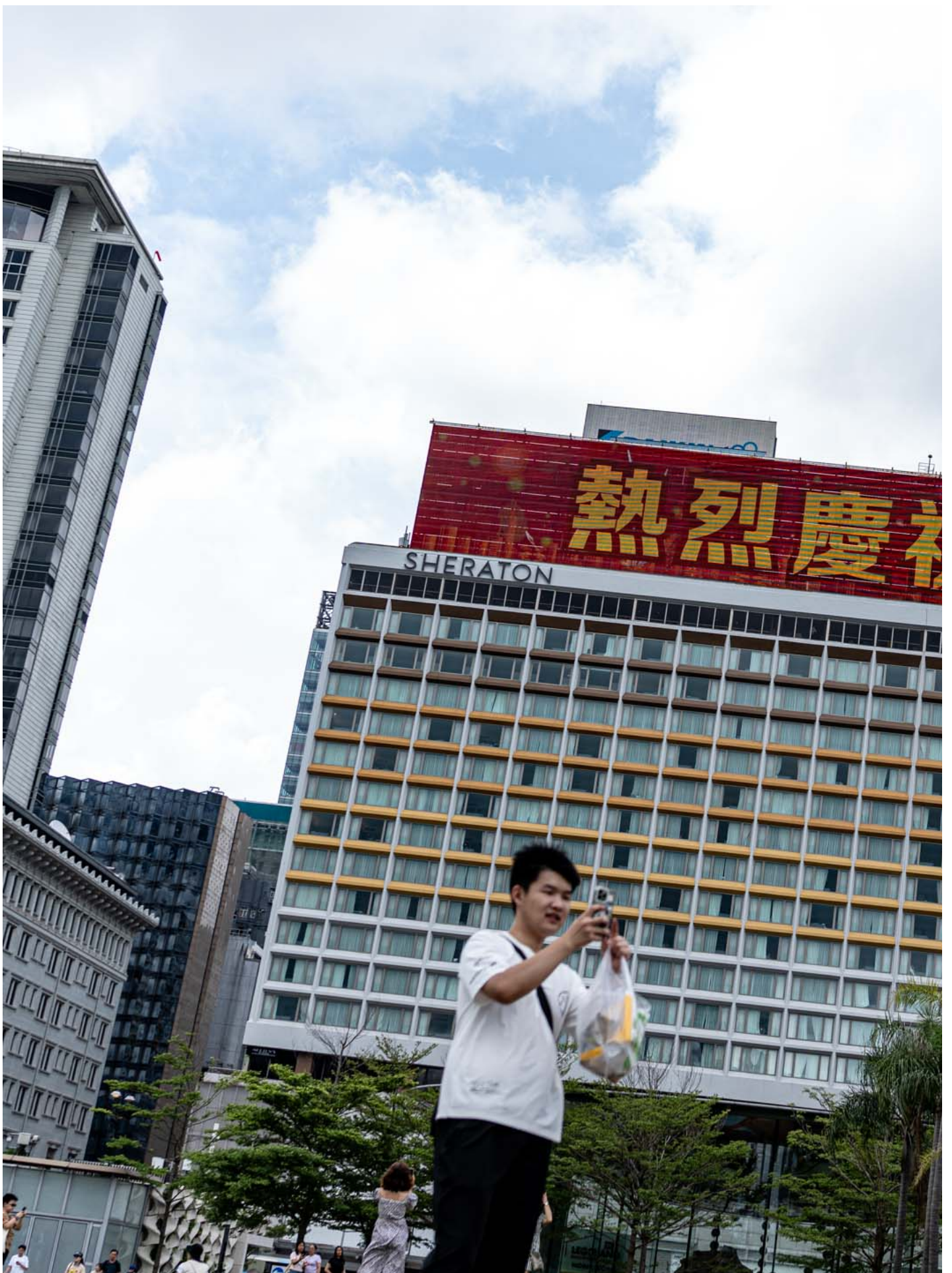
2024年7月1日，尖沙咀，有大厦显示屏上写有庆祝回归27周年的字句。

在星光大道，65岁、从中山来的连先生趁旅行团集合前在维港前自拍。他这次单独报名旅行团，经刚开通的深中通道来港，车程只是一小时。一天游包交通、不包午餐，团费不到100元人民币。第一次来港，他觉得维港等景点跟电视上看见的差不多，“祖国繁荣，香港就更加繁荣。”他也认为以往的社会运动是“个别人在滋事一下，没有问题，他当然制止得到你，香港政府这么大”，对香港没有负面形象。他再强调，“那些人是极之少的。”