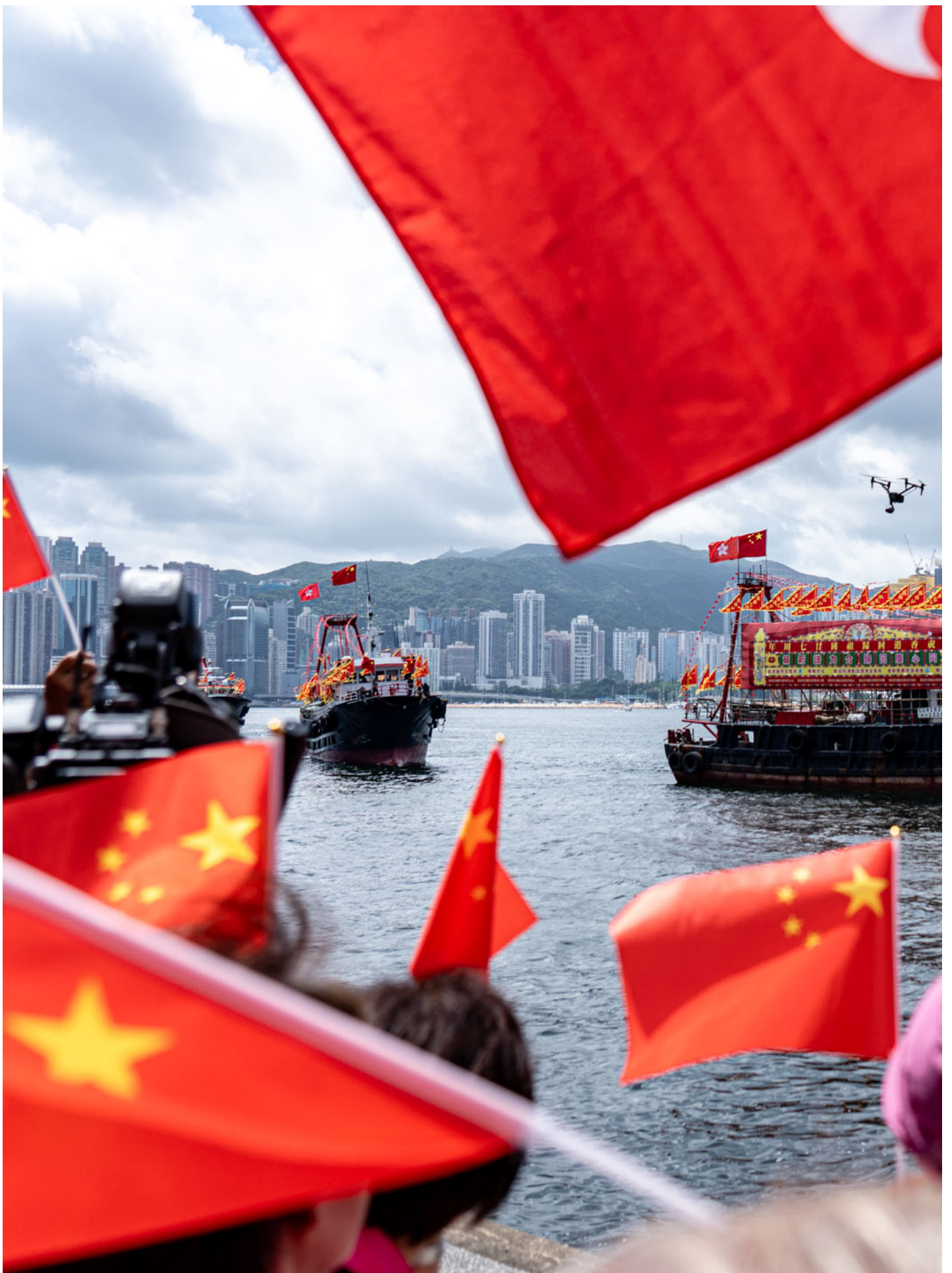
2024年7月1日，香港渔民团体联会在尖沙咀文化中心举办海上渔船巡游启船礼，庆祝回归27周年。

69岁的周女士坐楼梯上手持小风扇吹风，是参加者之一。她告诉记者自己不是渔民，正职是保安，而今天是跟随大埔区的老人中心报团而来。旅游团包免费接送和午餐，今早8时半从大埔坐旅游巴出发，她为此特意请假参加“开心一下”。她说香港现在有点起色，不像从前“黑暴搞到乱糟糟”，便开心些。