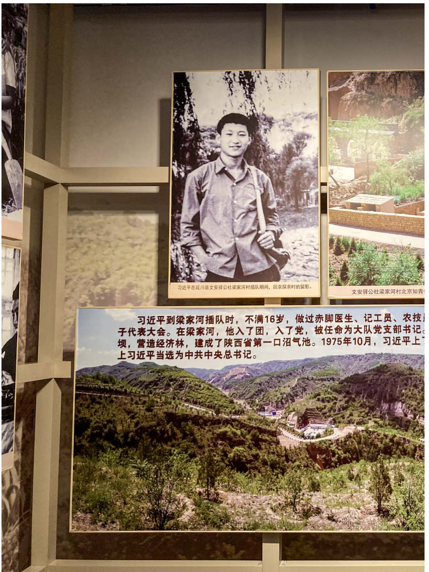
延安北京知青博物馆有关习近平知青生活的介绍。

直至今日，虽然官方否定文革，但未对文革期间的上山下乡有正式的历史评价，不过这个博物馆显然持正面评价。到结束语，我们大概才看懂这个2016年建成的知青博物馆的深意：