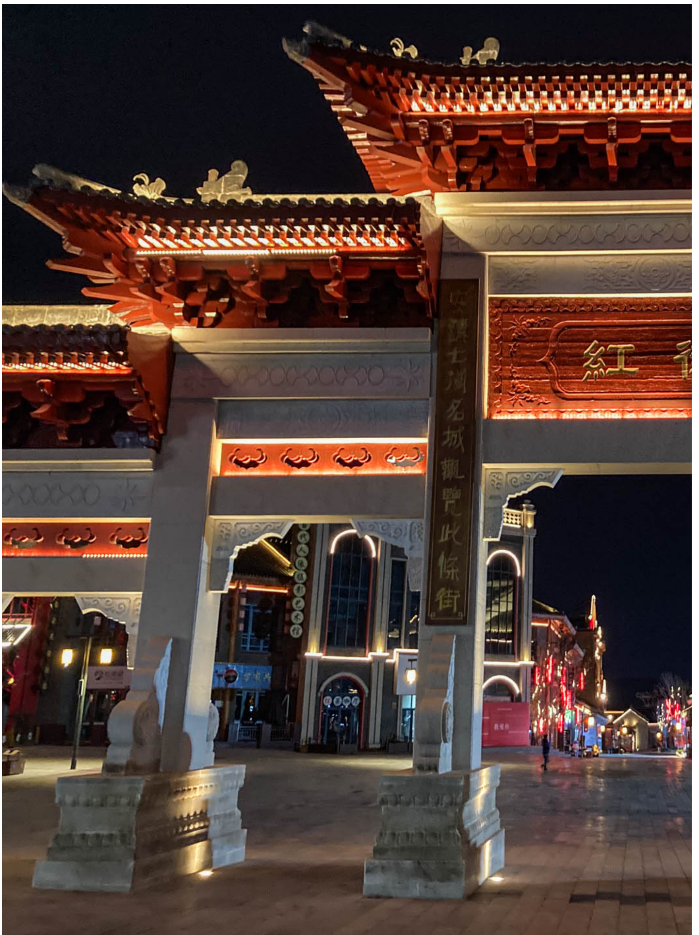
延安红街。