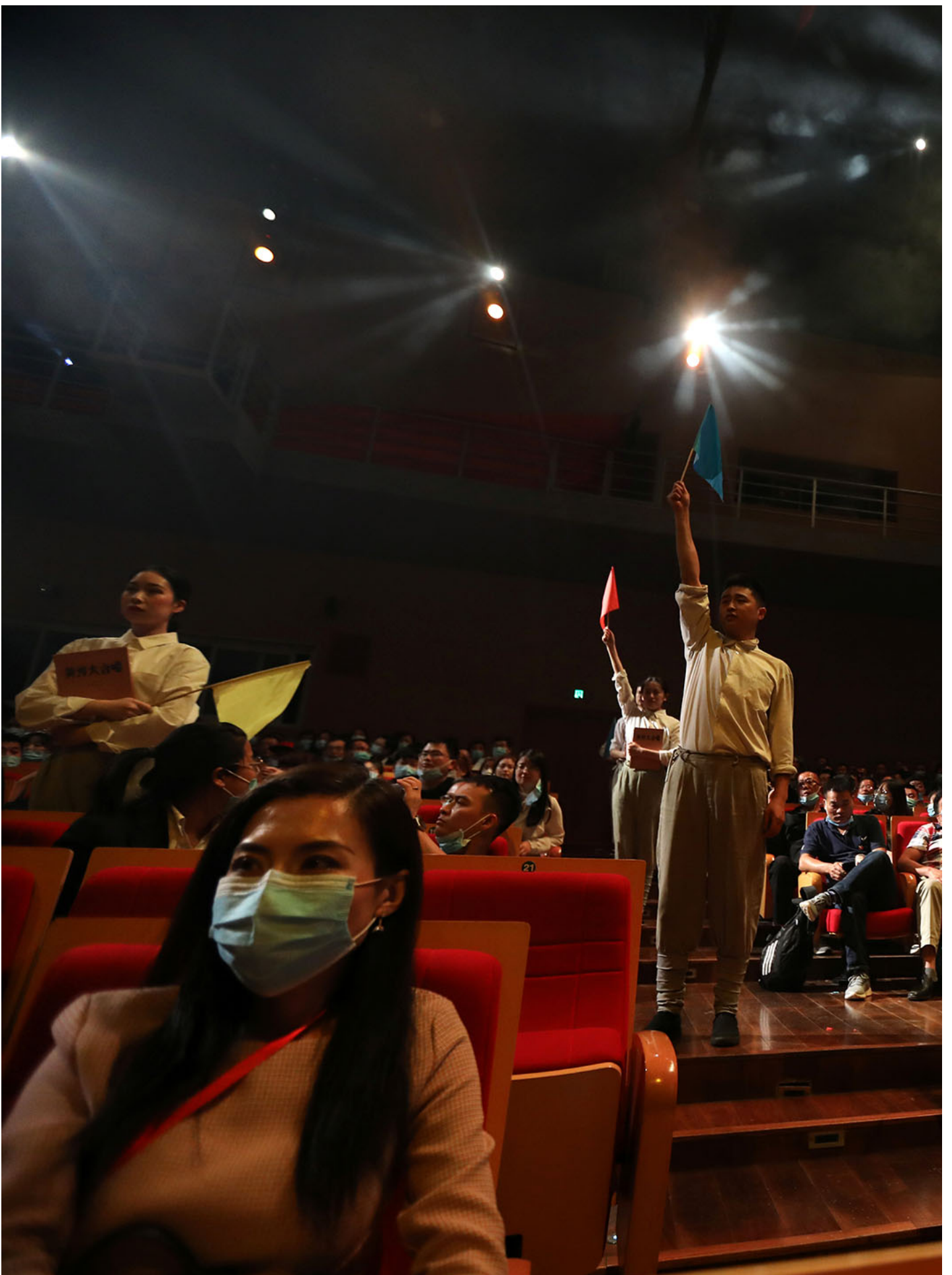
2021年5月10日，中国延安，中国共产党成立100周年纪念馆有关中国革命历史的演出。