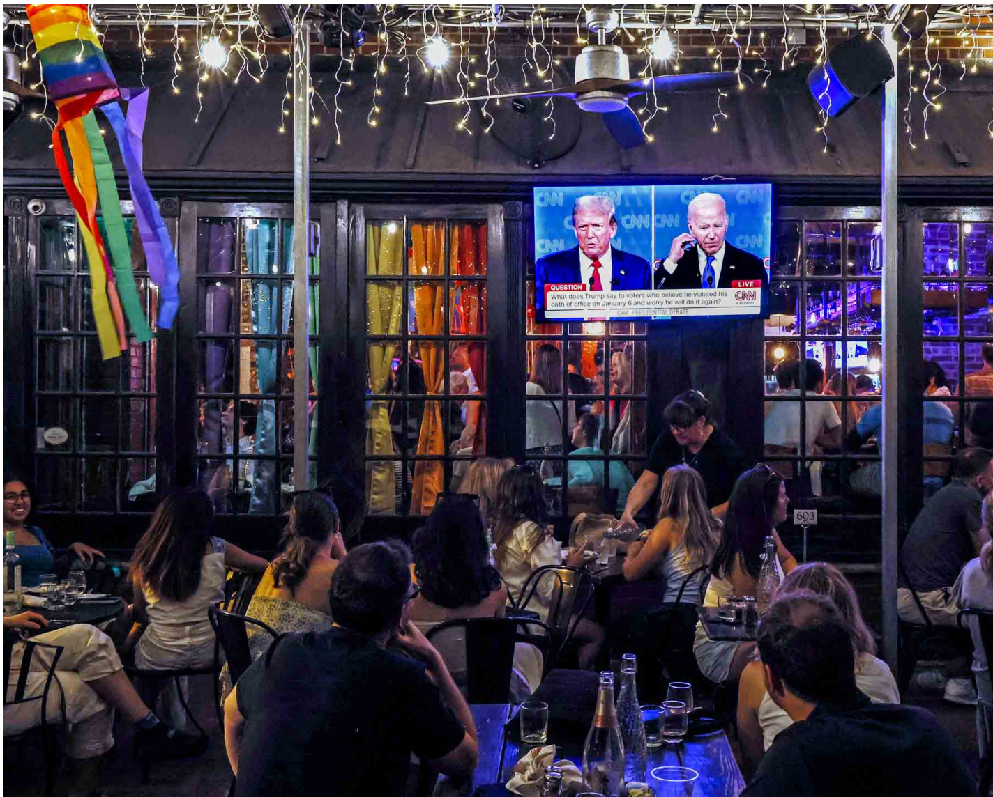
2024年6月27日，美国华盛顿，人们在派对上观看美国总统拜登和共和党总统候选人特朗普的CNN总统辩论。

在本次辩论的历史性时刻，81岁的现任美国总统与78岁的前任美国总统开始争辩谁的高尔夫技术更高超。