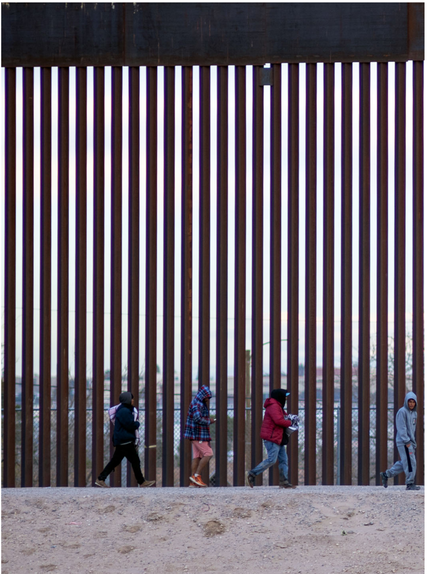
2024年1月30日，尽管采取了加强的安全措施，移民仍试图穿越墨西哥与美国的边境。