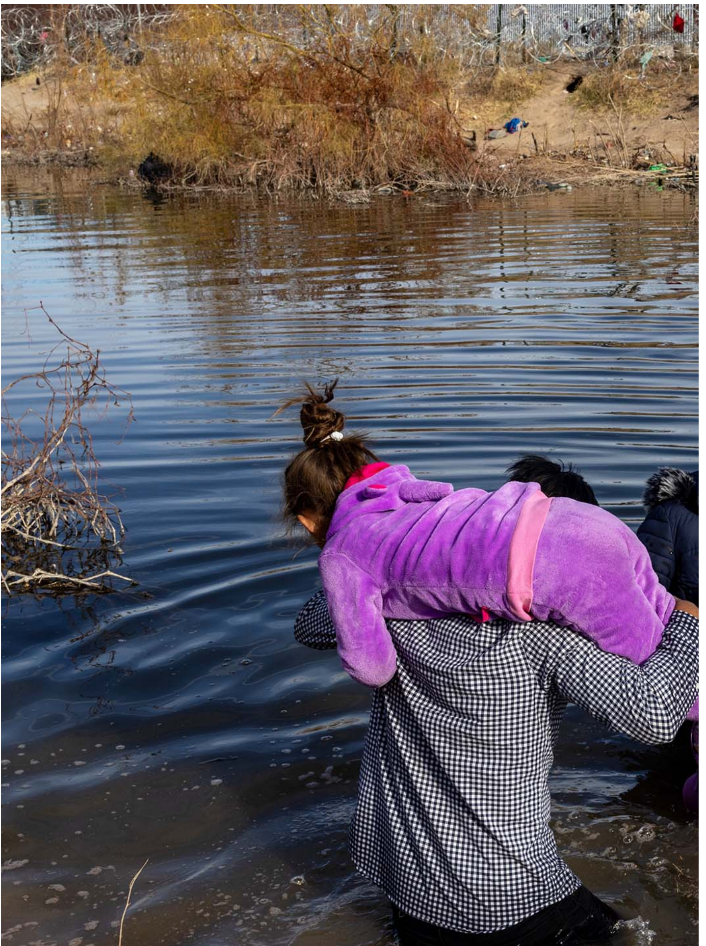
2024年1月30日，墨西哥华雷斯城，尽管采取了加强的安全措施，移民仍试图穿越墨西哥与美国的边境。

事实上，中美一直都有就遣返非法移民的问题上合作，但因2022年时任众议院议长佩洛西访台，令中美外交关系紧张，即时中断多项合作。至今年5月，中国驻美使馆发言人在回应记者提问时表示，中方对与美就非法移民遣返问题合作持开放态度。美联社形容，两国已悄然恢复遣返合作。