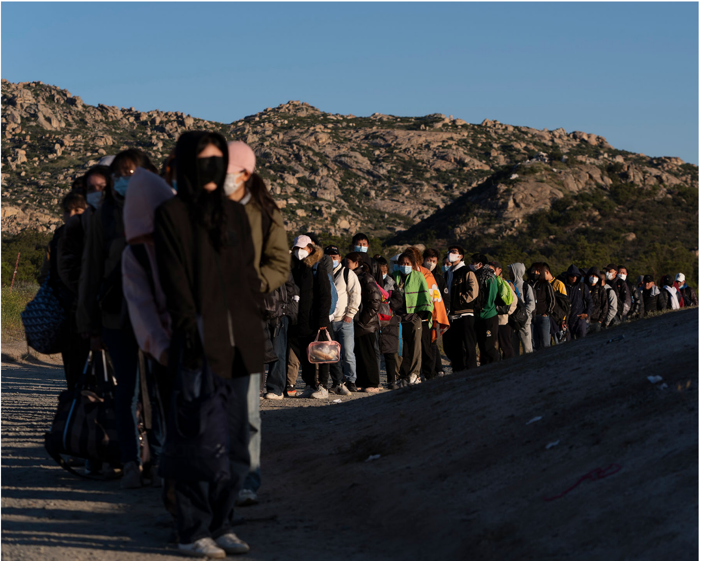
2024年5月8日，美国与墨西哥的边境，加州贾库巴温泉，华人难民在附近越过墨西哥边境。

6月4日，美国总统拜登发布一道关于新美墨边境的庇护禁令，以熔断机制阻止大量移民涌入。