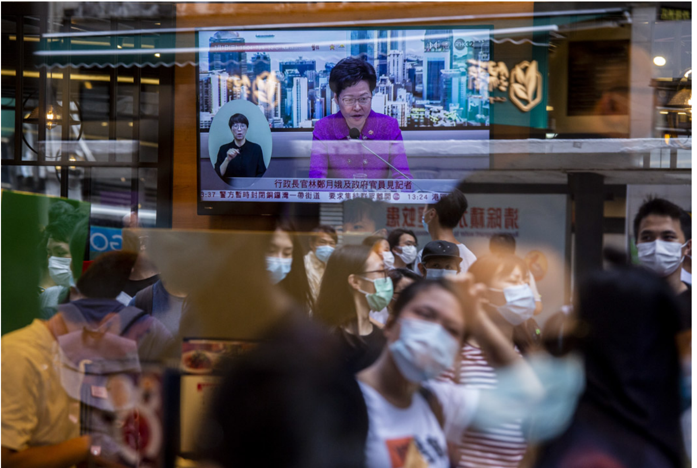
2020年7月1日，湾仔一间餐厅电视播放林郑月娥《港区国安法》的记者会。

李立峰：我极少上去看，所以不会很能 comment 到。不过一个平台越来越多人用的时候，它的内容会变化，它一开始吸引了某一班人进去，因此反映了那一班人的特质，它大众化的时候，可能变成另外一个人。那样东西是 dynamic 的，它自己本身那个 platform 的 architecture，比如说它的 algorithm（演算法）是怎样的，会令到某些东西比较有可能发生，但是同时间社会形势也会 driving 它。就像2019年6月前的连登，和那半年的连登，和现在的连登，是三件事，随著有什么人进去看东西，出来的效果就已经会很不同。