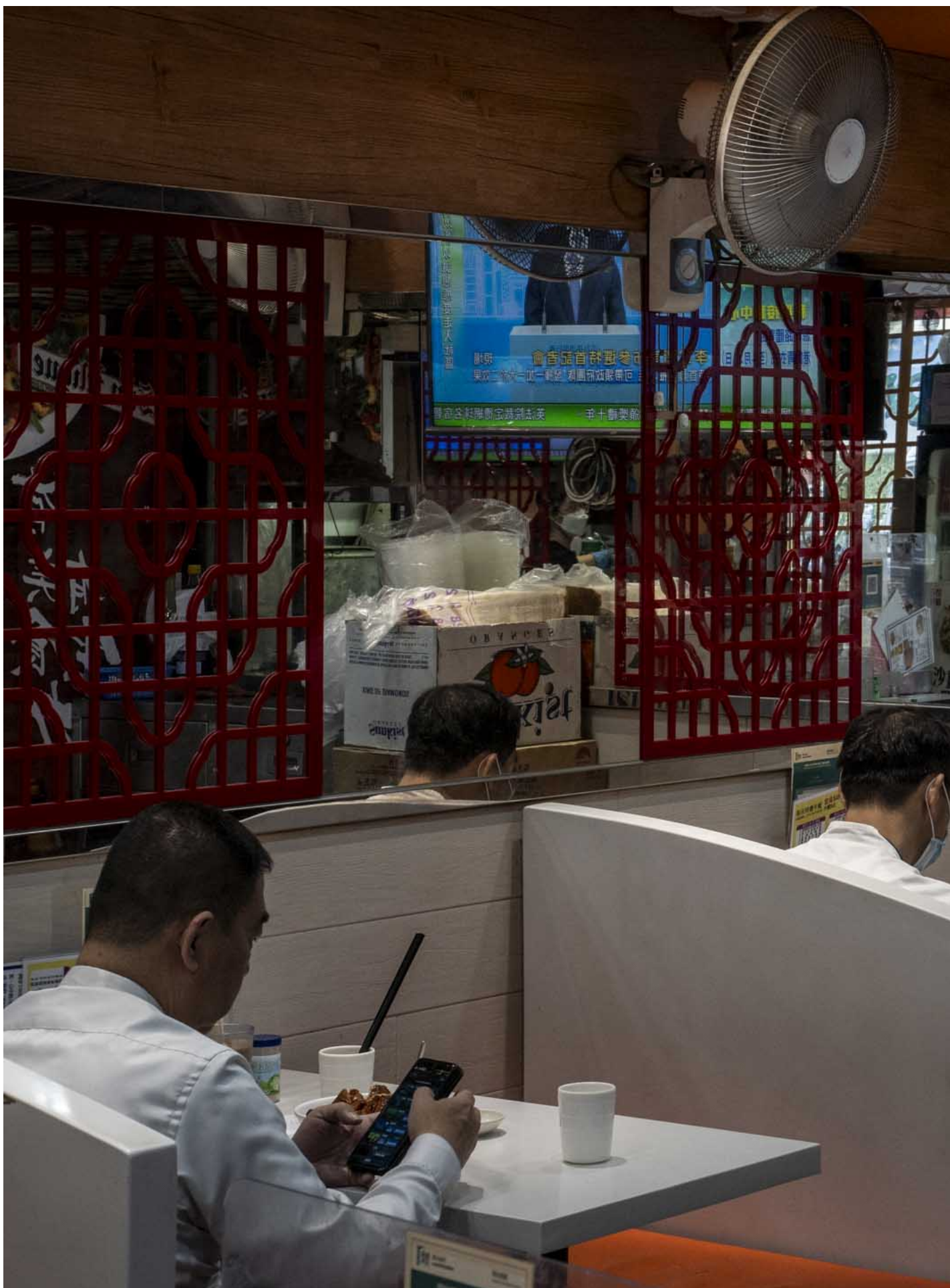
2022年4月9日，电视新闻直播李家超宣布参选香港行政长官。

还有就是真的要看那个现象对一般香港市民影响有多大，或者一般香港市民接触到多少。骂 CCTV 是十几年积累下来的东西，所以数字上也能反映到。但是 Cable 和 NOW 那些内部转变，始终不是很关注新闻媒介的人未必很认知到这些东西。所以在包围的调查里面，数据未必反映到这些转变。