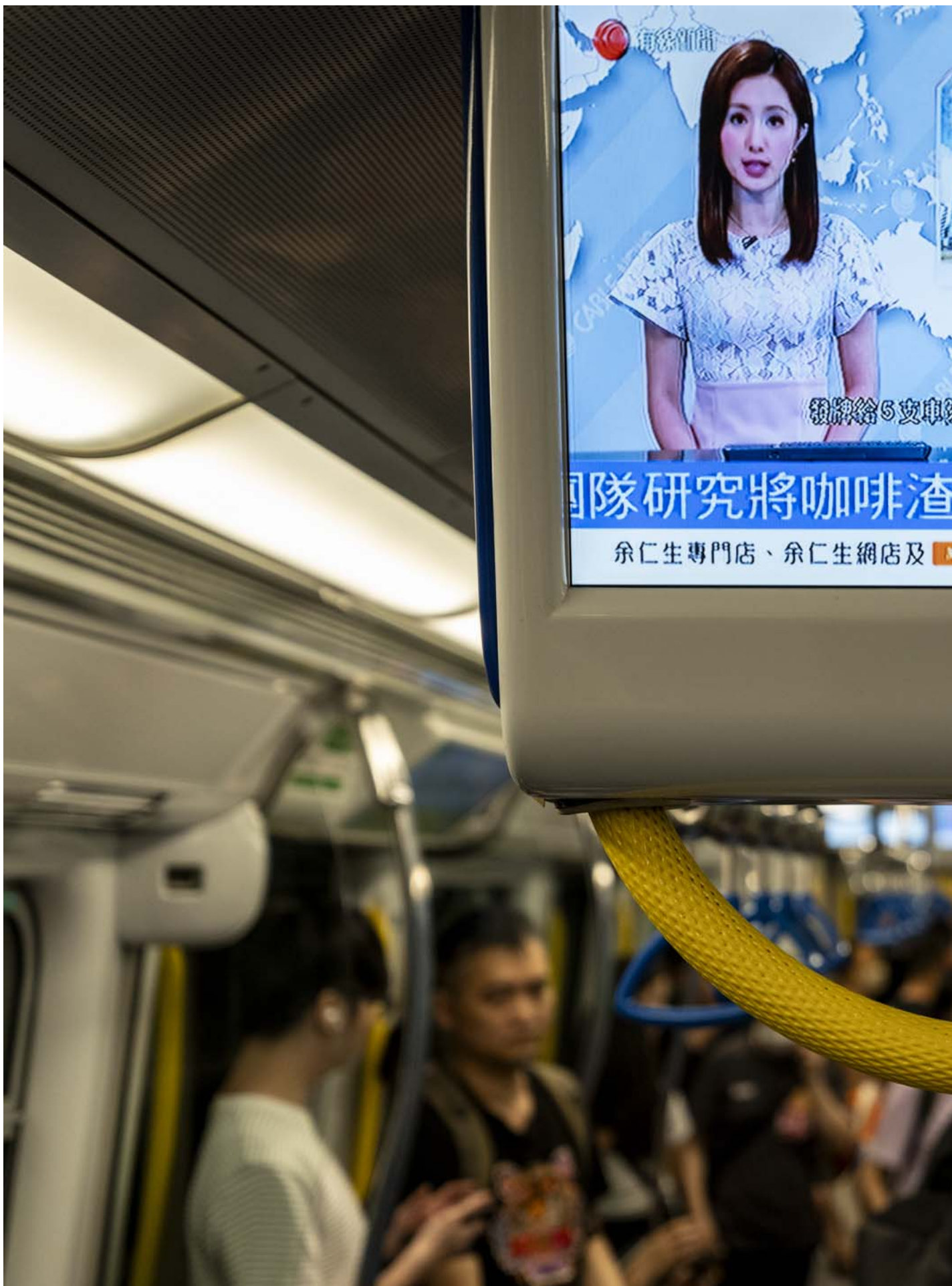
2024年6月22日，港铁的屏幕上播放有线新闻的片段。

但是，看不看，看得多还是少，和你觉得它是不是真的可信，真的未必有很必然的关系。news avoidance 都有很多可能性，固然香港过去几年大家会觉得和政治环境转变有关，但也有很多人是 driven by 其他东西的——香港是累的，不一定是政治的，可以是经济、社会，很多东西，总之顶不住。过去一两年，也真的没有很能够 involve 到大家的一些社会议题。