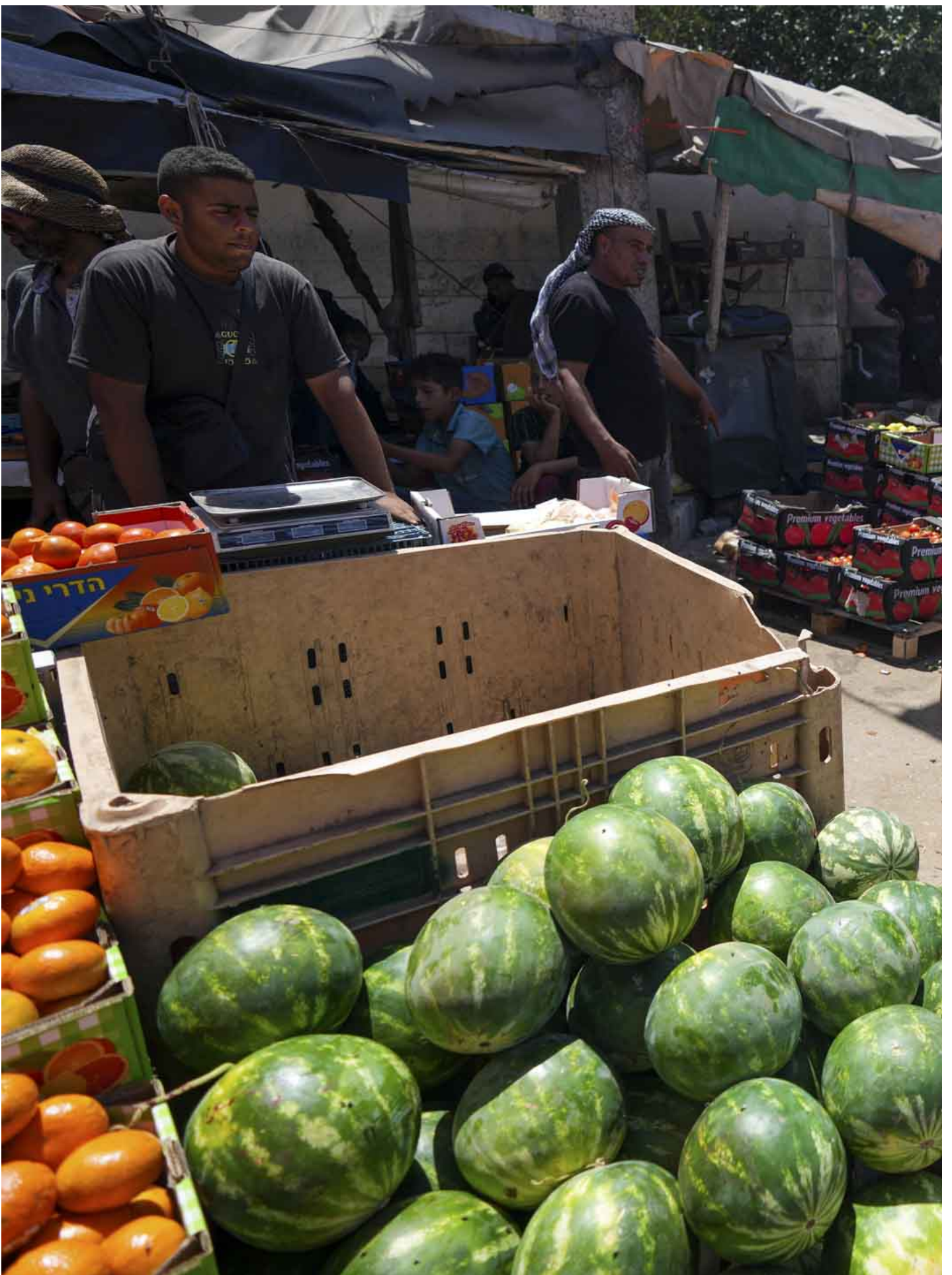
2024年5月24日，以军在加沙南部拉法（Rafah）进行军事行动前的市场。

我很讨厌别人问我“想吃什么？”，因为如果可以选的话，我早餐肯定会吃百里香和奶酪，午餐吃炸土豆或番茄，晚餐再跟早餐一样。我还想吃肉、鱼和鸡，这阵子，我常常怀念9年前经常去的餐馆……但这几个月来，除了罐头，我都没有吃过别的食物。“我们今天有什么能吃的？”这个问题很难回答，但其实每个人都知道答案，因为不是小扁豆就是豌豆，全都是罐装食品。