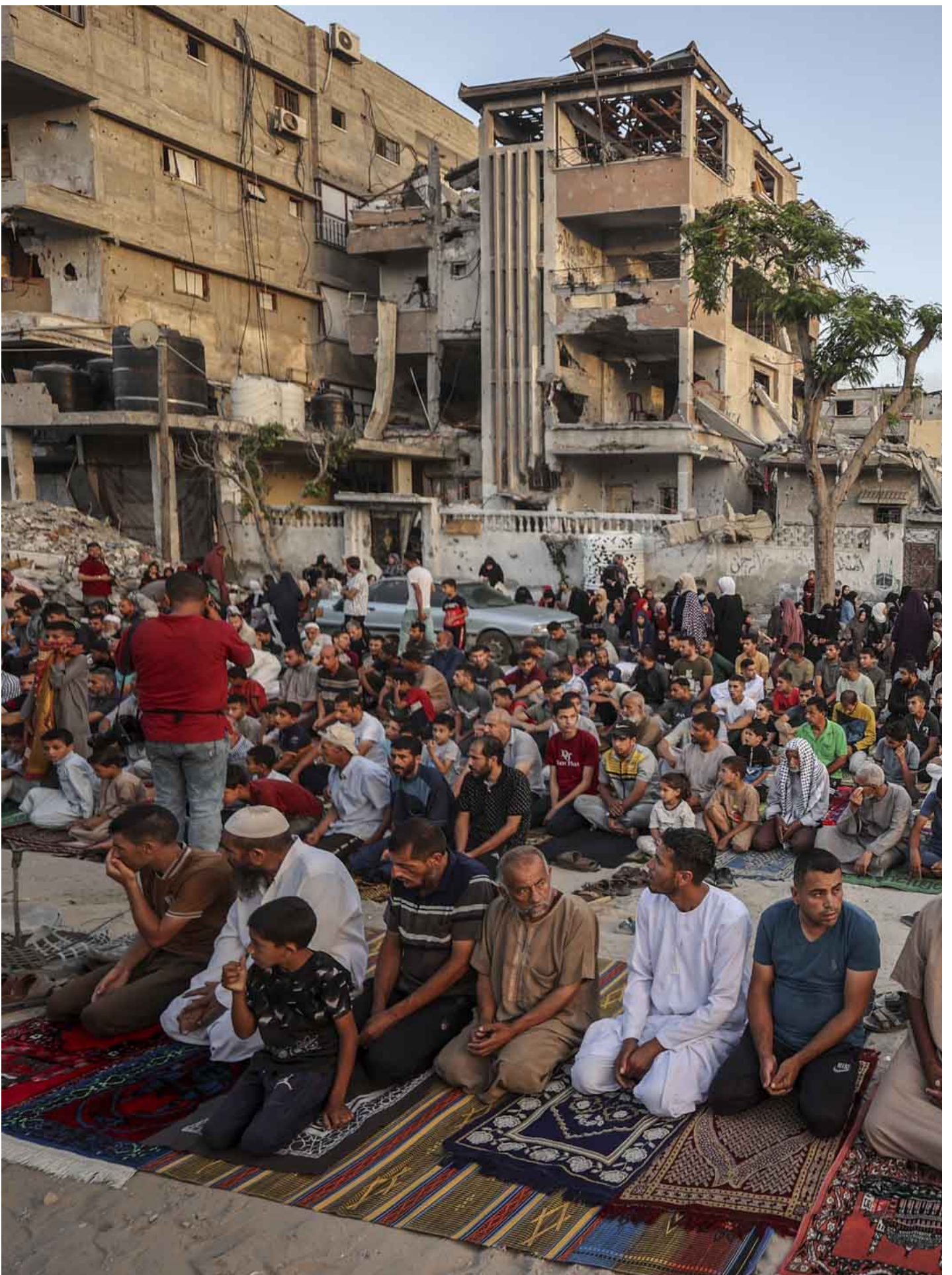
2024年6月16日，以色列对加沙汗尤尼斯的袭击和封锁仍在继续，巴勒斯坦人聚集在被摧毁的建筑物废墟中进行宰牲节祈祷。