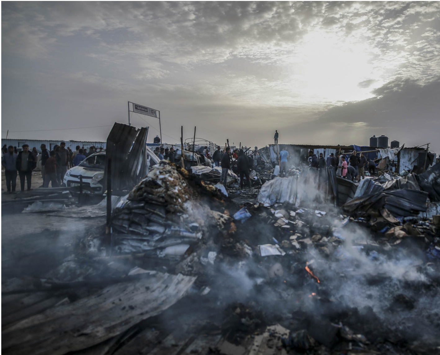
2024年5月27日，以色列空袭加沙后造成一片荒芜，大量巴勒斯坦人流离失所。

“加沙没有未来了，现在和未来都被摧毁了。人们只剩下一个目标：在饥饿、轰炸和围困中生存。”