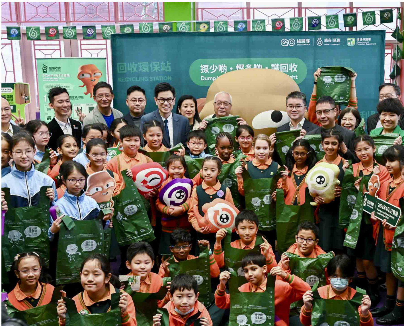
2024年1月16日，香港一个“垃圾征费”计划推广活动。