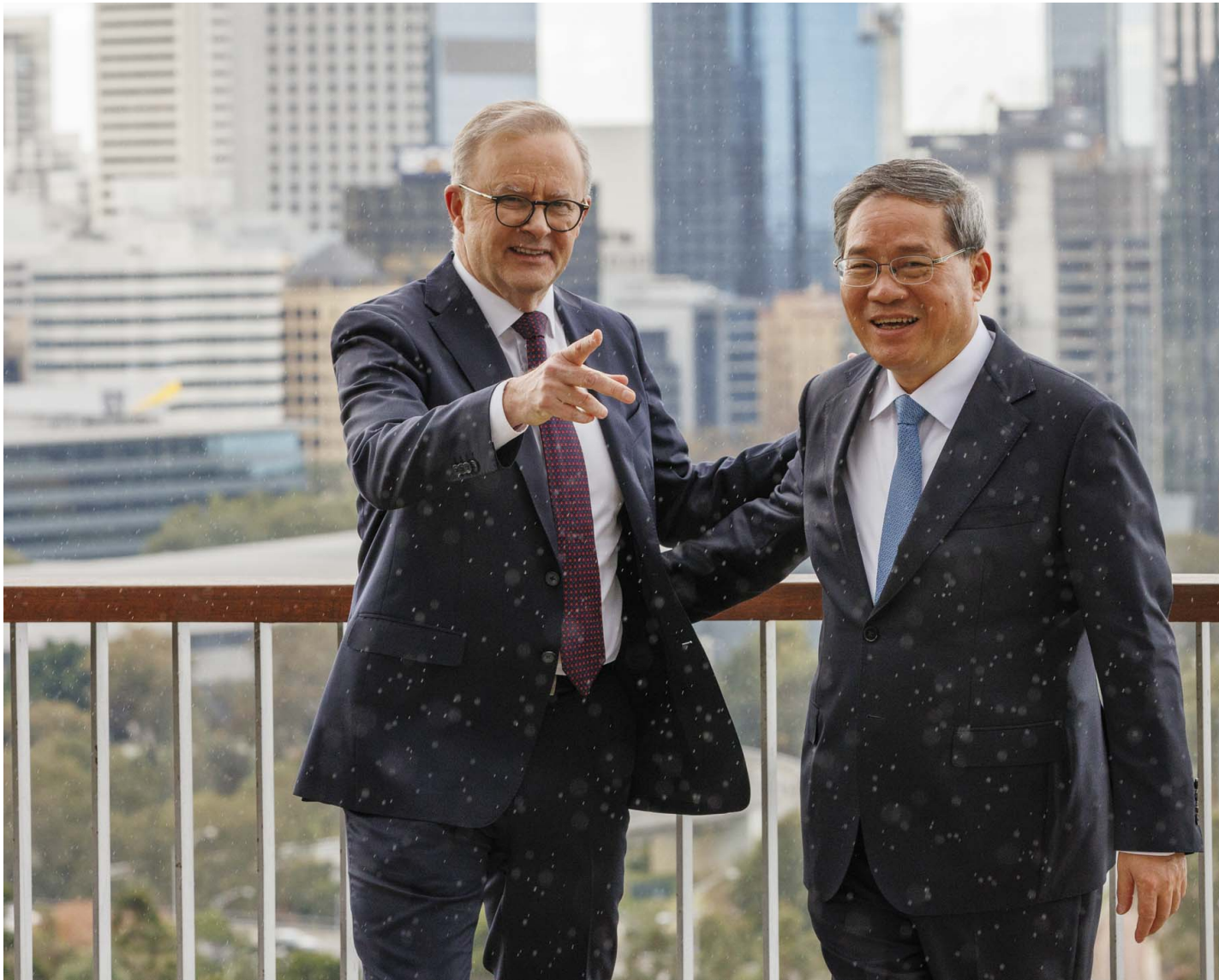
2024年6月18日，澳大利亚珀斯举行的澳中执行长圆桌会议之前，澳大利亚总理 Anthony Albanese 和中国总理李强在国王公园进行交谈。