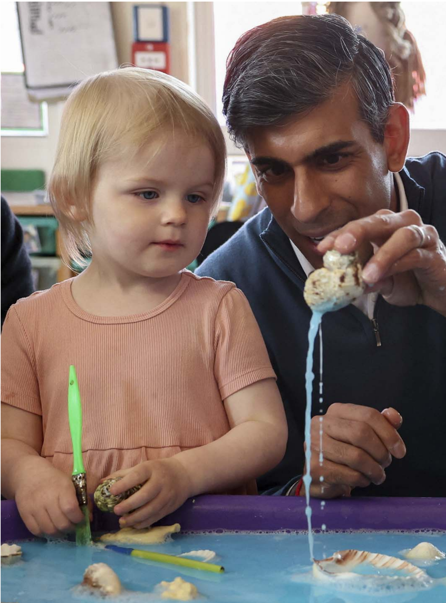
2024年6月7日，英國斯溫頓舉行的保守黨大選競選活動期間，英國首相辛偉誠(Rishi Sunak) 參觀 Imagination Childcare 兒童中心時與孩子們玩耍。

我覺得語言是最大的問題。我在香港是從事內地貿易相關的工作，不常接觸英文，要重新認識英國政局，天天看冗長的英文新聞，真的太困難了。現在我只看BBC，因為它更新得很快，報導也比較簡潔，可以讓我快速了解當天發生什麼事。現在我的心態也有頗大改變，退休以後，我好像懶散了許多，生活又沒太大問題，因此沒什麼誘因留意新聞。臉書和新聞軟件有通知，我就看一下，不會刻意每天留時間看新聞。