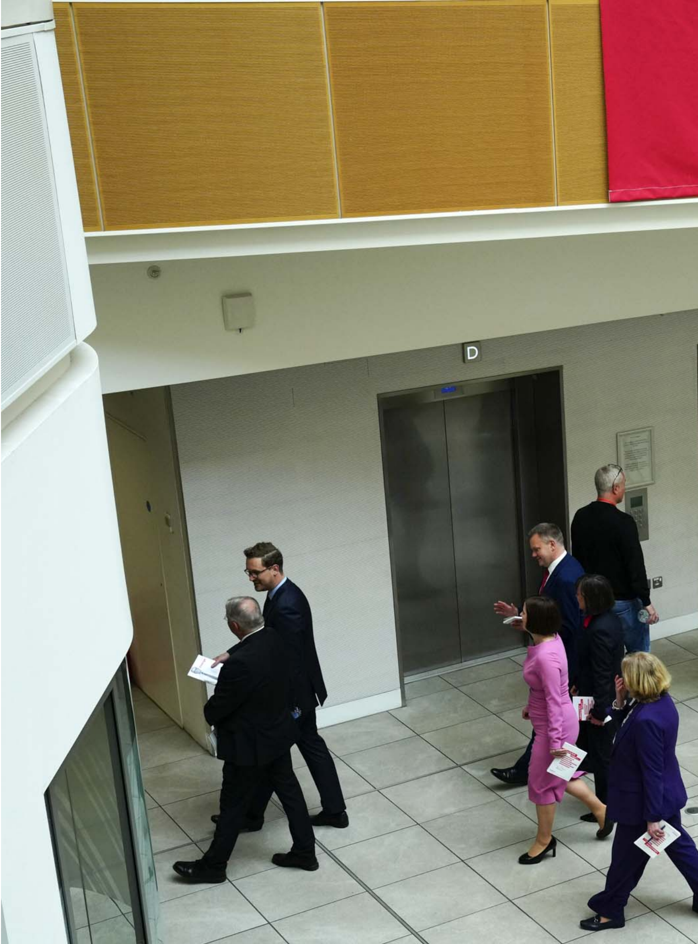
2024年6月13日，英國影子內閣成員抵達英國曼徹斯特發布工黨 2024 年大選宣言。

投票也是，不論在哪裏，我從來都沒想過不投票，但說不出為什麼。我一到18歲就登記做選民，每次都會投，就是很順理成章的，不是崇高地希望改變社會。我明白一票就只是一票，不能改變什麼，但我不會因此不投票，因為所有人都不投票，就不會有改變，頗弔詭的。