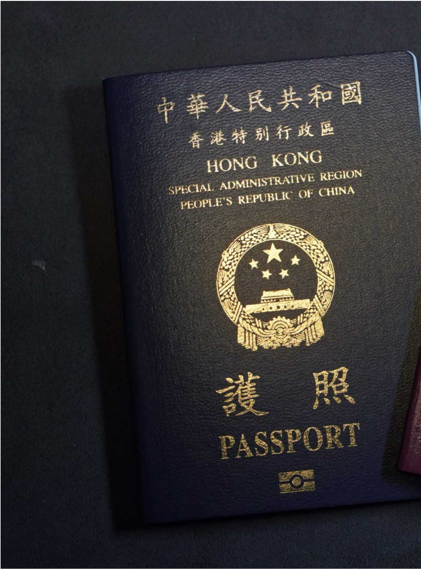
英國國民海外護照（BNO）及香港特區護照。

但大選……唉，真的很難選。我不覺得工黨是好的黨派，也沒有實際事例，只是印象不好，每次保守黨提議政策，工黨就會反對，我又不認同他們反對的原因，例如脫歐，我覺得不脫歐，英國經濟會更糟糕，BN(O)政策也應該不會出現。保守黨的話，我起碼認同它的核心價值，例如在俄烏戰爭和以巴衝突上，他們都是支持公義的一方，也會清晰地表態。但最大的原因還是BN(O)，在推行BN(O)政策上，他們確實貢獻不少。