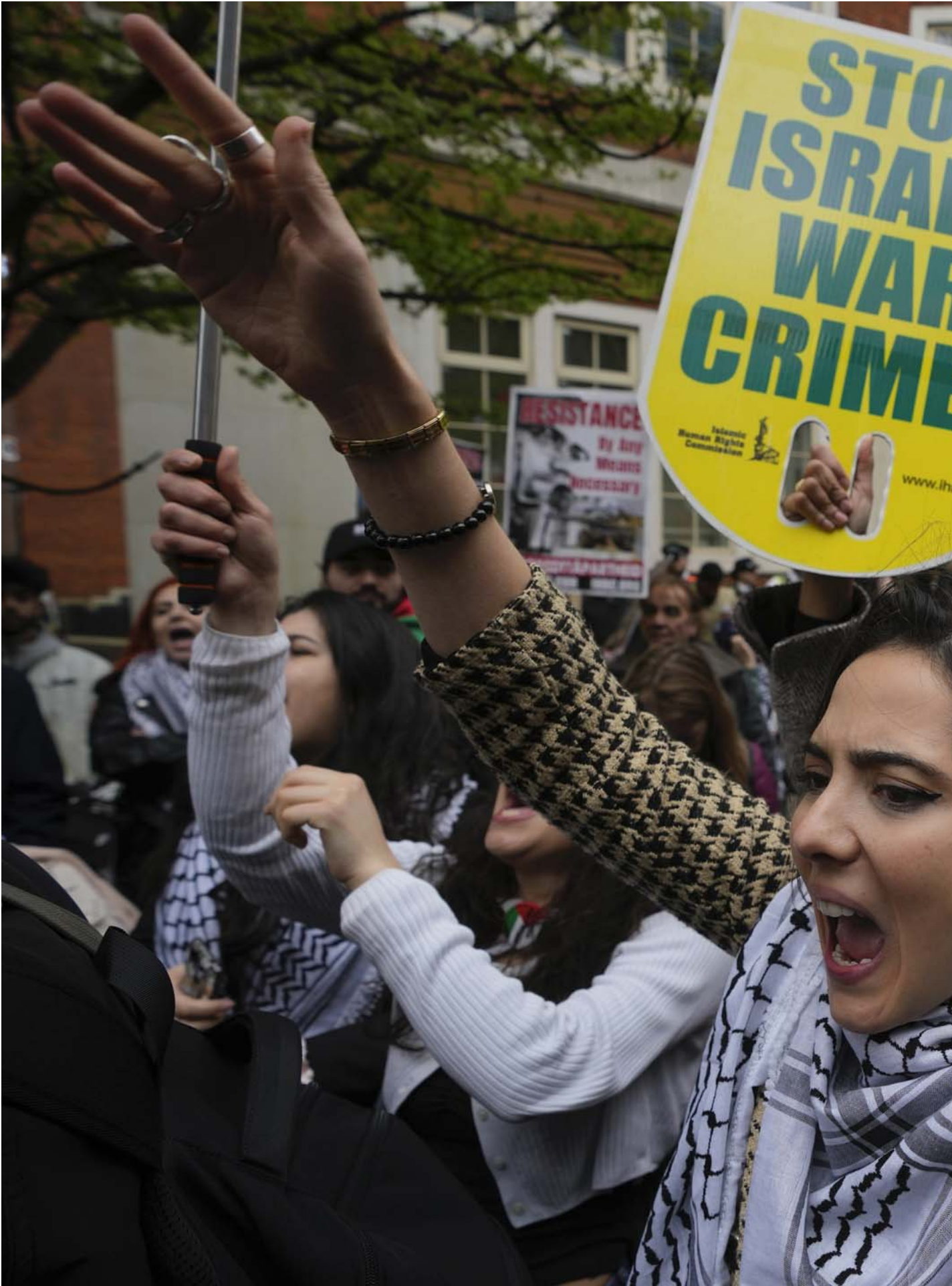
2024年4月5日，英國倫敦，親巴勒斯坦示威者在參加聖城日抗議。

不過情況再壞，英國政府都不會強推大部分人反對的政策。當時我們就是看見香港政府根本不願意和市民溝通，對政府完全失去希望，才決定離開的。