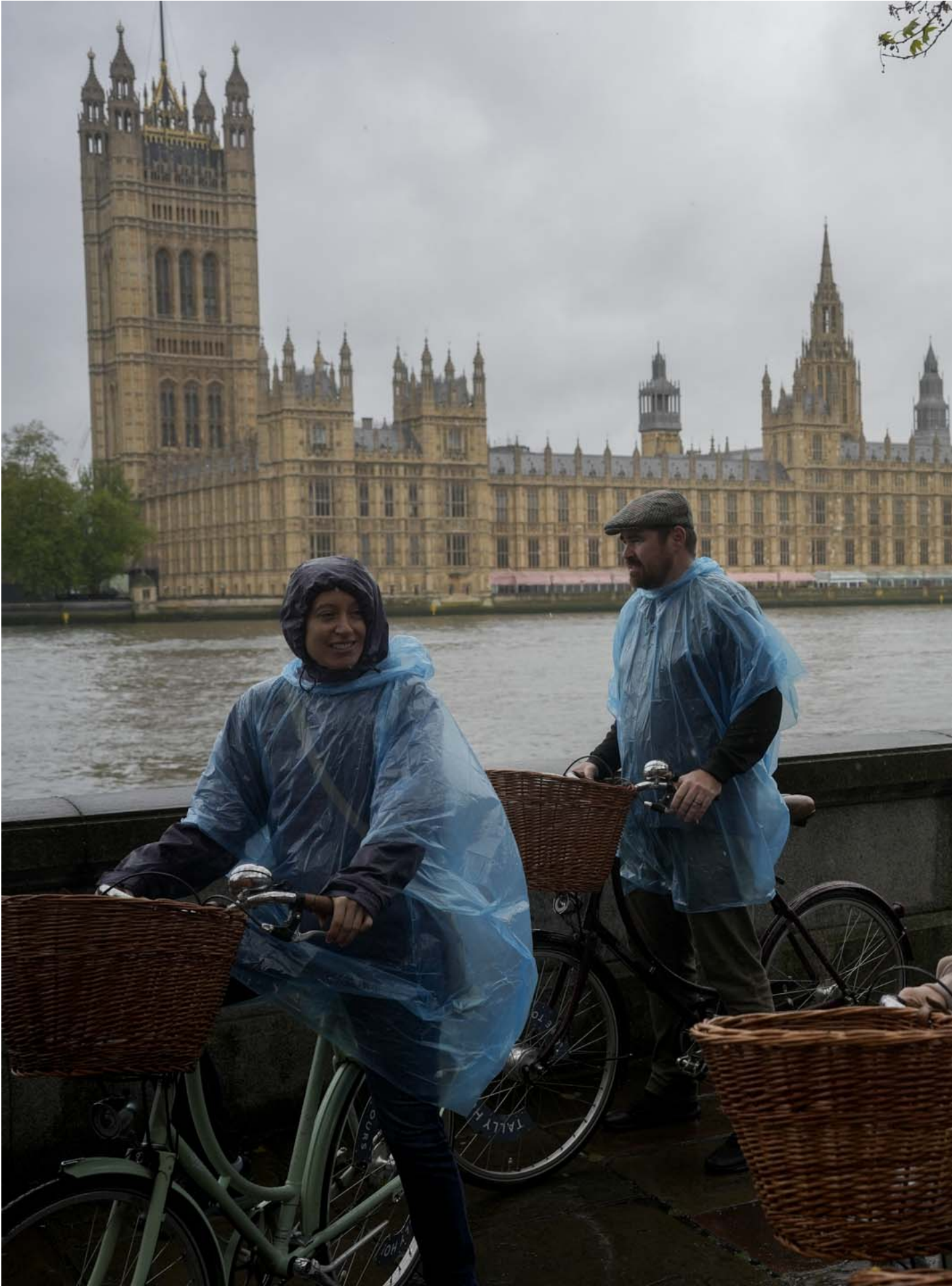
2024年5月3日，英國倫敦，遊人穿著潮濕的塑膠雨傘騎自行車遊覽議會大廈。

「以前在香港，我總是很勤力地看政治新聞，但來到英國，就有點政治冷感，感覺再看下去，就會勾起以前的經歷，真的累了，不想再看了。」 我是2019年「半走難」來的，當時我知道自己有英國護照，才敢走得比較前，還挺自豪自己不是政治上的中國人。剛移民來時，我總想如果香港的情況不那麼糟糕，我就會回去，所以完全沒想過投票。只是後來決定常居英國，才登記做選民，幾個月前的地區選舉，終於第一次投票了。 我忘了我投給誰了，因為我不看政黨，只是看政綱，反正是跟伯明翰經濟和清潔空氣區（Clean Air Zone）有關。哈哈，因為我需要錢呀，連基層工作也找不到；國家也很窮，到處的社區設施都缺乏修繕。 我對英國政治的認識不算深，只是大概知道有哪些黨而已。也不是說認識英國政治有什麼困難，在現今世代，只要有恆心和興趣，沒什麼知識是得不到的。以前在香港，我總是很勤力地看政治新聞，但來到英國，就有點政治冷感，感覺再看下去，就會勾起以前的經歷，真的累了，不想再看了。 還有就是我太懶和太忙吧。現在我一週要工作六天，主要都是看BBC，或Instagram演算法為我提供什麼新聞，都是些負面新聞，捅人、撞車、搶劫之類。我知道這樣看新聞是不健康的。 或許因為我不太想理會政黨之間的恩怨情仇，所以我都是看個別政綱，沒偏好哪個黨。唯一就是完全不會考慮綠黨，因為我很喜歡車，去年綠黨提出禁售燃油車，但英國政府都沒相應配套協助車主換車，而且我覺得隨著科技發展，燃油車也越來越環保了，讓他們在市場競爭就好呀。這樣一刀切，真的太「環保膠」了。 至於其他黨，我有些朋友會很情緒化地說工黨都是騙人的，不要投給他們，也沒解釋為什麼。我不會理會他們，最後我都不是非黑即白的只看黨派。以前在香港，事事都是親共反共兩大陣營，如今在英國，終於不用只看意識形態，可以好好看看他們的政策了。