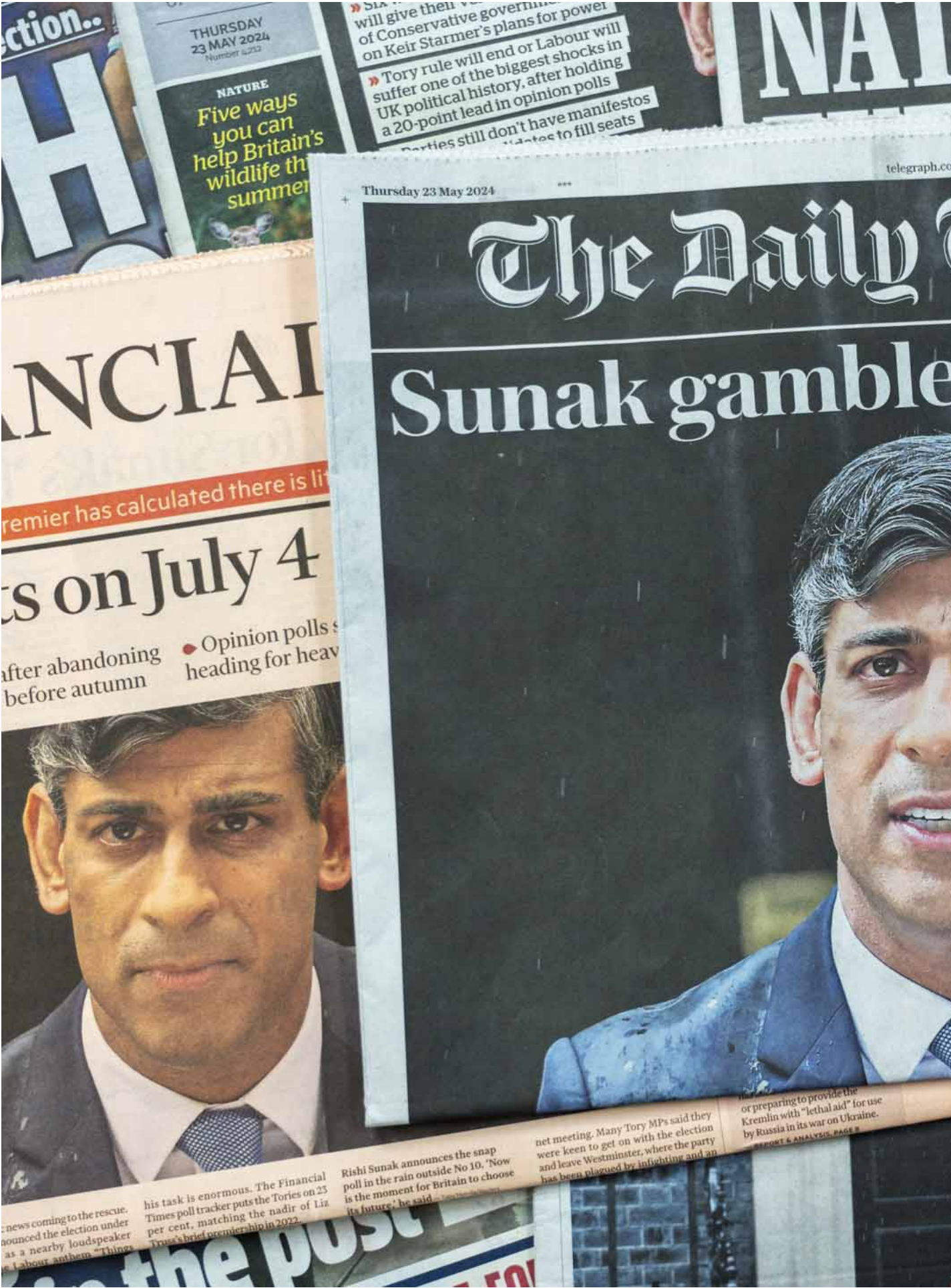
2024年5月23日，英國倫敦看到的一系列英國報章頭版報道大選新聞。

大選我主要都是關注醫療、住屋和交通。鐵路罷工真的很麻煩，但沒辦法，這是他們的文化。至於支持哪個黨，我真的不知道。