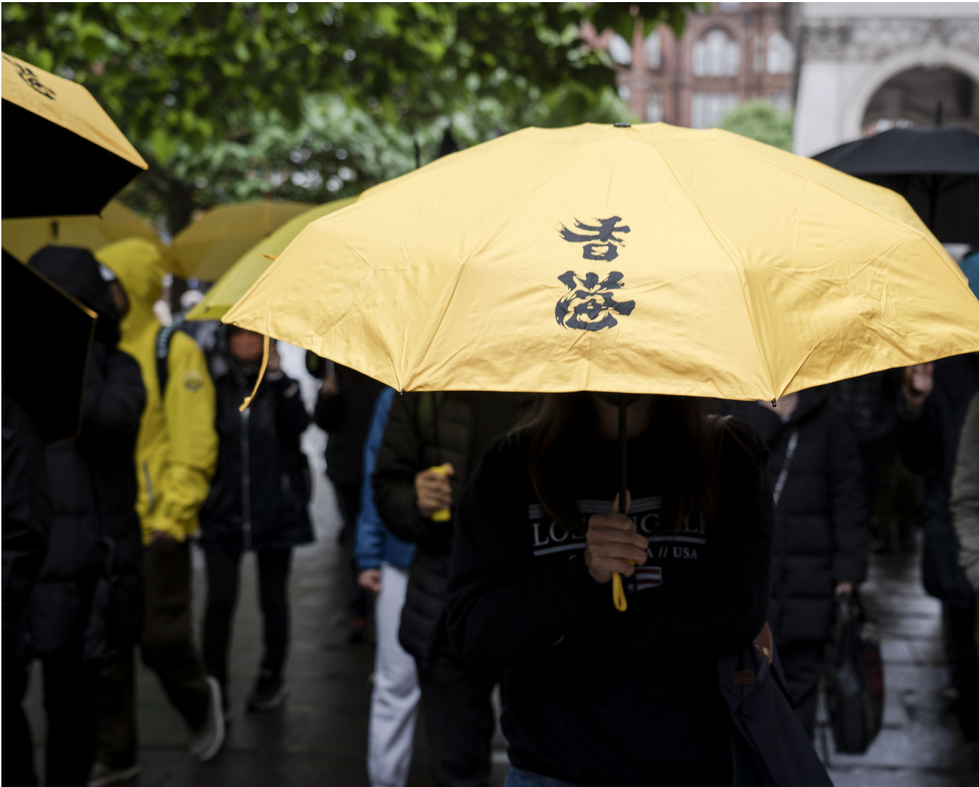
2024年6月9日，英国曼彻斯特，数十名香港人举行游行纪念2019年的反修例运动，示威期间有人拿著一把写有“香港”的黄色雨伞。

英國將於7月4日舉行大選，屆時下議院的全部650個席位都將改選，保守黨的14年執政也很可能在今夏告終。我們此前已刊出關於英國政經、民生政策的懶人包與梳理現況的數洞欄目，亦將刊出一系列專訪及其他相關專題。請 按此 追蹤「2024 英國大選」系列。端也推出了免費的英國大選新聞信，請 按此 訂閱。