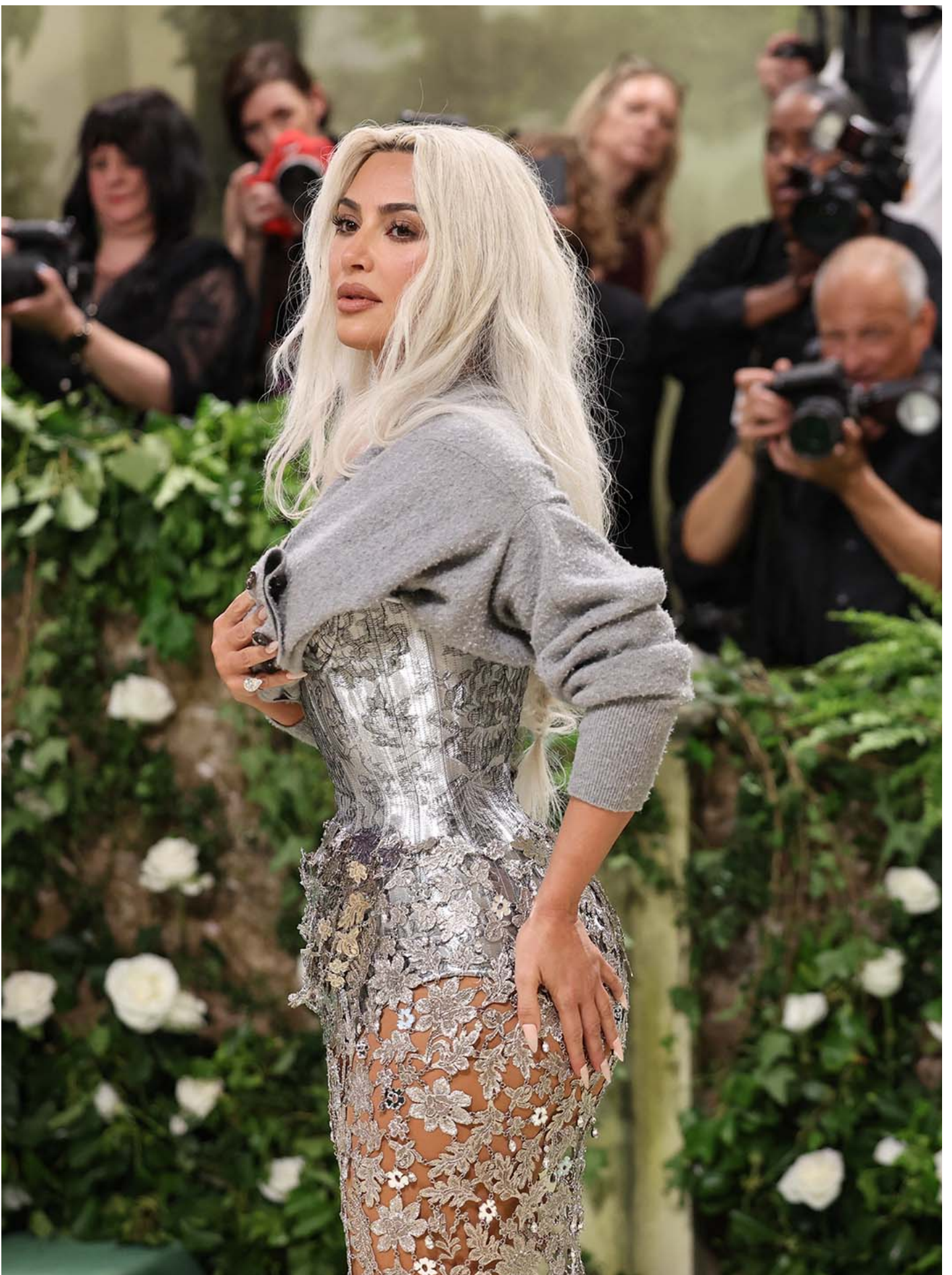
2024年5月6日，美国纽约市，Kim Kardashian在Met Gala上。

下一次文字媒介革命是本世纪初的社群网路。不过，天外飞来的社群网路实际上砸烂了好莱坞明星的最高圣殿——奥斯卡颁奖典礼。由于 Facebook 等社群服务提供了与明星本人互动的直接管道，原本垄断了好莱坞明星喜怒哀乐唯一通路的奥斯卡颁奖典礼突然丢失了真实性的王冠（许多人直到现在都还坚信 Will Smith 掴掌事件是写好的脚本）。奥斯卡作为美国电视产业最重要节目的地位因此动摇，在收视率下滑的路上一去不返。