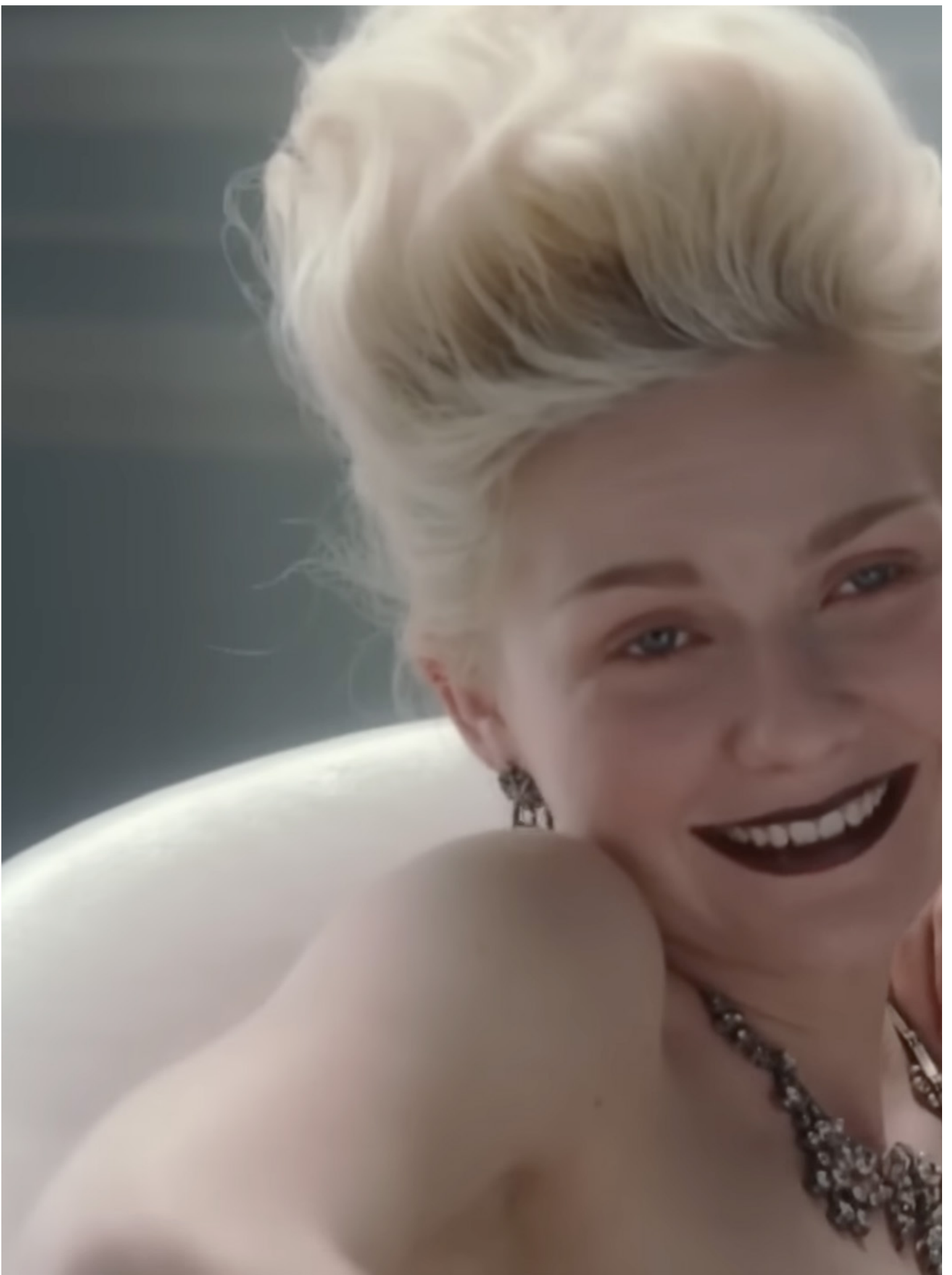
《凡尔赛拜金女》剧照。

发出那支短片的TiToker用意并非警世，而是纯粹拿这些饿著肚子穿上小号服装的名流开玩笑。不幸的是这是一个欠缺历史敏感度和现实敏感度的低劣玩笑。幸运的是它最终还是帮助法国大革命和断头台的警世比喻浮上了水面。