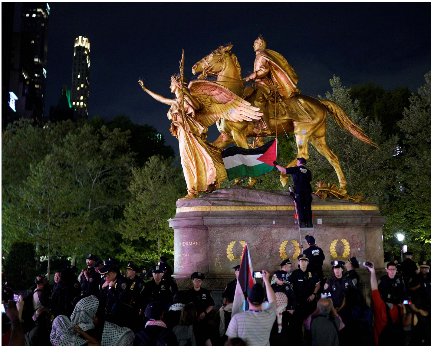
2024年5月6日，纽约，亲巴勒斯坦示威者参加 Met Gala 附近的示威活动，一名警察从纪念碑上取下了一面巴勒斯坦国旗。

愤怒粉丝们正发动一场场政变，试图颠覆那些红毯香槟的名流及其产业，这一次他们能成功吗？