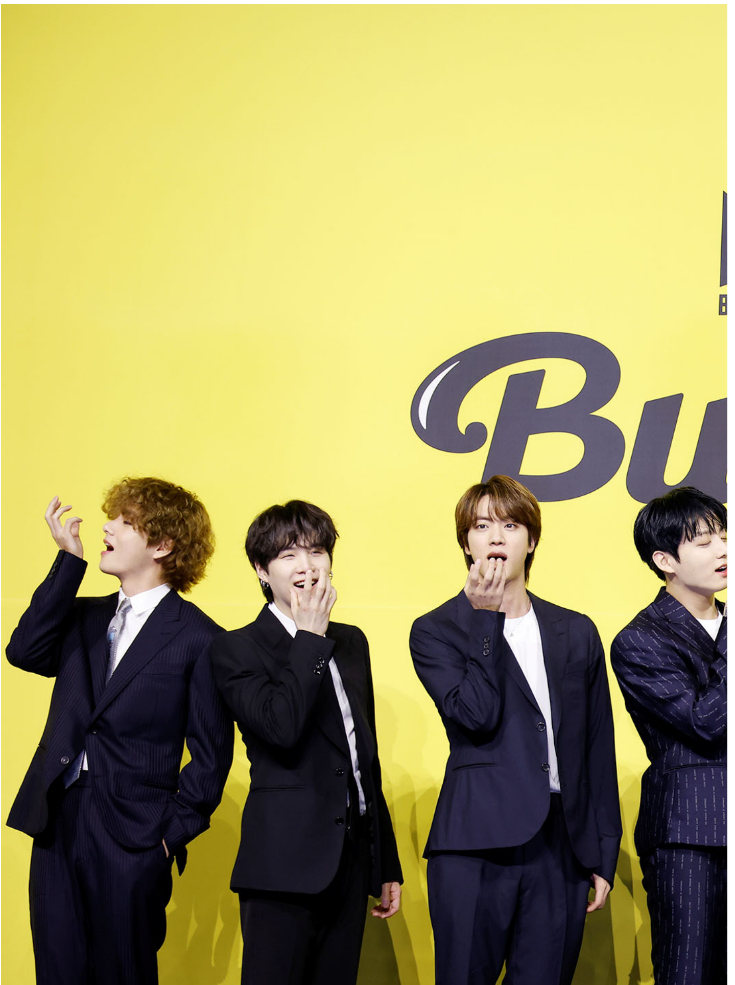
2021年5月21日，首尔，韩国乐团 BTS 的成员在宣传活动中摆出姿势拍照。

Swifties 之前，已经有另一批年轻女性演练过如何透过社群网路集结粉丝，创造足以穿越语言文化和国界隔阂的社会影响力：