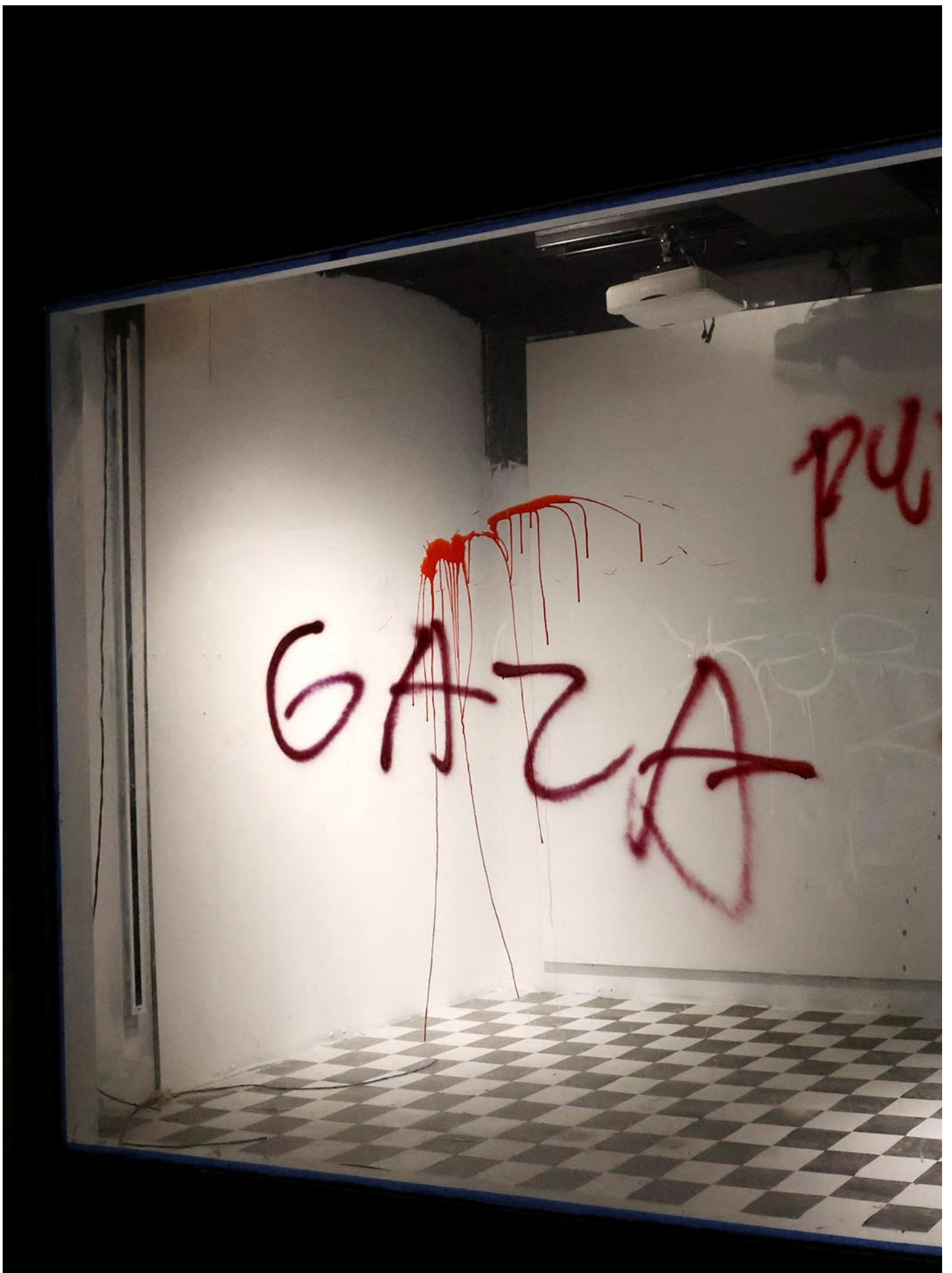
2024年5月6日，纽约，一名示威者在 Met Gala 附近支持巴勒斯坦的示威活动中涂鸦。