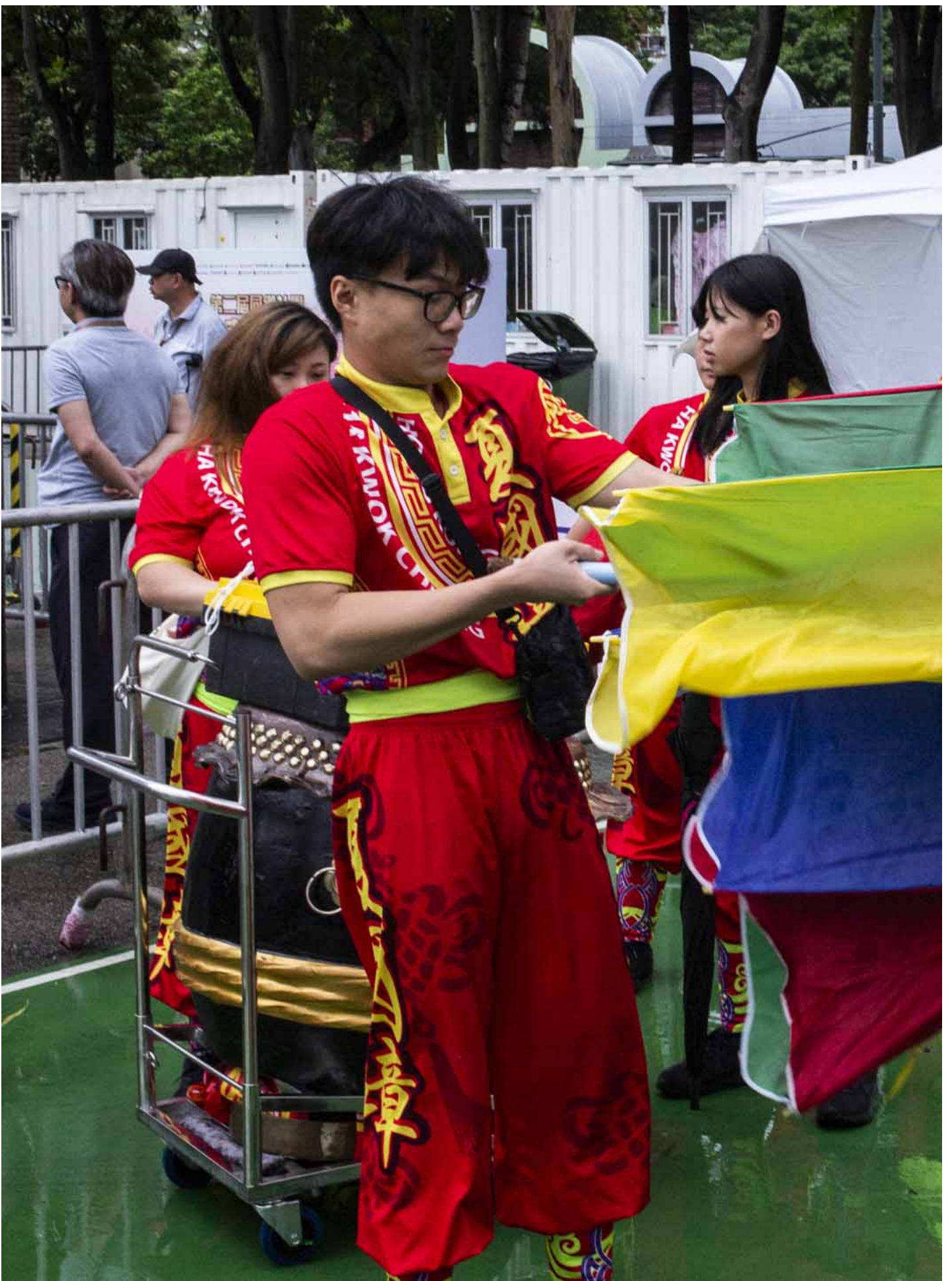
2024年6月1日，第二届同乡社团家乡市集嘉年华在维园举行。