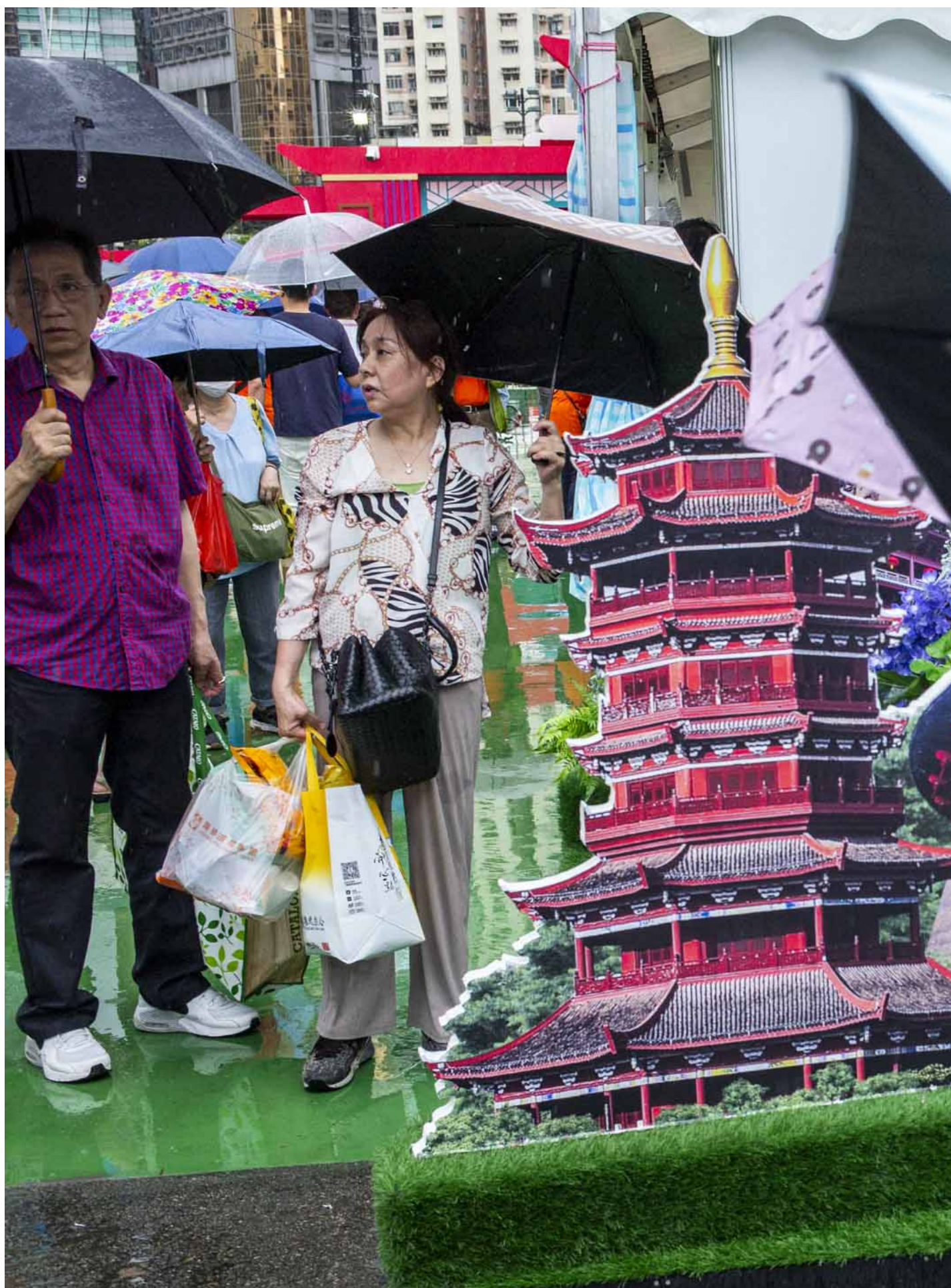
2024年6月1日，第二届同乡社团家乡市集嘉年华在维园举行。