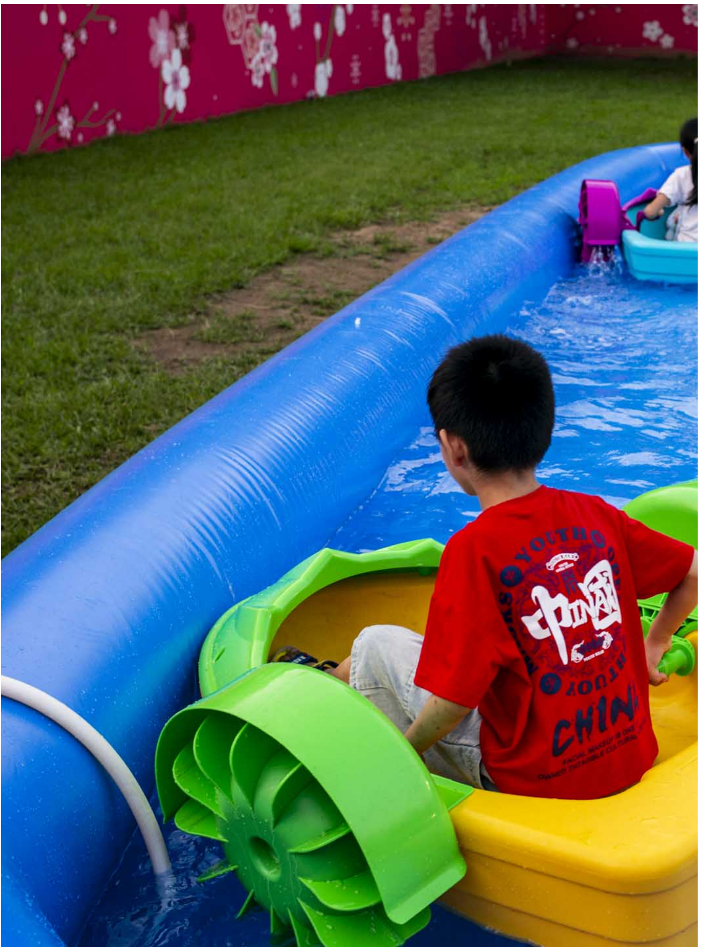
2024年6月2日，第二届同乡社团家乡市集嘉年华在维园举行。

被问到知否维园历年曾举办六四晚会，张女士对此印象模糊，不肯定是否曾在小红书上看过，反问：“可能以前有学过，但是不记得了。六四是一个什么节日吗？”