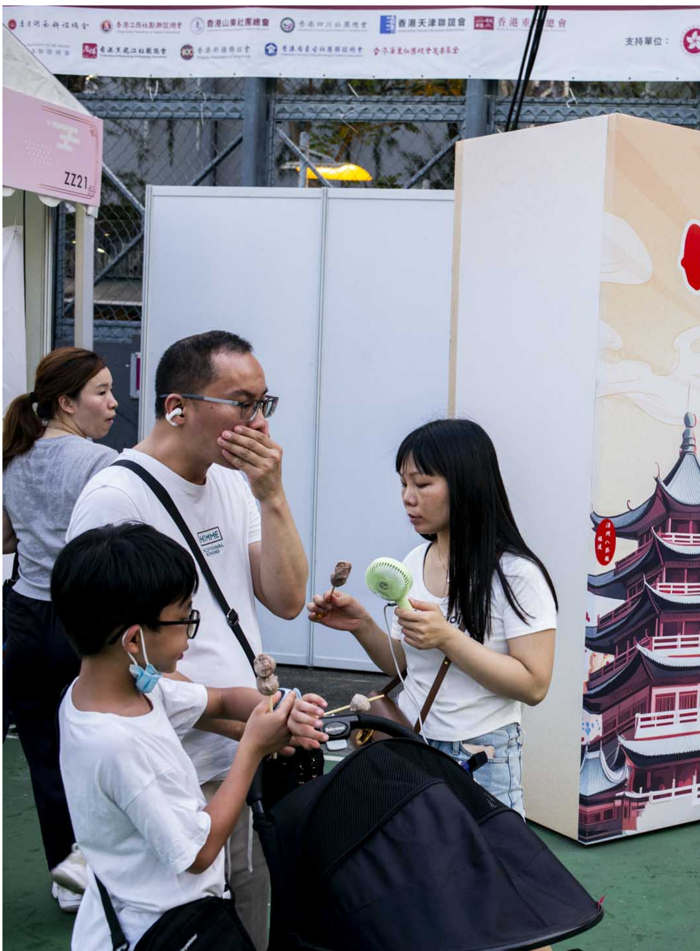
2024年6月1日，第二届同乡社团家乡市集嘉年华在维园举行。