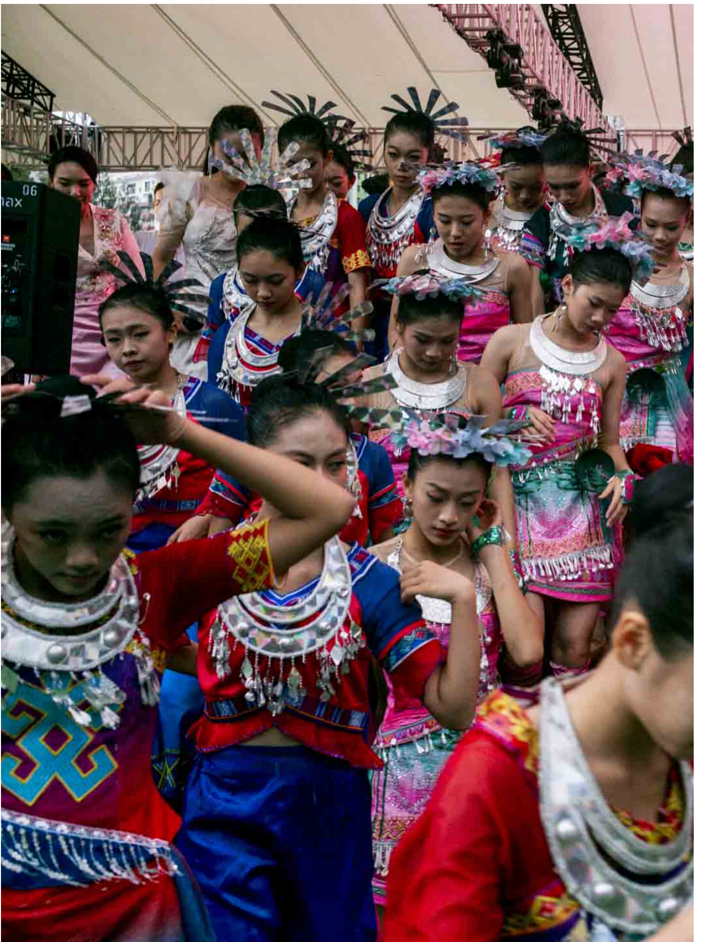
2024年6月2日，第二届同乡社团家乡市集嘉年华在维园举行。

保安局局长邓炳强指有人以匿名方式，透过“小彤群抽会”社交专页，利用“接下来一个敏感日子”，挑起市民对中央和特区政府的憎恨。被问及敏感日子是否六四，邓炳强表示日子并不重要。