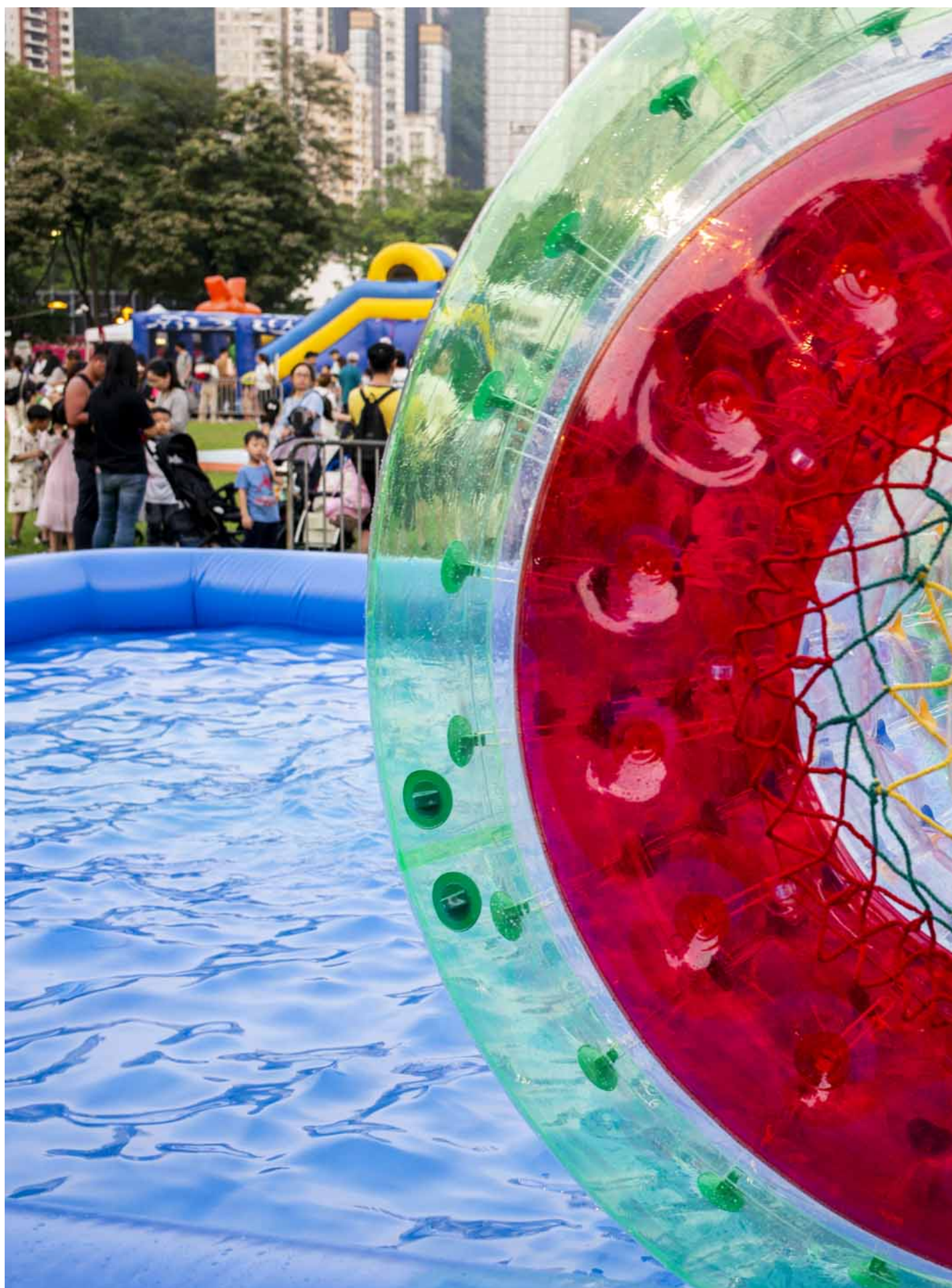
2024年6月2日，第二届同乡社团家乡市集嘉年华在维园举行。