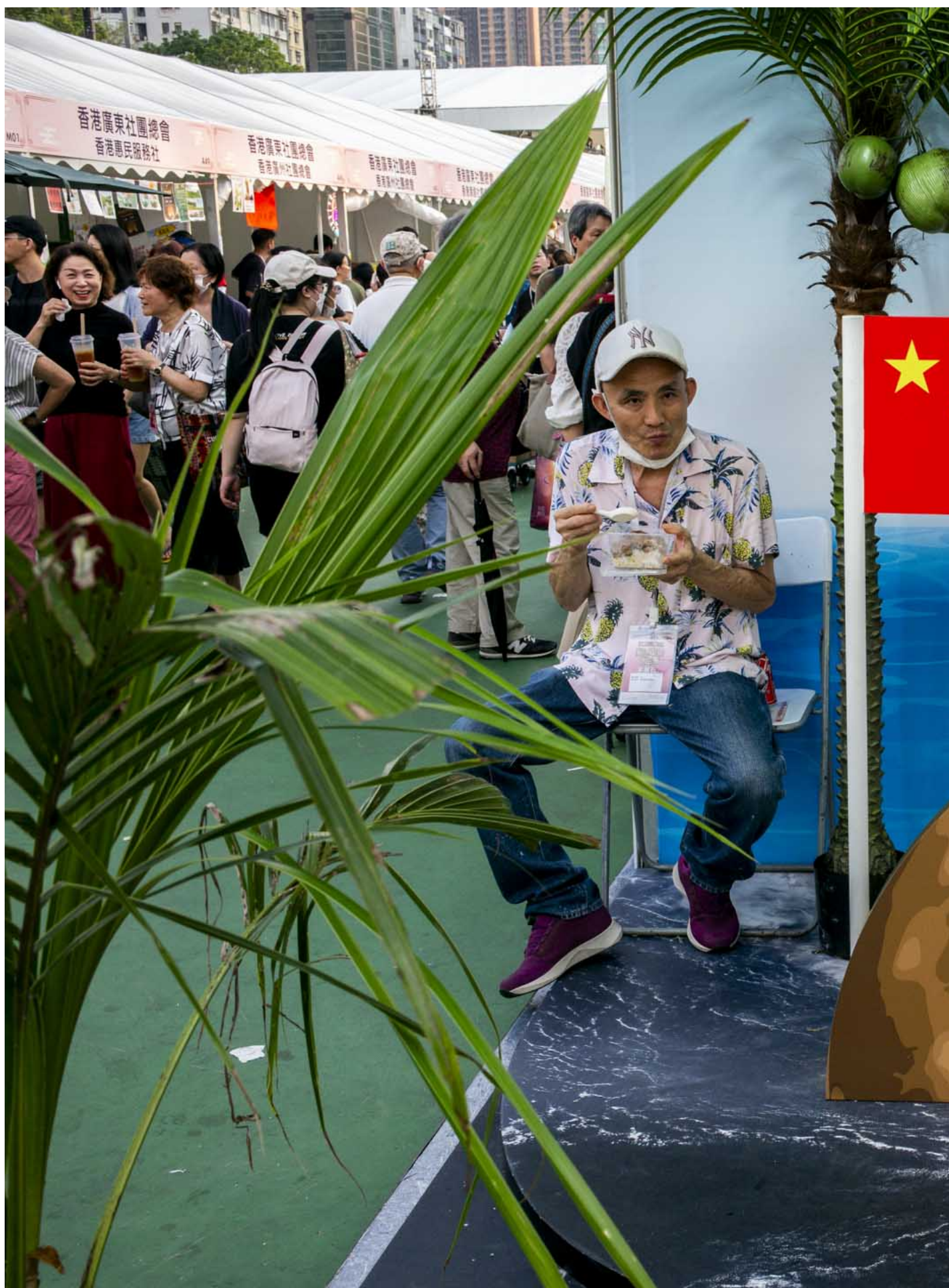
2024年6月2日，第二届同乡社团家乡市集嘉年华在维园举行。