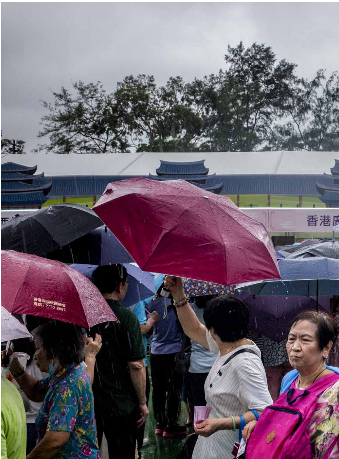
2024年6月1日，第二届同乡社团家乡市集嘉年华在维园举行。