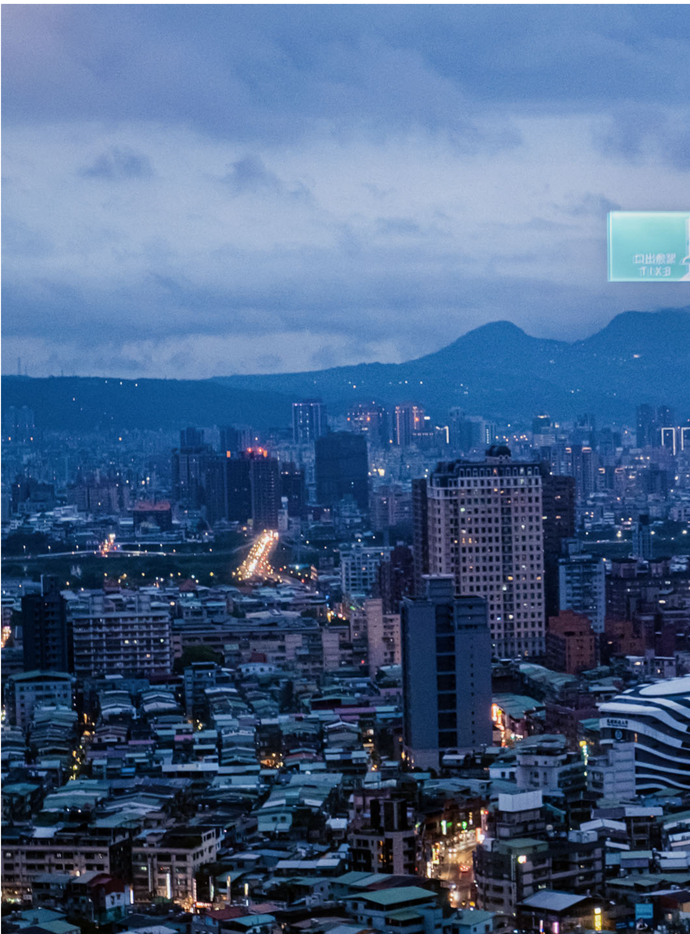
2023年2月5日，新北市城市景观。

过去，曾有不少蓝营支持者相信前数发部长唐凤透过社群媒体监控蓝营民众；而在人权 NGO 的抗议下，数位身分证的推动也因相关法制不足受挫；民众党主席柯文哲在台北市长任内推动的台北通、大数据中心也曾饱受无党籍议员质疑。 （延伸阅读：《台湾身分证、居留证上的个资太多？他们想要隐私，更想拥有选择权》）