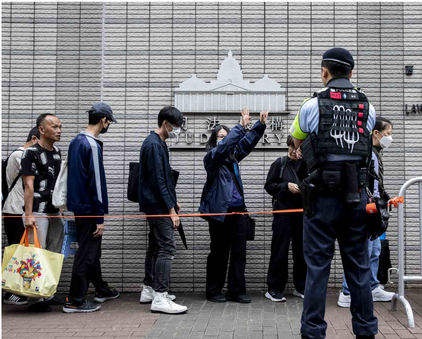
2024年5月30日，香港民主派47人初选案首日裁决，有市民在法庭门外排队时举起手势。

“黎智英案”周达权作供；青年被控“侮辱国歌罪”；同志权益案进展；两人冒认他人取消登记器官捐赠判囚