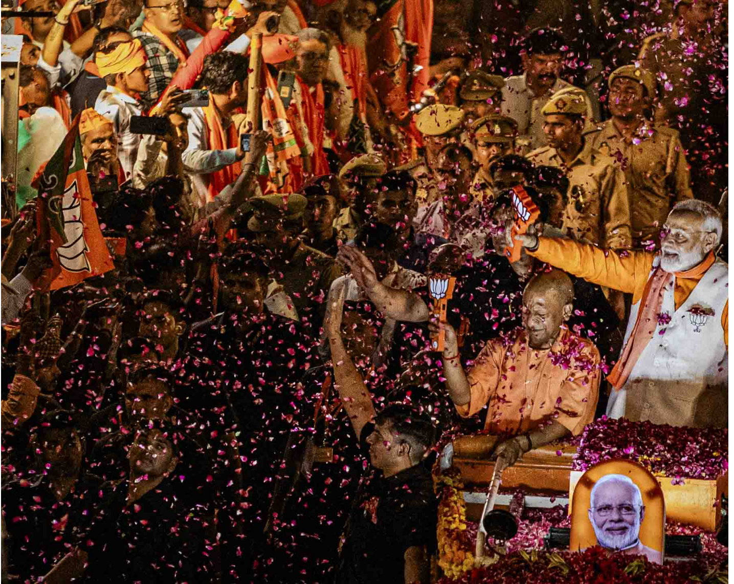
2024年5月13日，印度瓦拉納西，總理莫迪於路演期間向支持者揮手致意。