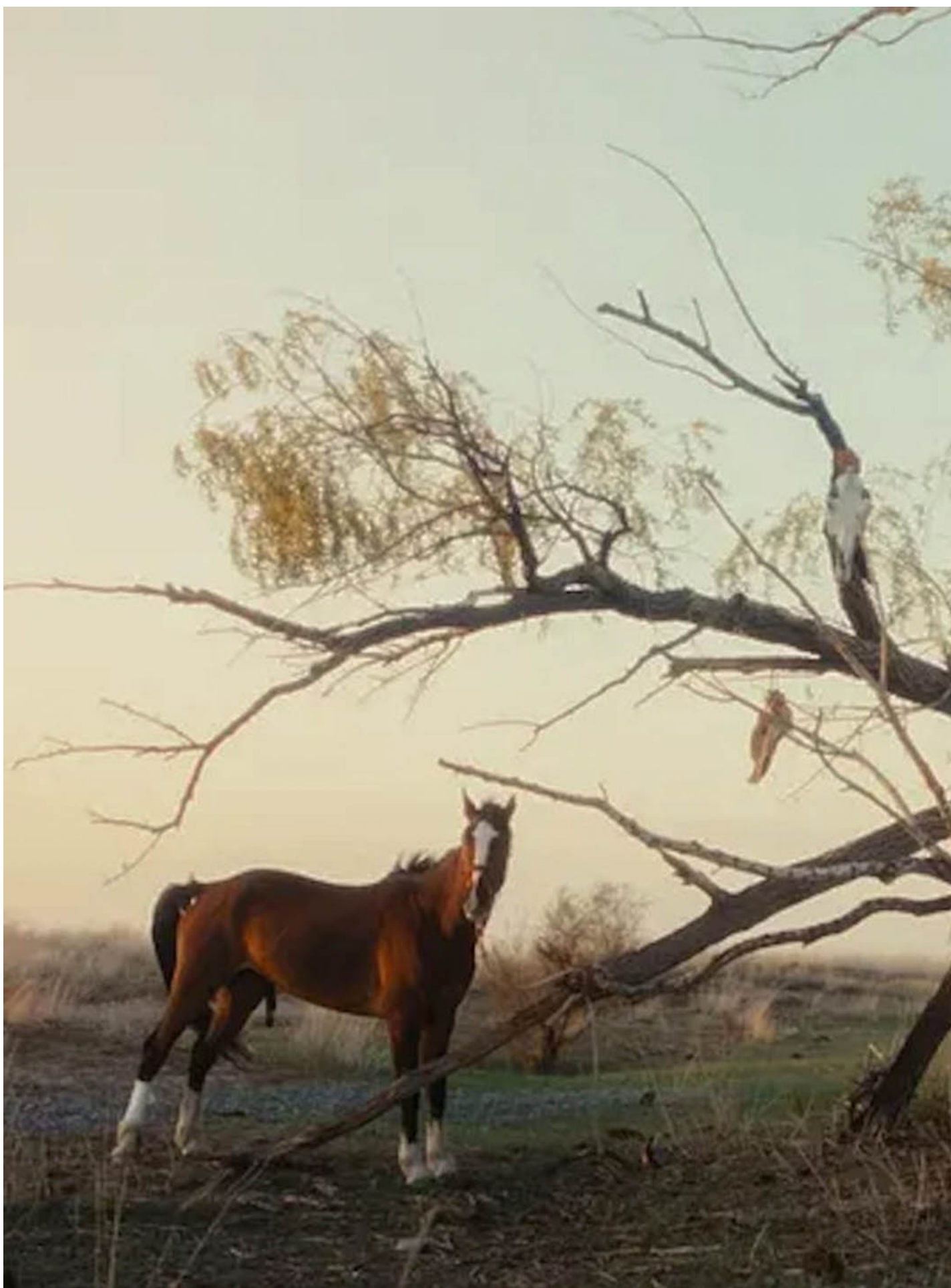
《我的阿勒泰》劇照。

具體到劇情上，《我的阿勒泰》倡導了許多幾年前在中國不敢想象的價值。如劇裏一再說：人要體驗生活，要感受，還要受傷。前些年教育講求「贏在起跑線」，「受傷」或挫折和不順或許是可怕的，但這近似1980年代中國文藝青年的氣質伴隨劇集走紅，似是說明了這樣的生活想象正在中國當下年輕人中，重新佔據一席之地，或至少是變成了更有價值的追求。