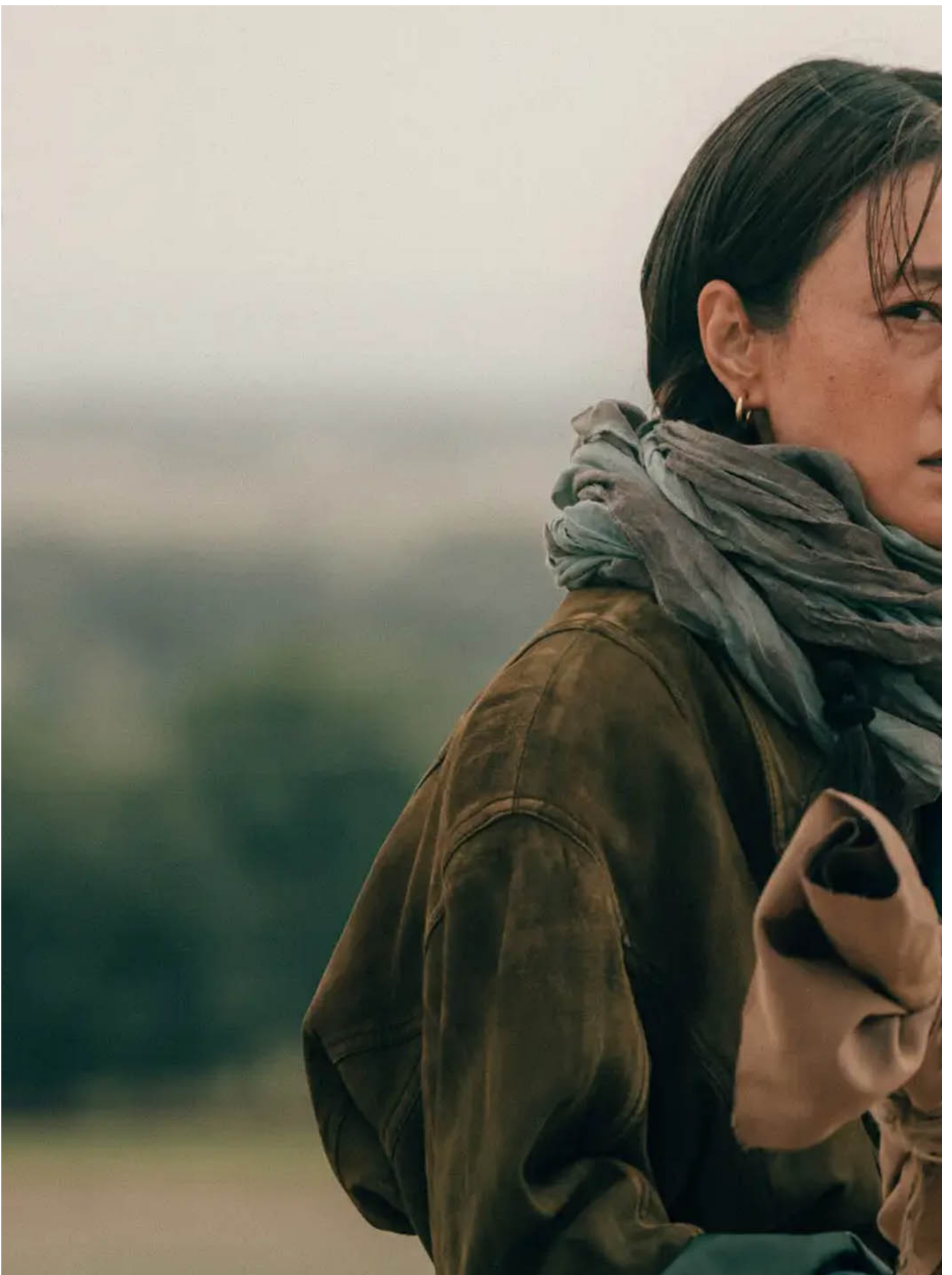
《我的阿勒泰》劇照。圖：網上圖片