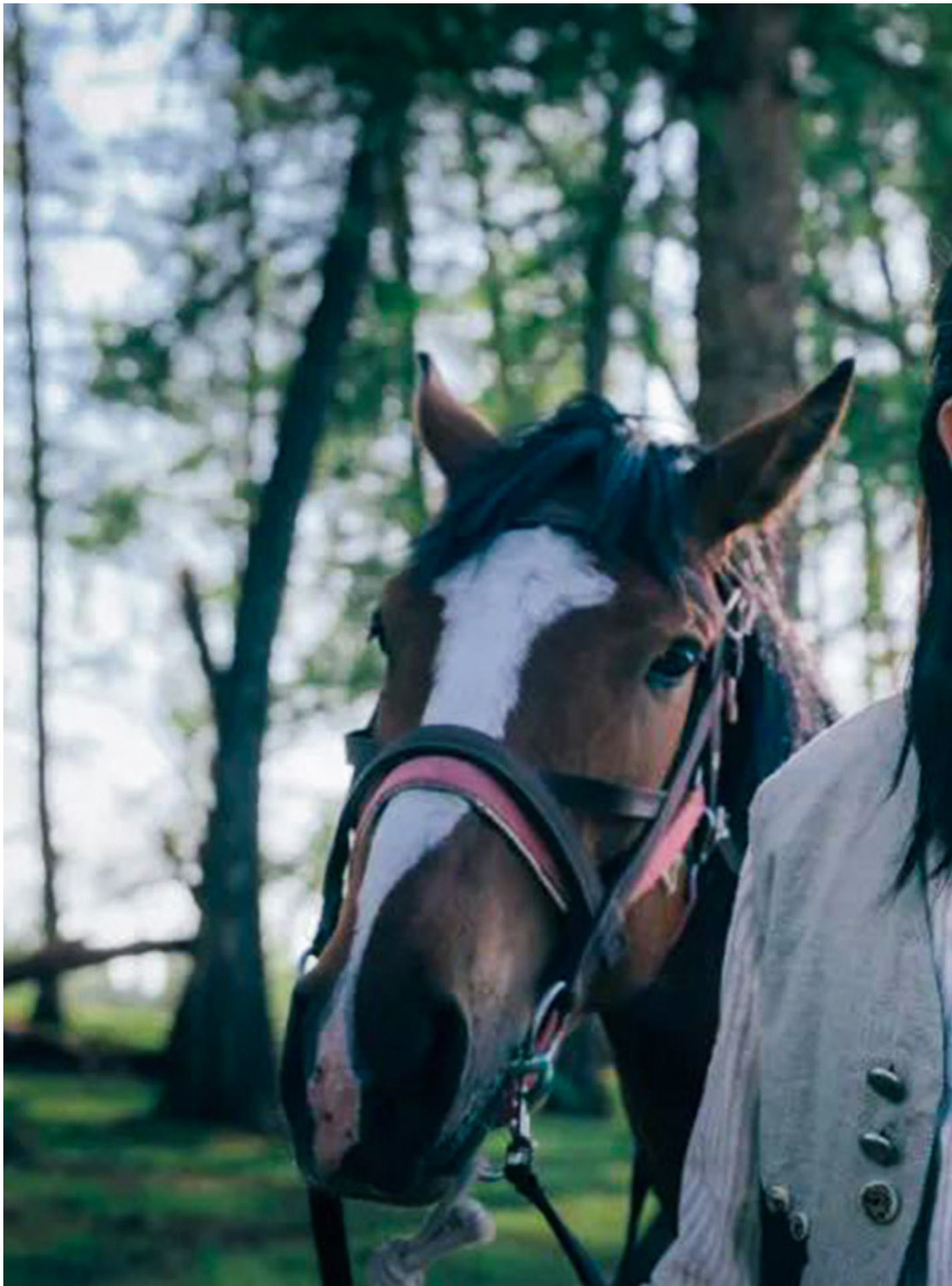
《我的阿勒泰》劇照。

在《我的阿勒泰》之後，會出現一輪少數民族題材影視和文化作品熱潮，而其中走紅的秘訣，一定包括了少數民族文化如何能夠為內捲的漢地排遣焦慮，提供不一樣的世界觀支持。