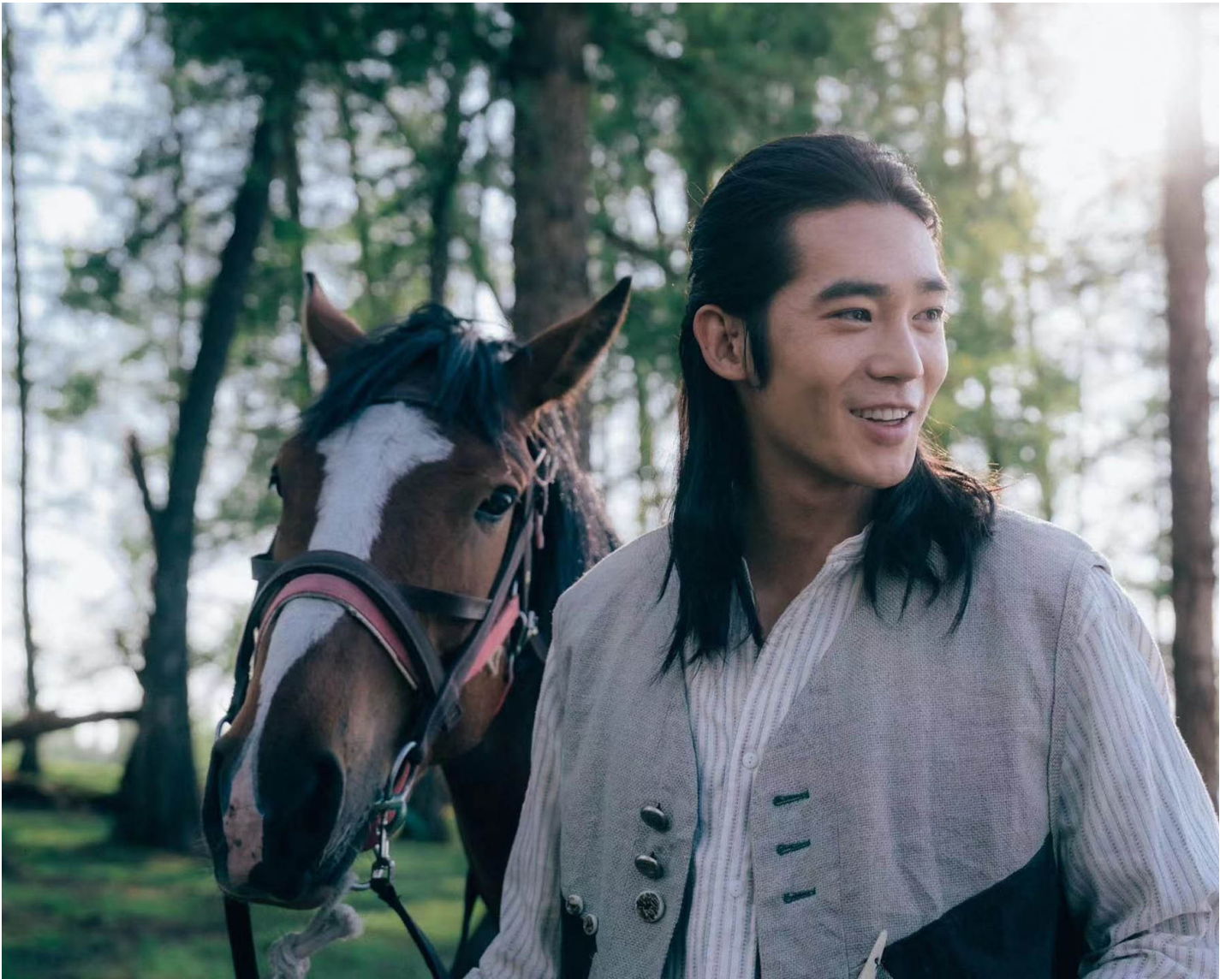
《我的阿勒泰》劇照。

走紅劇集是否意味着泥沙俱下的時代的開始：不斷創造關涉少數民族的文化類型產品，供內地漢族中產階級大肆消費的時代？