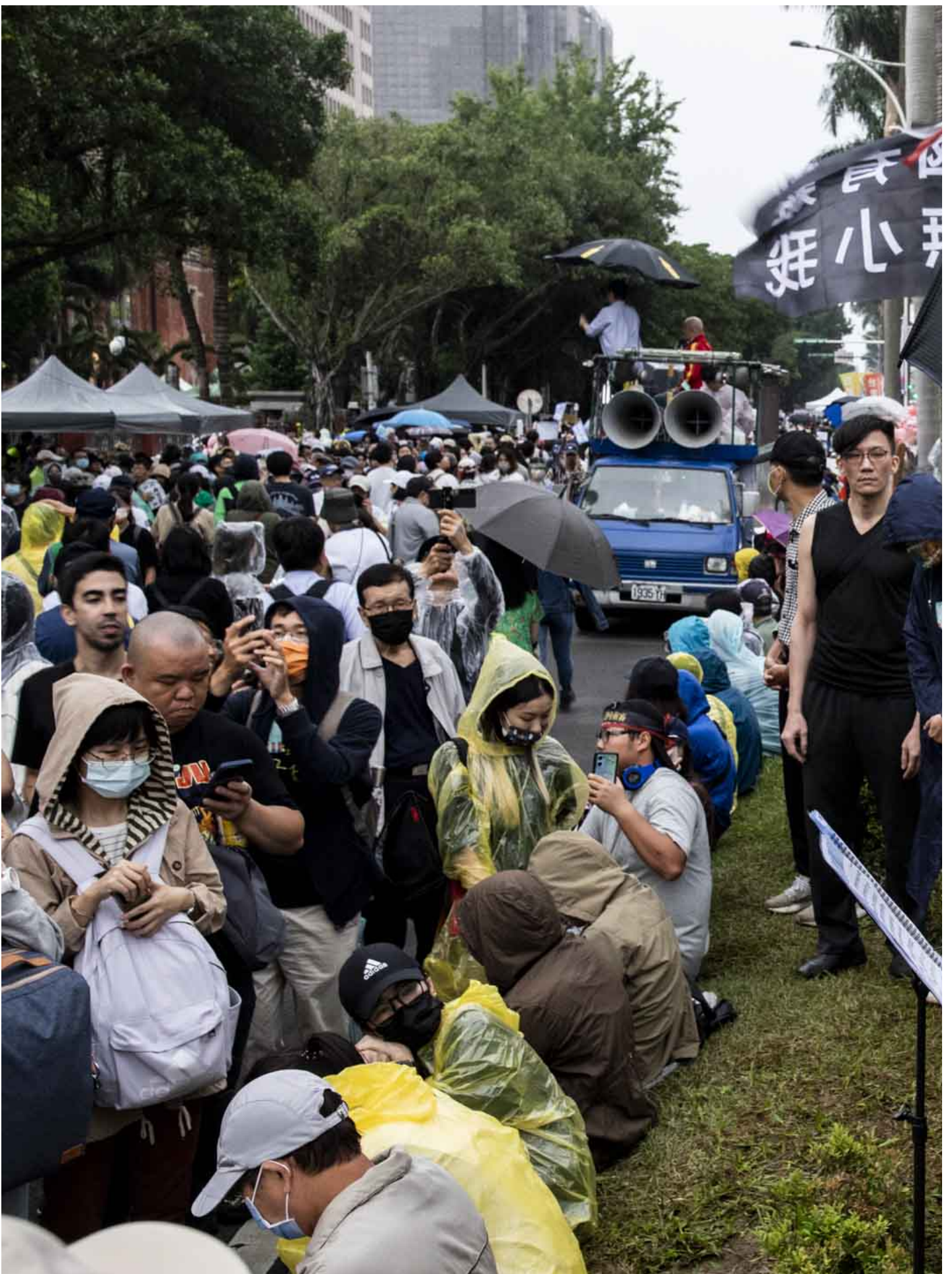
2024年5月28日，台北，立法院進行國會改革法案審議，立法院外有民眾集會。