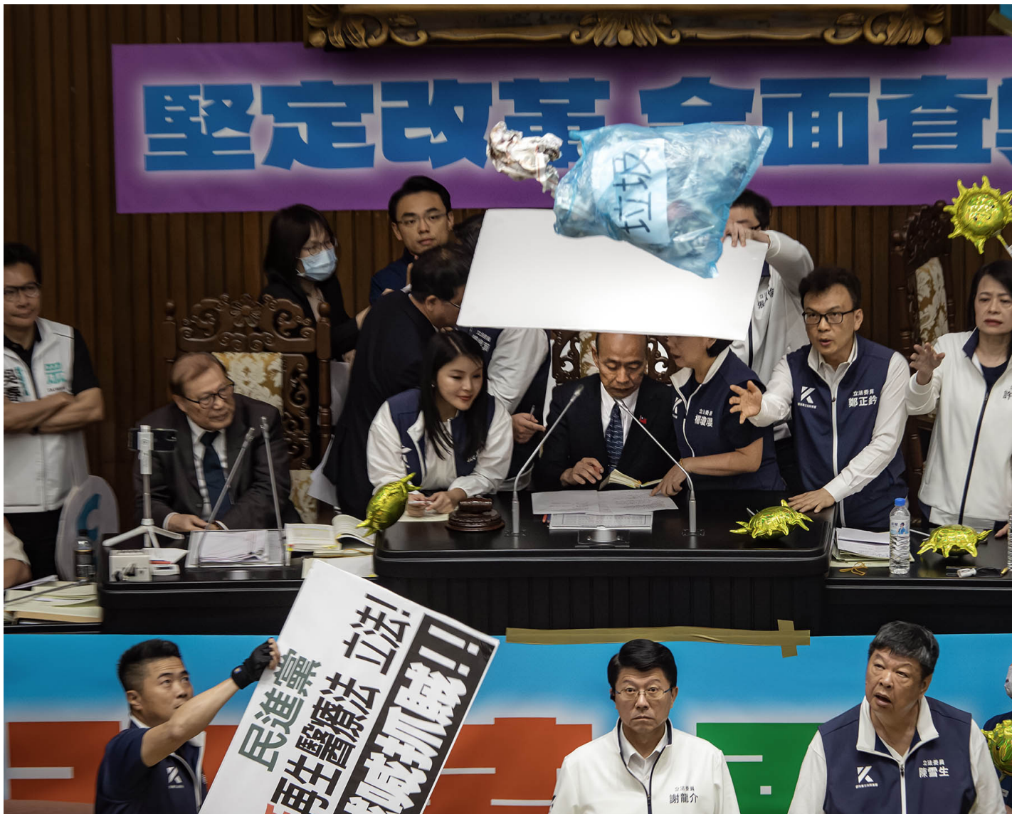
2024年5月28日，台北，立法院進行國會改革法案審議，立法院內民進黨立委向主席台掉垃圾。