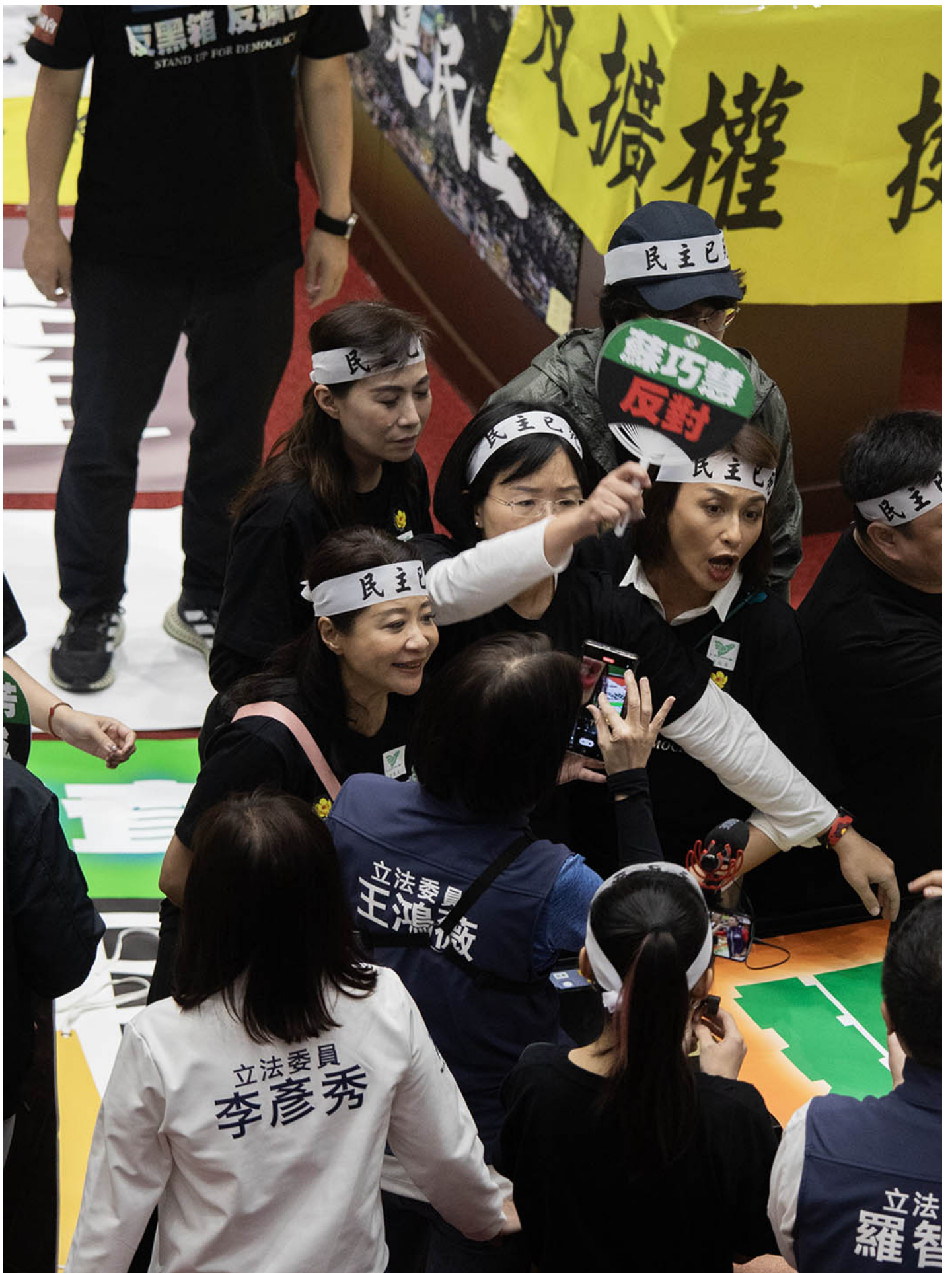
2024年5月28日，台北，立法院進行國會改革法案審議，立法院內民進黨立委與國民黨的立委互相指罵。