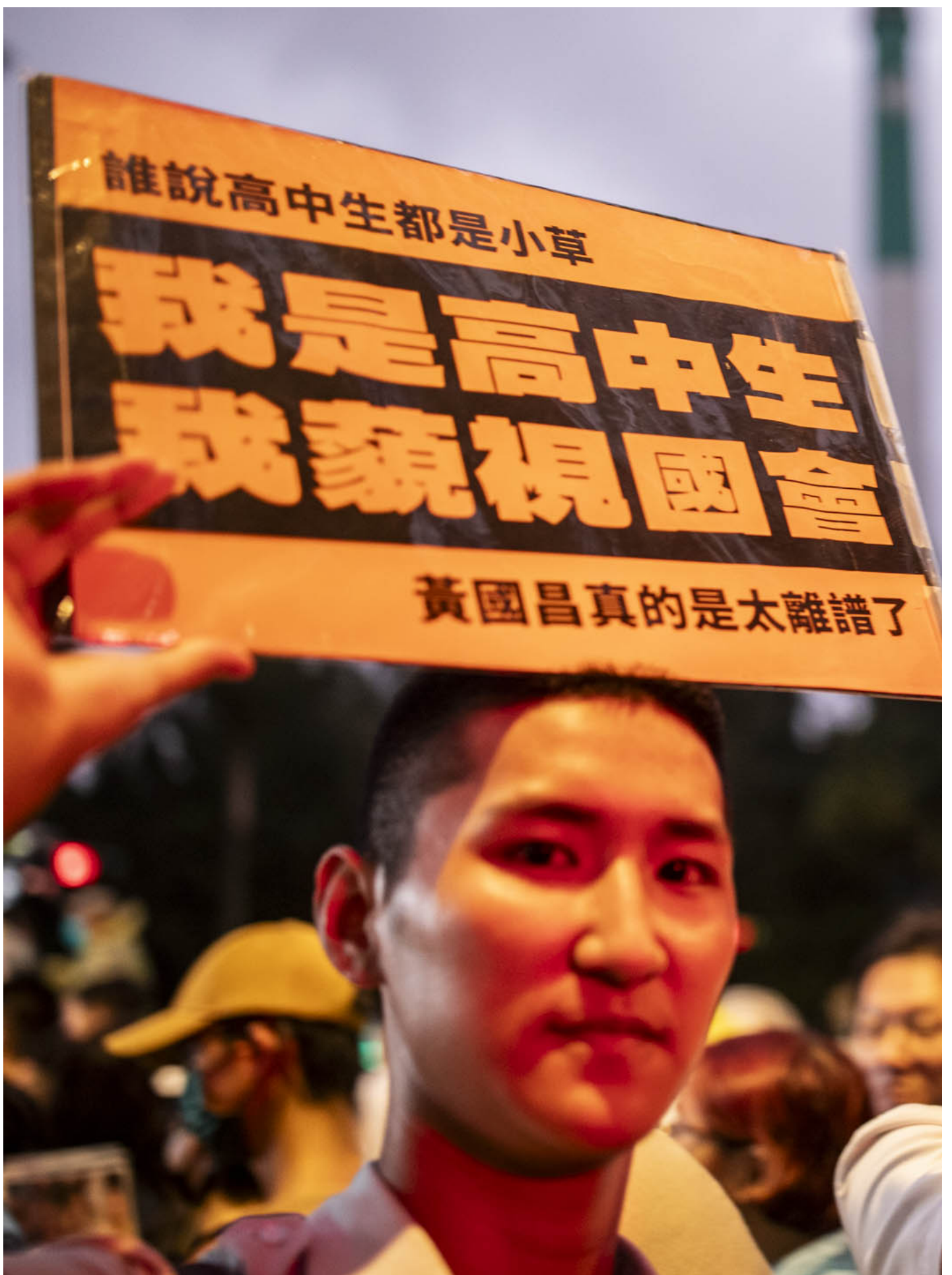
2024年5月28日，台北，立法院進行國會改革法案審議，立法院外有民眾集會。