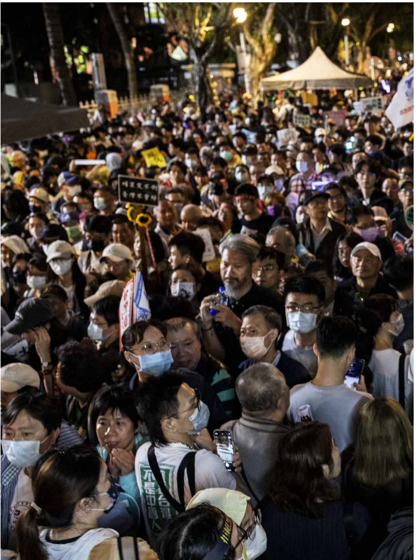
2024年5月28日，台北，立法院進行國會改革法案審議，立法院外有民衆集會。