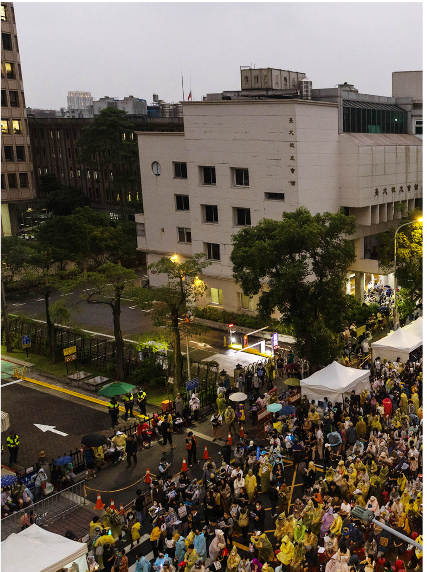
2024年5月28日，台北，立法院進行國會改革法案審議，立法院外有民眾集會。