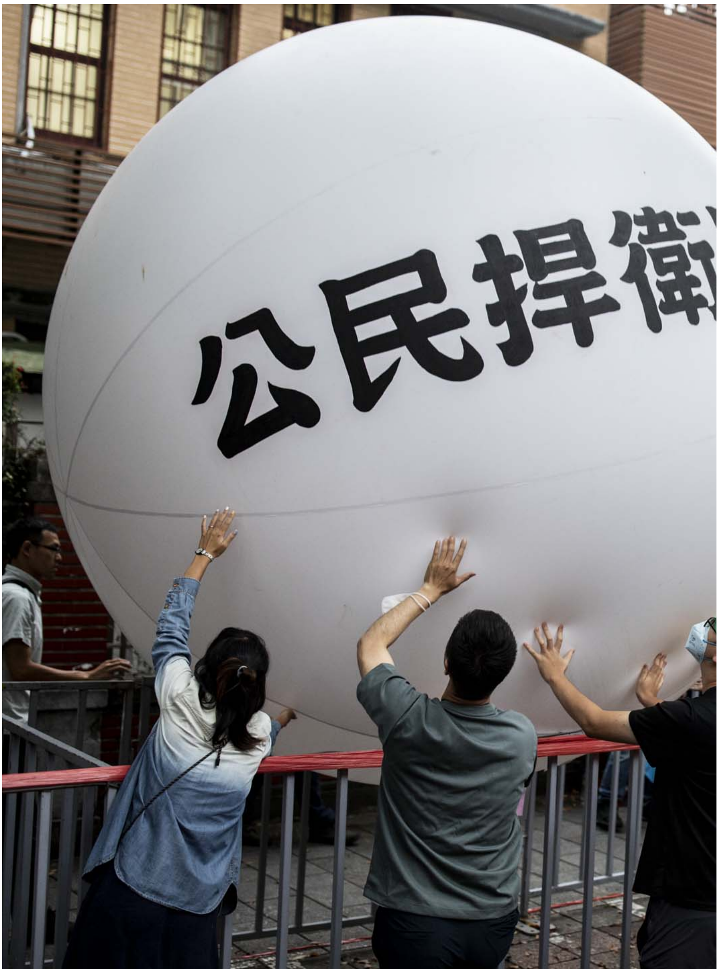
2024年5月28日，台北，立法院進行國會改革法案審議，立法院外有民眾集會，抗議民眾把寫著「公民捍衛民主」、「重啟社會對話」的大型氣球，接力傳遞到立法院前，表達這次行動訴求。

此外，亦有法律學者陸續提出總統可對三讀通過法律行使「不公布的權力」。前促轉會委員、法律學者羅承宗日前撰文指出，《憲法》規定，總統「應」於10日內公布三讀通過的法律，他認為「總統公布法律」乍看下是一種義務，不過在學術上向來會把這樣的觀念列為總統享有的「法律公布權」，而非「義務」。