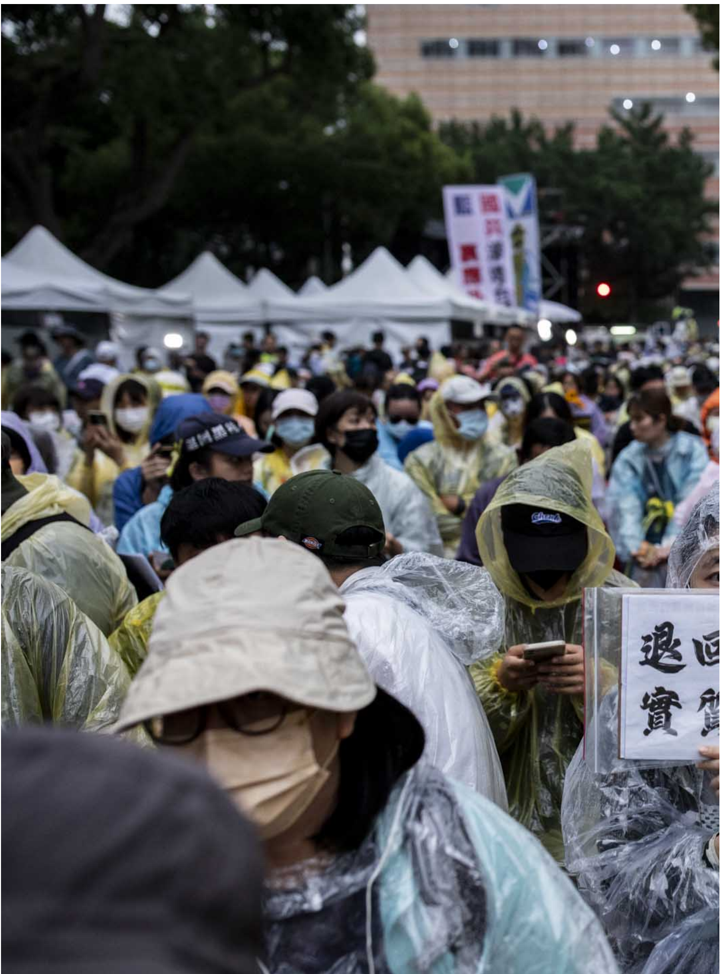
2024年5月28日，台北，立法院進行國會改革法案審議，立法院外有民衆集會。