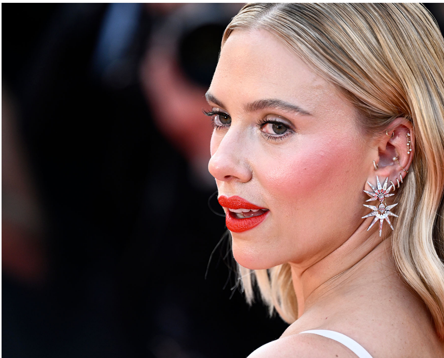
2023年5月23日，著名女星Scarlett Johansson出席法国戛纳影展。