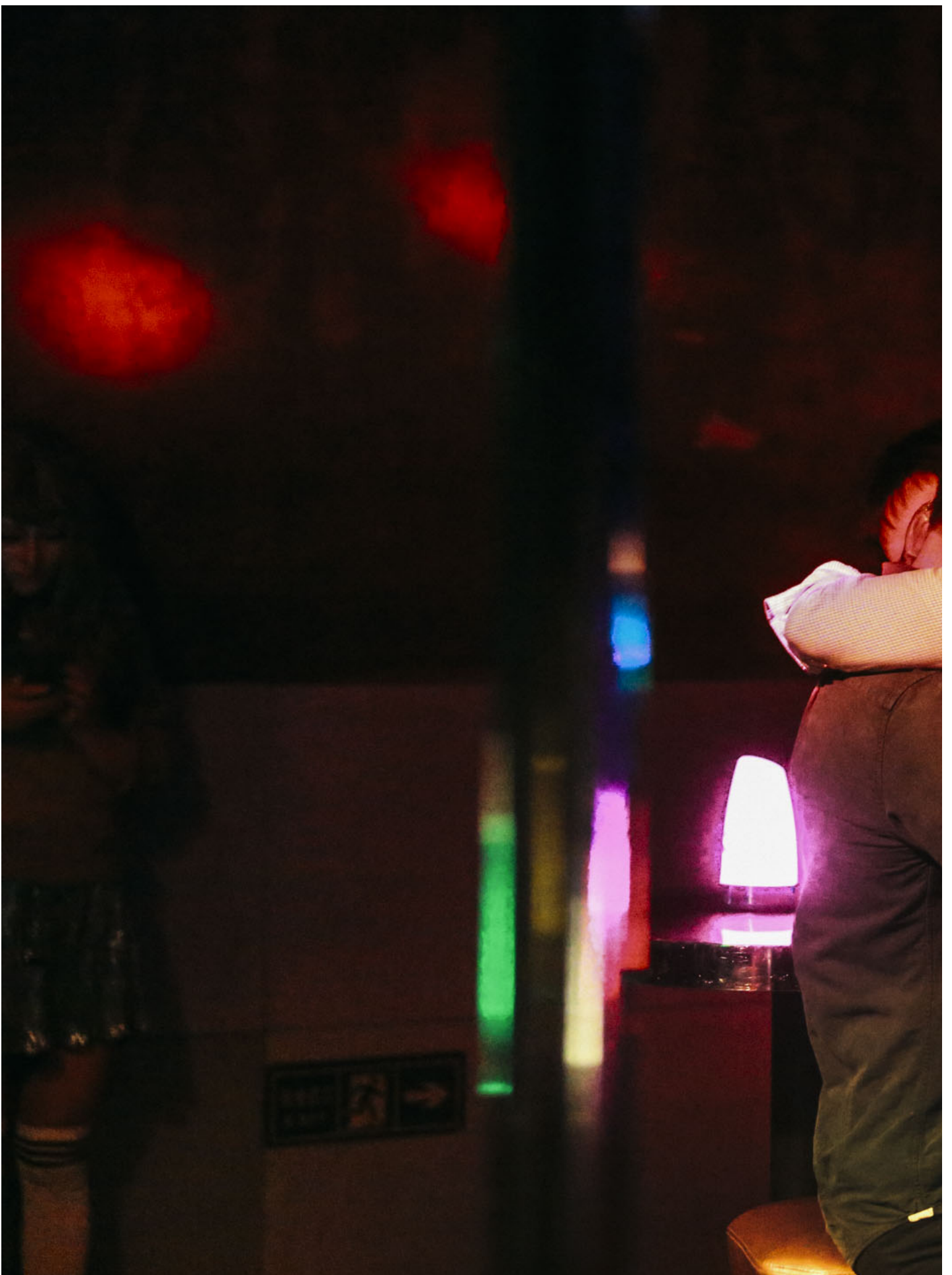
两位男士在拥抱。

在同志族群的交友模式里，总是带着只许成功不许失败的决绝。我对号入座的原因，可能是在对话里真的很主动打招呼，也不怕被拒绝。还有，我的确有一份长长的“朋友名单”。