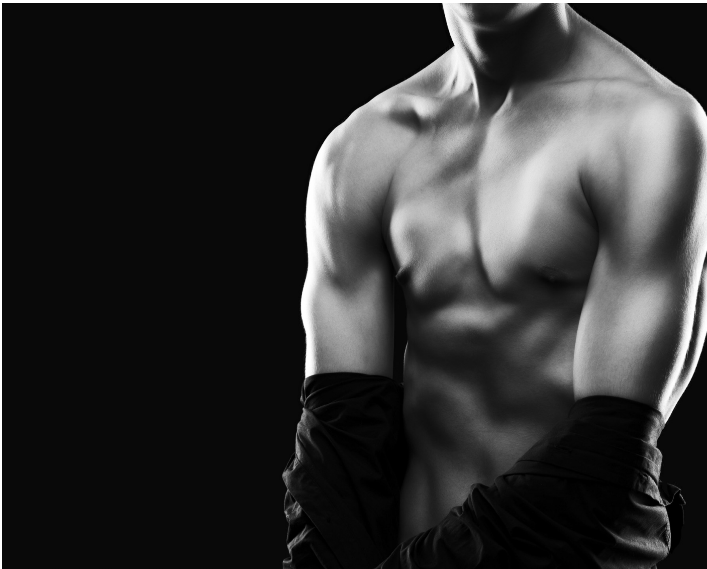
一个苗条肌肉男子在健身房做运动的剪影。