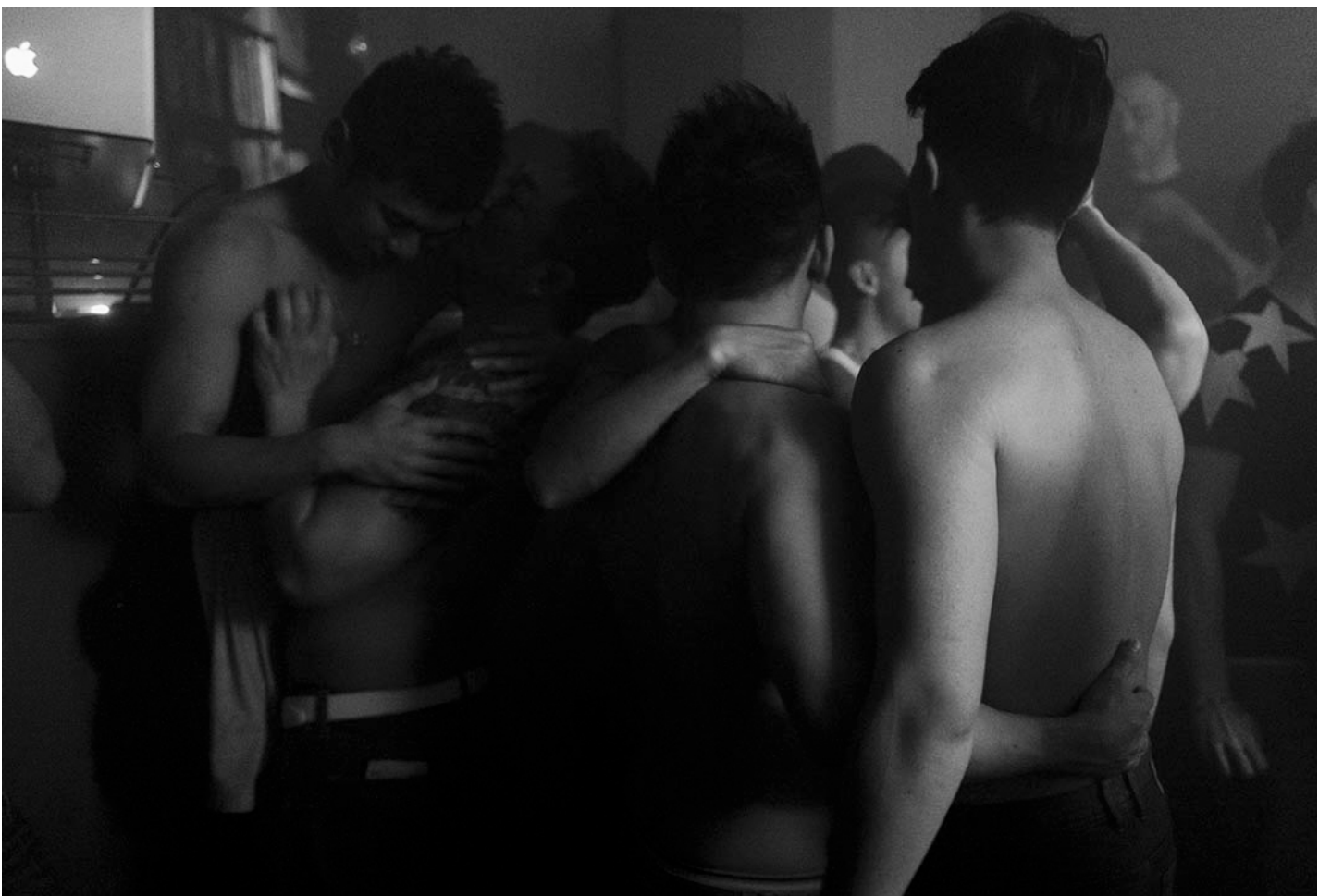
一间香港 Gay Bar 的晚上。