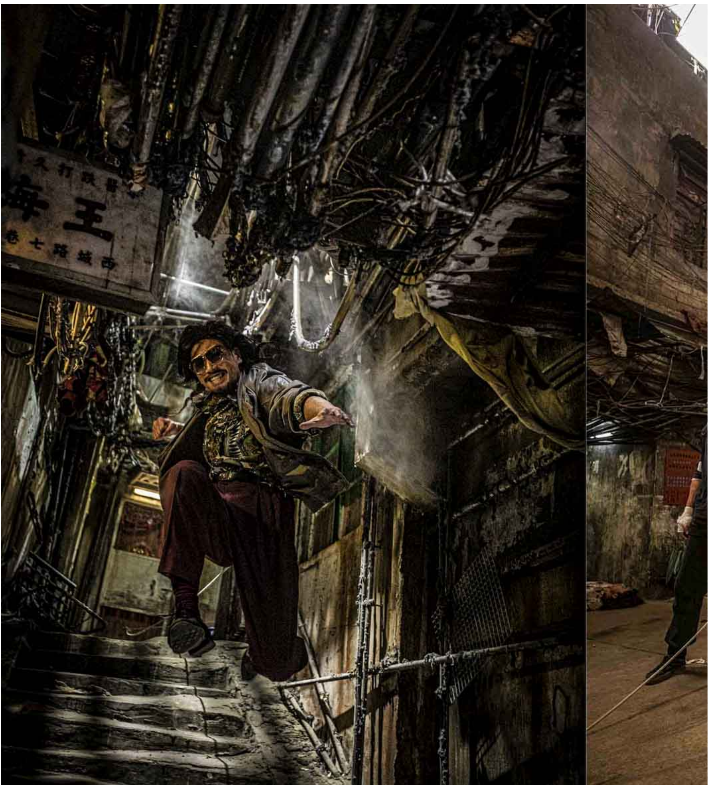
《九龙城寨之围城》剧照。

遗憾的是，港漫武打和经典功夫均是过去事物，把二者结合在一起，并不意味着在观感上会出现新意，人物反而变得更像美式超级英雄了。