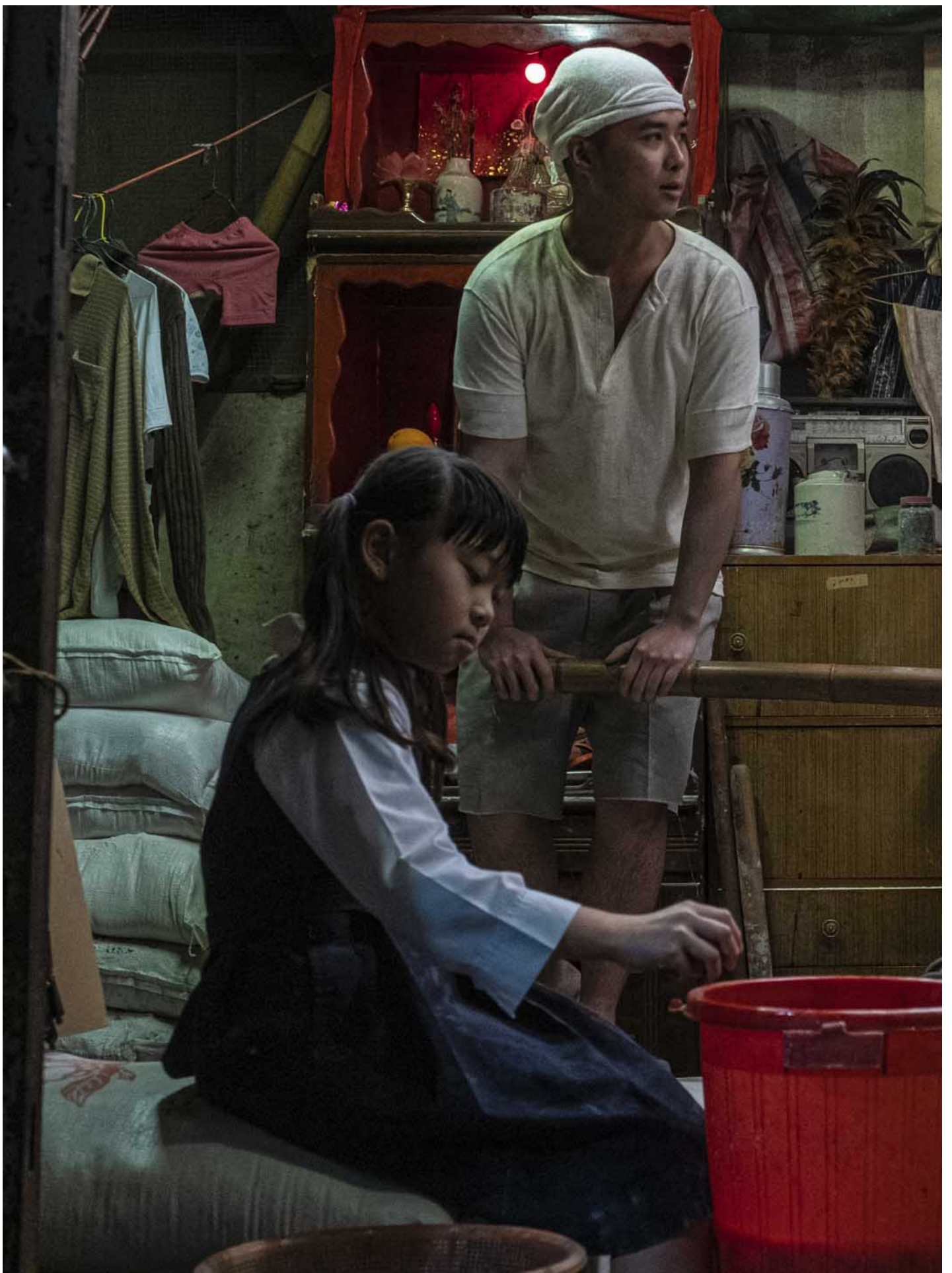
《九龙城寨之围城》剧照。

这位影迷应该具有一定年纪，香港电影曾在他的成长中留下无法抹去的痕迹，每聊到深处，便自然而然会带上一种时光逝去的惆怅，一种对黄金时代旧港片的乡愁，个中还包含着某些回到过去的念头。郑保瑞大概就是这样的一位影迷，《九龙城寨》的底色是乡愁的底色。