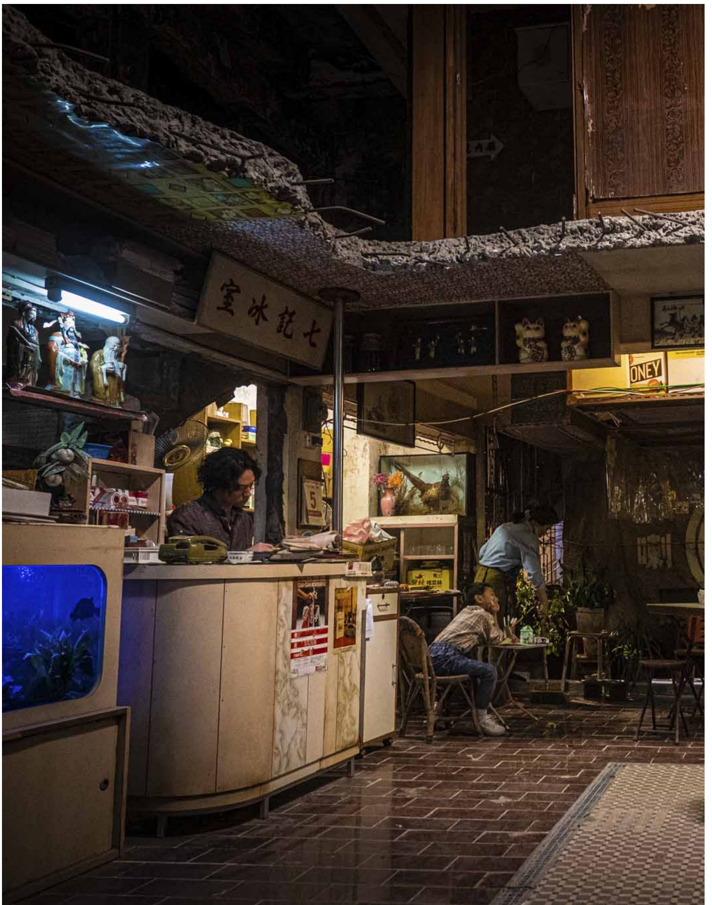
《九龙城寨之围城》剧照。