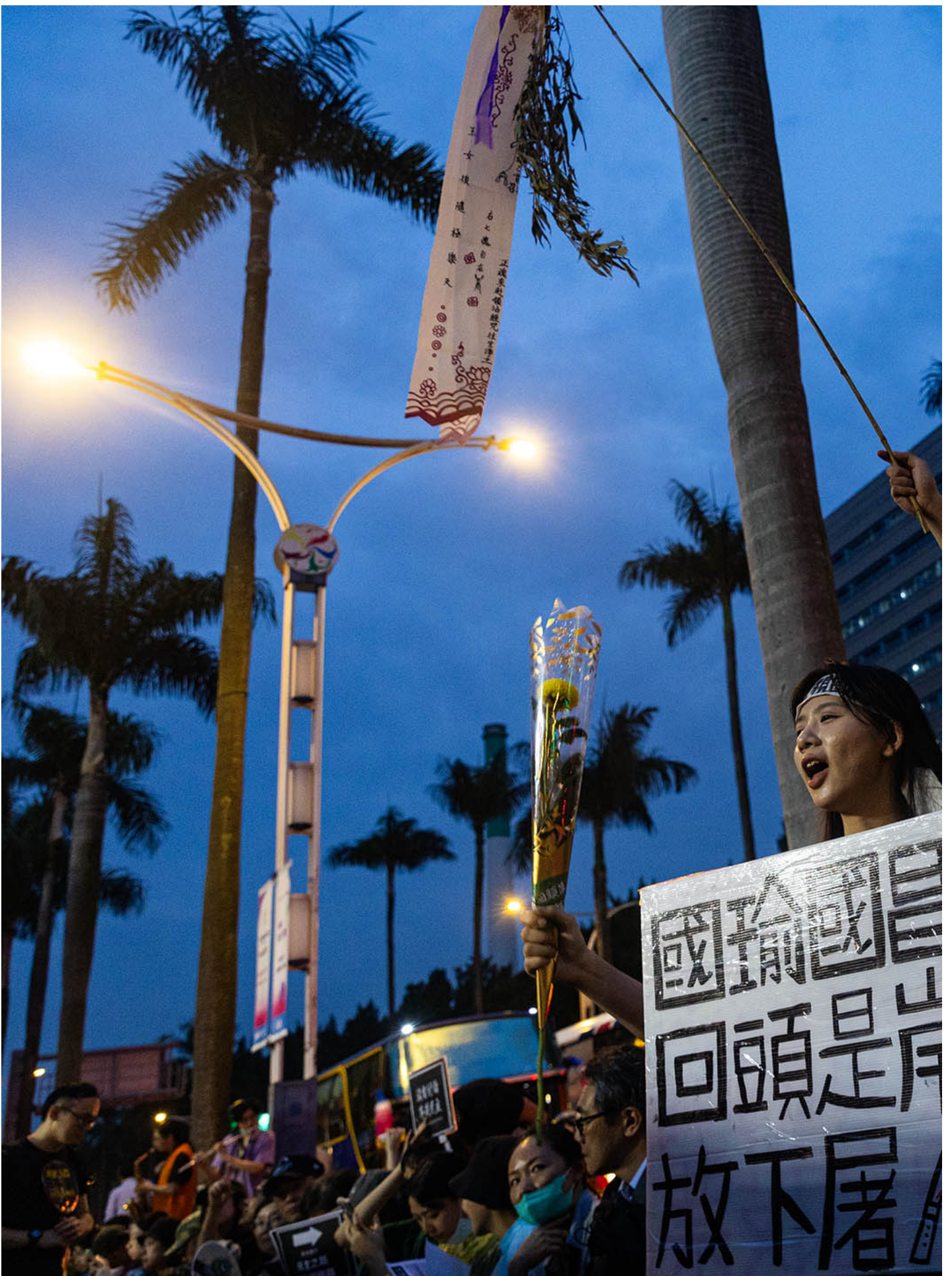
2024年5月24日，台北，立法院继续处理蓝白国会改革提案，立法院外示威者在集会。

当声援者手持太阳花、百合花，作为民主的象征时，不少人则提着菜市场买来的葱，在抗议蓝白阵营时，高举一把把的青葱，讥讽推行国会改革法案的黄国昌。