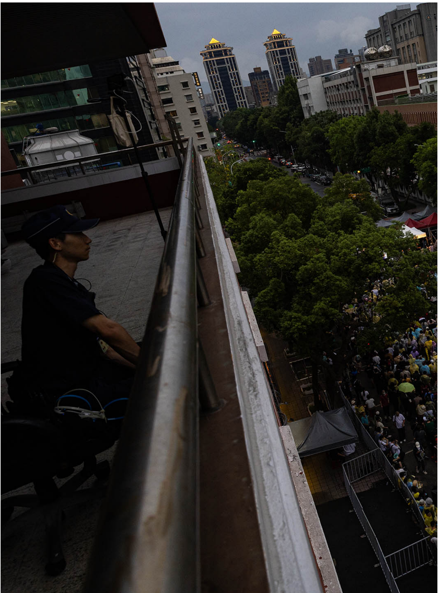
2024年5月24日，台北，立法院继续处理蓝白国会改革提案，示威者在立法院外集会。

在议场内审议的同时，议场外对此次改革及蓝白相关做法不满的民众也在集结。截至中午12时，主办单位宣布现场已有一万人到场，群众人潮也从青岛东路延伸至中山南路，另一侧的济南路也陆续有民众涌入。