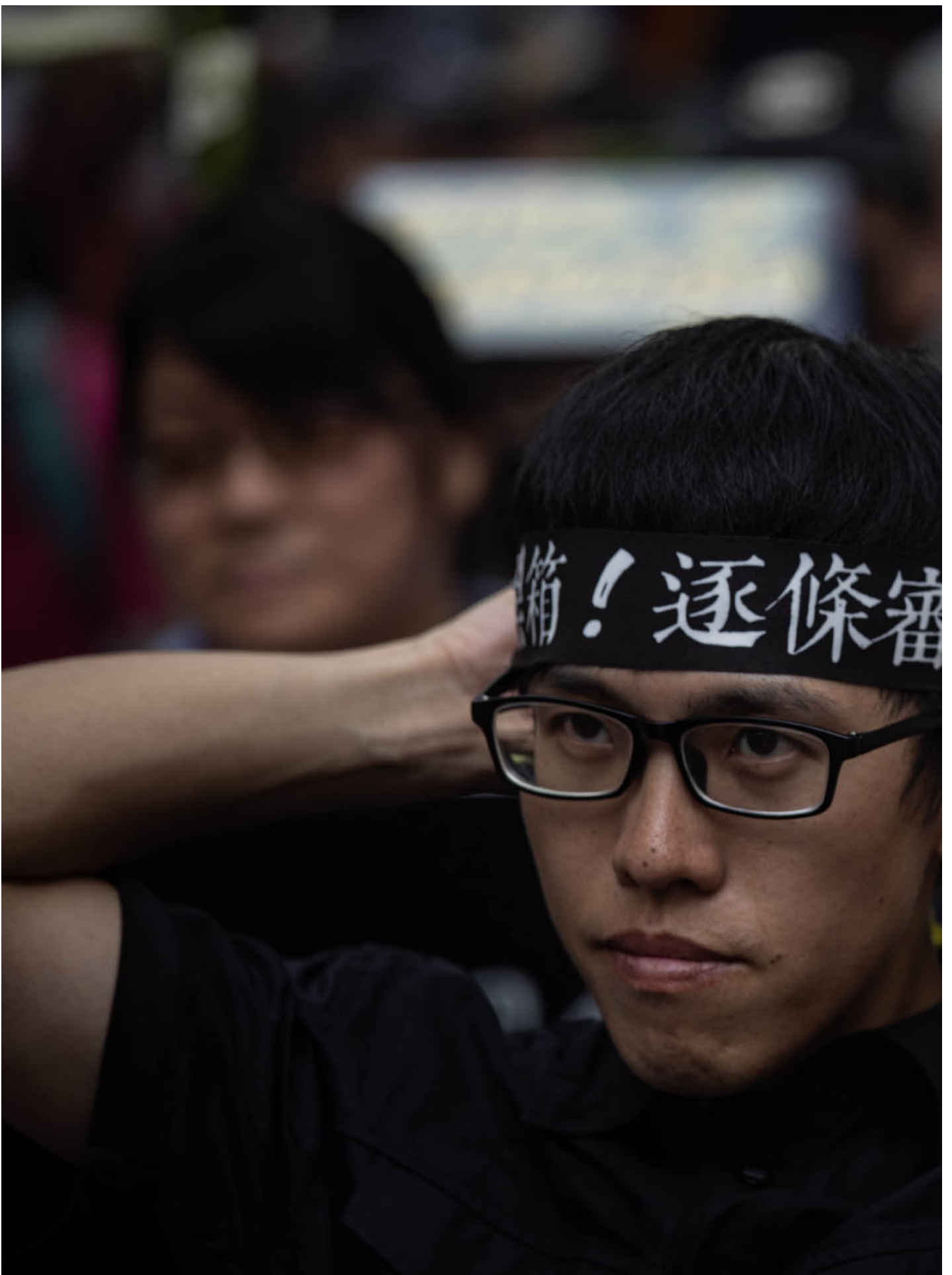
2024年5月24日，台北，立法院继续处理蓝白国会改革提案，示威者在立法院外集会。