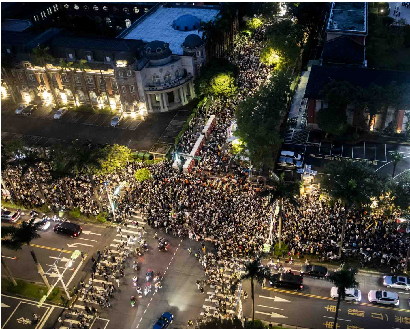
2024年5月24日，台北，立法院继续处理蓝白国会改革提案，从高处望去的青岛东路、济南路及中山南路，大量民众聚集立法院外抗议。

截至傍晚7时，人潮从青岛东路蔓延，站满中山南路双向车道，主办单位称“现场已经五万人”。