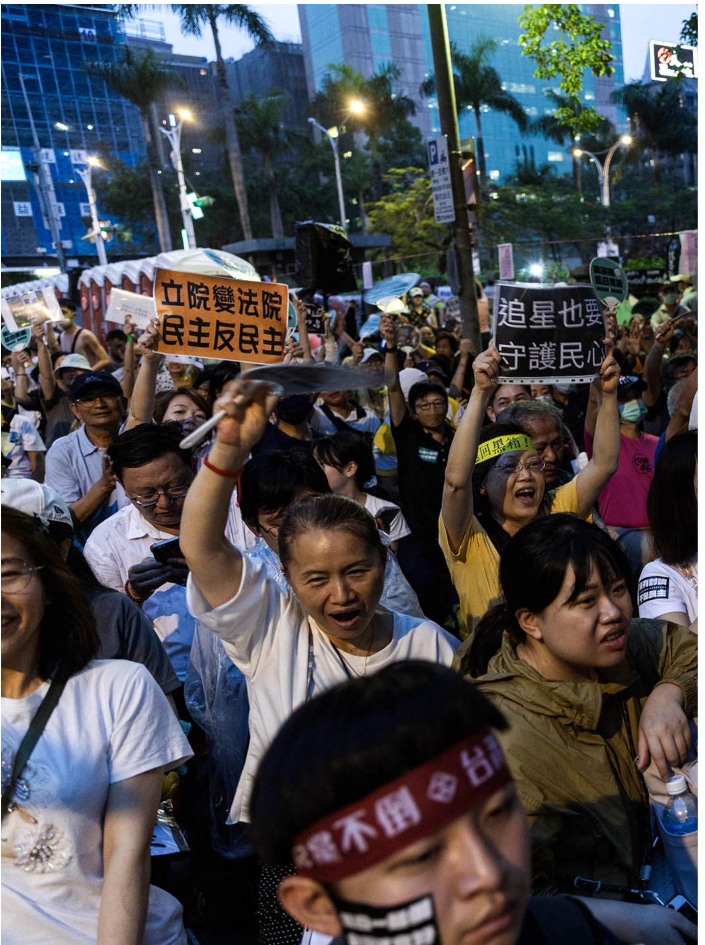
2024年5月24日，台北，立法院继续处理蓝白国会改革提案，示威者在立法院外集会。

晚间5时，下课学生与下班民众从青岛东路、林森南路交叉路口骑楼陆续涌入青岛东路集会，青岛东路上停放三台政治广告车，并以广告车为基准，以铁栅围成矩形。