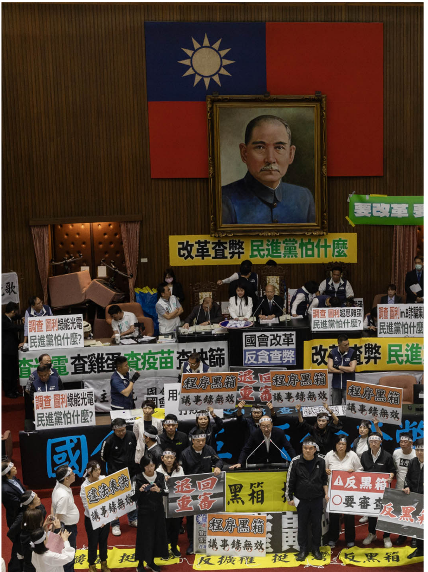
2024年5月24日，台北，立法院继续处理蓝白国会改革提案，民进党立委在立法院发言。

#国会 #立法院 #黄国昌 #民众党 #韩国瑜 #民进党 #国民党 #柯文哲 #台湾