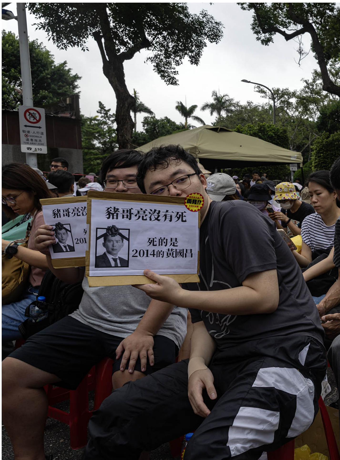
2024年5月24日，台北，立法院继续处理蓝白国会改革提案，示威者在立法院外集会。