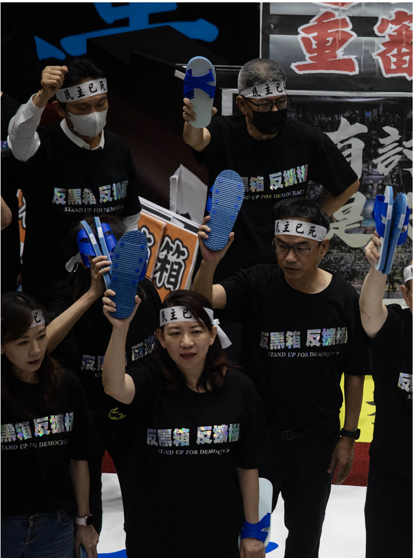
2024年5月24日，台北，立法院继续处理蓝白国会改革提案，民进党立委举起蓝白色的拖鞋。