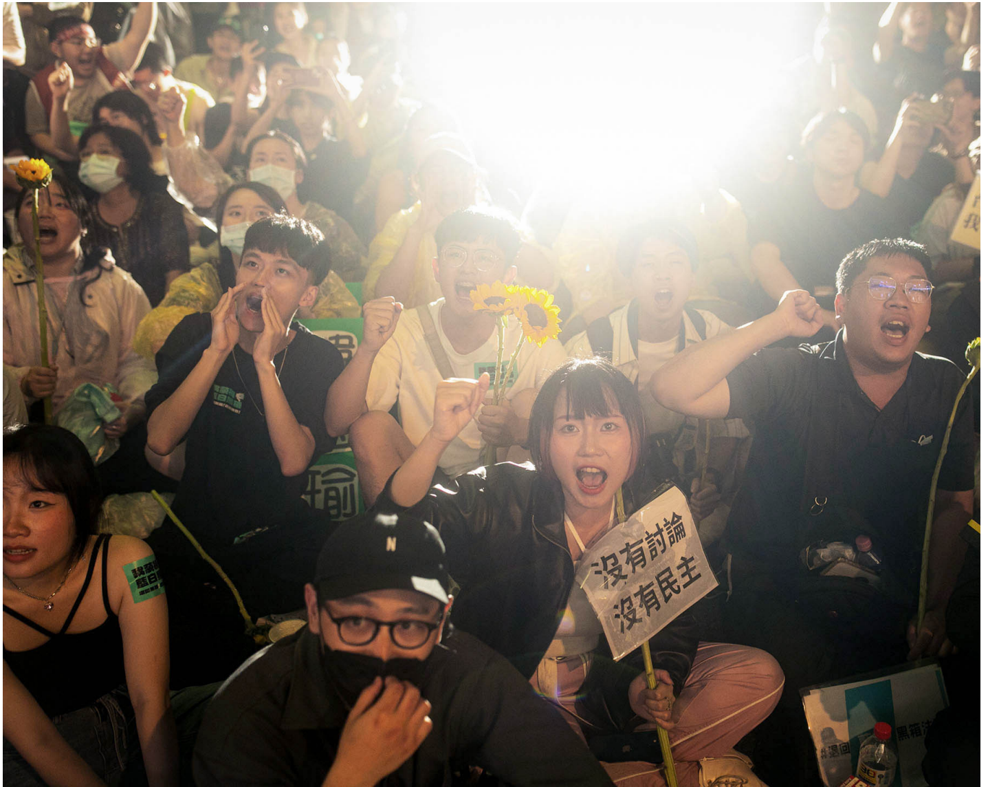
2024年5月21日，台北，立法院继续处理蓝白国会改革提案，场外上百万民众聚集抗议。